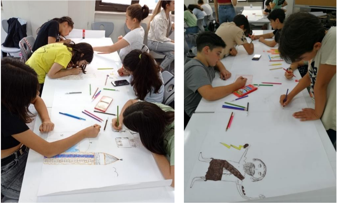
Şekil 8. Bilişsel Haritalama Oyunu

Etnografya Müzesi'ne ziyaretten sonra düzenlenen üçüncü oyunun amacı, Döşemealtı İlçesinin önemli somut olmayan kültürel miras değerlerinden olan Döşemealtı Halıları'nın renk, motif ve desen özelliklerini tanıtılmasıdır. 'Motiflerden Halı Oluşturma' oyununda, öğrencilerin bir ekip olarak karar alması ve görsel algı becerilerini geliştirmeleri hedeflenmiştir. Öğrenciler 6 kişilik bir ekip olarak uzlaşmaya varıp, halıyı temsil eden bir altlık üzerine seçtikleri motiflerden bir düzenleme oluşturmuş ve düzenledikleri desenlerin içlerini boyamıştır (Şekil 9 ve Şekil 10). Bu oyunun Döşemealtı halılarının temel özelliklerini tanımanın yanında, öğrencilere ekip içinde tartışma, ortak karar alma, özgün ve yaratıcı ürünler tasarlama gibi konularda da katkı sağlayacağı düşünülmüştür.