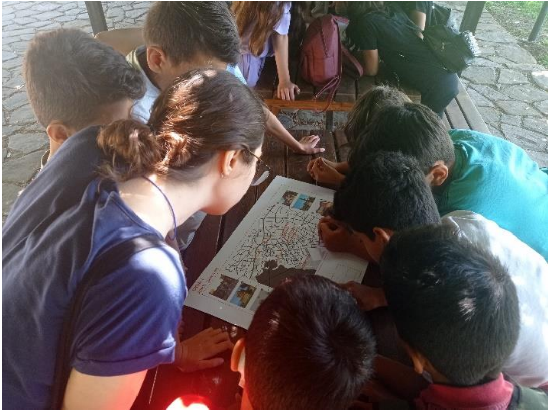
Şekil 6. Eşleştirme, Anlatma ve ‘Ben Neredeyim’ Oyunu

Öğrencilerin keşfettikleri, öğrendikleri ve deneyimledikleri bilgilerin yapılandırılmasına katkı sağlamak için eğitim süreci boyunca yapılan geziler üzerinden çeşitli oyunlar kurgulanmıştır. İlk oyun olan ‘Ben neredeyim?’ oyunu Kaleiçi gezisine odaklanmıştır. Oyunun ilk iki aşamasında öğrenciler gruplara ayrılmış, tarihi yapıların haritadaki yerini bulmuş ve üzerinde uzlaştıkları üç kelime ile onu anlatmıştır. Üçüncü aşamasında ise her grup gezi rotasında konumlanan bir yer seçmiş, karşı takımın cevabı evet-hayır olan sorular sorarak seçilen yeri harita üzerinden bulmaya çalışmıştır. Oyun oynanırken öğrenciler sürekli yeni öğrendikleri kelimeleri kullanmış -‘Yanımda cumbalı bir ev var mı?’, ‘Yivleri görüyor muyum?’, veya ‘Bir avlunun içinde miyim?’ gibi soruları sıklıkla birbirlerine sormuştur (Şekil 6 ve Şekil 7).