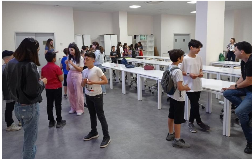
Şekil 1. Tanışma ve Tartışma Oyunu