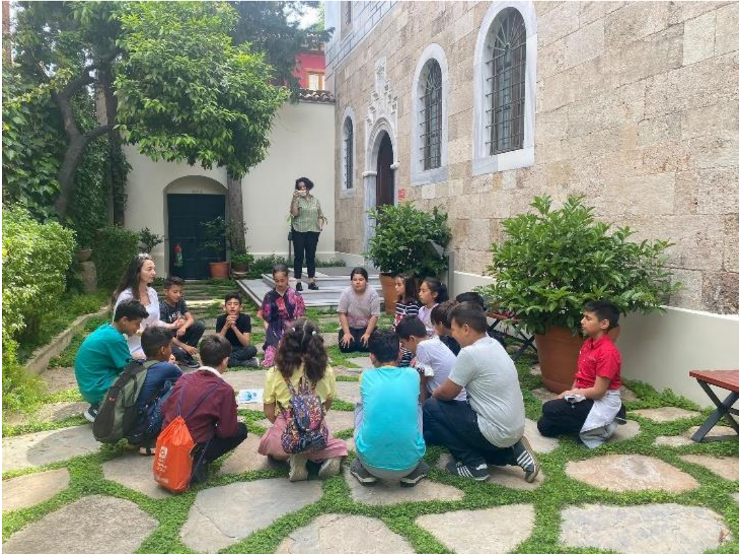
Şekil 5. Suna & İnan Kırac Kaleiçi Müzesi gezisi ve sonrasında oynanan hatırlama oyunları