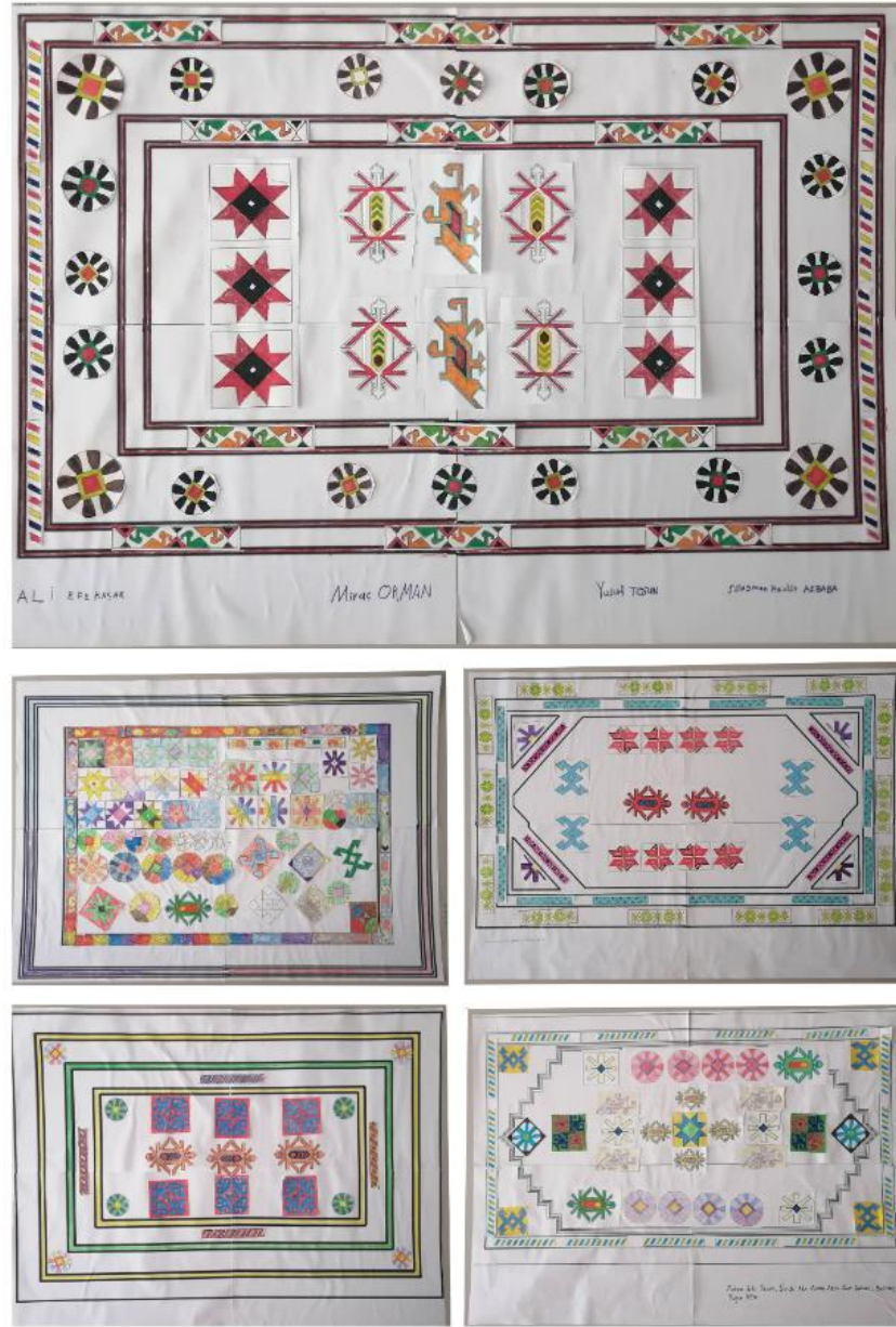
Şekil 10. 'Motiflerden Halı Oluşturma' Oyununda üretilen halılar