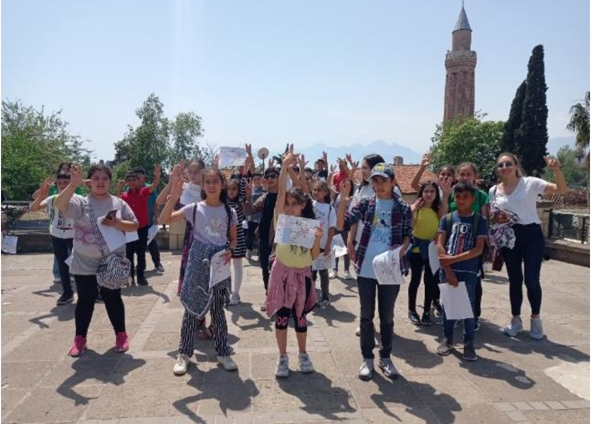
Şekil 3. Antalya Kaleiçi gezisi ve rota takibi

açısından da önemli görülmektedir. Kaleiçi'ne yapılan gezi sırasında öğrencilerin onlara verilen haritalardan gezinin rotasını ve duraklarını takip etmeleri beklenerek, kente dair mekansal algıları geliştirilmeye çalışılmıştır (Şekil 3). Kent tarihi ve yapıları, özgün nitelikleri ve onu korumaya değer kılan şeylerin ne olduğu konuları vurgulanarak anlatılmış, öğrencilerin gezilen yapıları özümsemeleri ve 'koruma' konusunu neden - sonuç ilişkisi kurarak ele almaları açısından bu yaklaşım önemli görülmüştür.