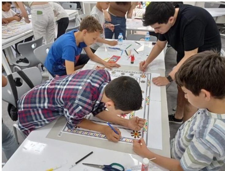
Şekil 9. Motiflerden Halı Oluşturma Oyunu

Etnografya Müzesi'ne ziyaretten sonra düzenlenen üçüncü oyunun amacı, Döşemealtı İlçesinin önemli somut olmayan kültürel miras değerlerinden olan Döşemealtı Halıları'nın renk, motif ve desen özelliklerini tanıtılmasıdır. 'Motiflerden Halı Oluşturma' oyununda, öğrencilerin bir ekip olarak karar alması ve görsel algı becerilerini geliştirmeleri hedeflenmiştir. Öğrenciler 6 kişilik bir ekip olarak uzlaşmaya varıp, halıyı temsil eden bir altlık üzerine seçtikleri motiflerden bir düzenleme oluşturmuş ve düzenledikleri desenlerin içlerini boyamıştır (Şekil 9 ve Şekil 10). Bu oyunun Döşemealtı halılarının temel özelliklerini tanımanın yanında, öğrencilere ekip içinde tartışma, ortak karar alma, özgün ve yaratıcı ürünler tasarlama gibi konularda da katkı sağlayacağı düşünülmüştür.