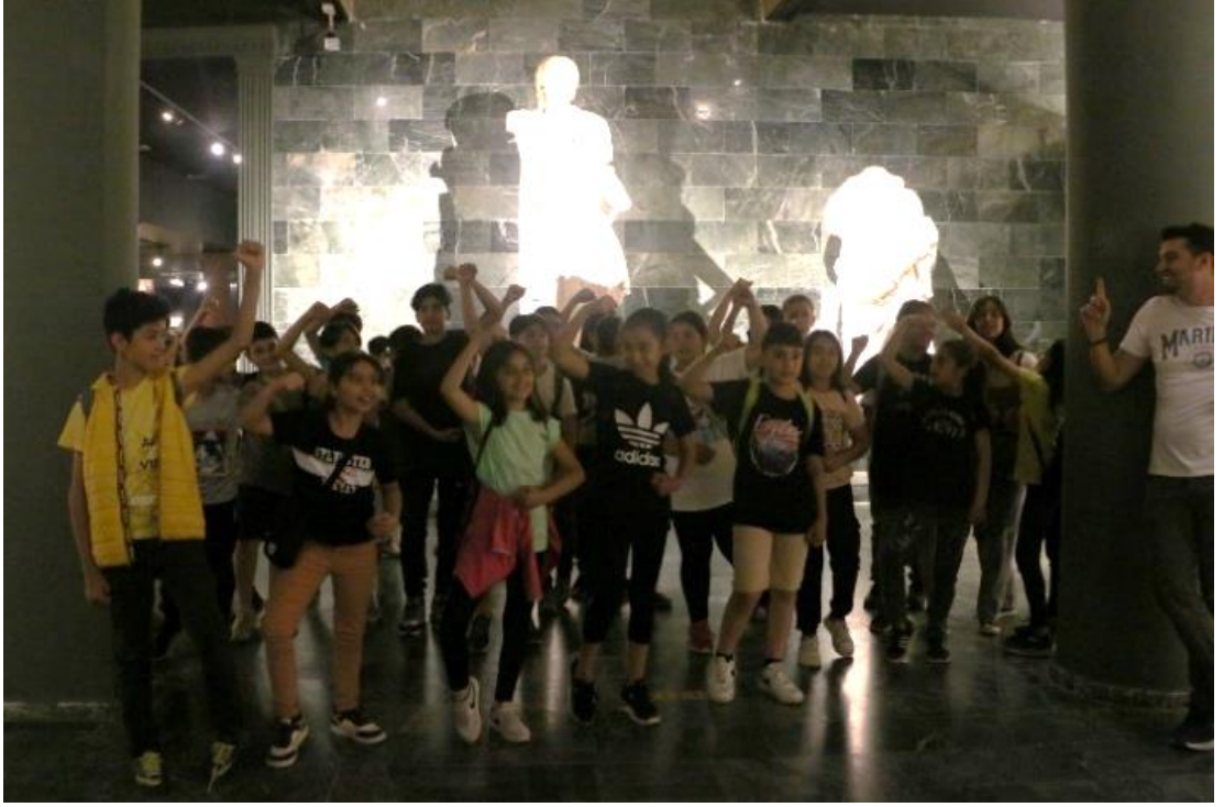
Şekil 4. Antalya Arkeoloji Müzesi Gezisi ve Heykel Canlandırma Oyunu