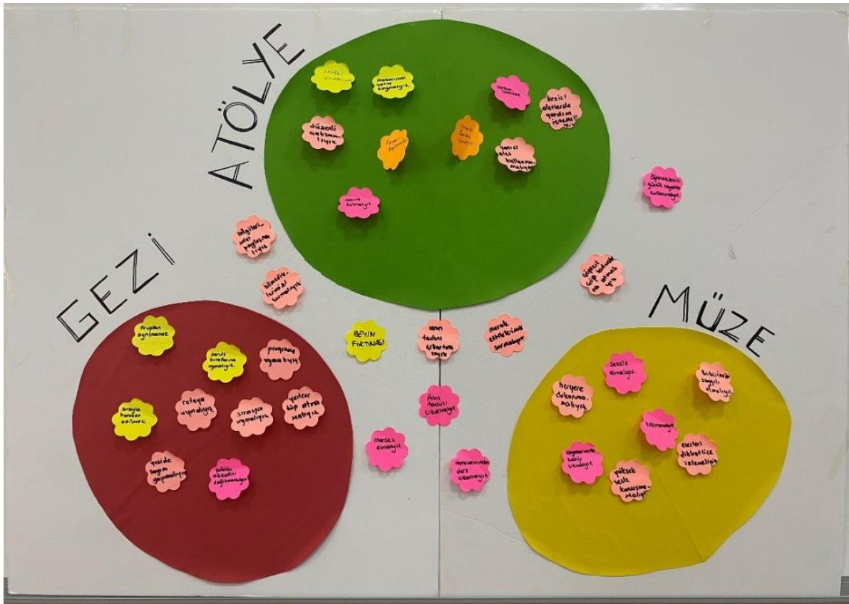
Şekil 2. Öğrenciler tarafından oluşturulan karar ağacı

İkinci bir yaklaşım olarak, öğretmenler ve öğrenciler arasındaki hiyerarşinin kırılması için öğrencilerin nerede, nasıl davranılacağına dair kuralları kendilerinin oluşturması istenmiştir. Öğrencileri dikte edici bir kural sistemine tabi kılmaktansa, kendi aralarında tartışarak etkinlik sırasında nelerin yapılması ve yapılmaması gerektiğini belirlemeleri ve kuralları kendilerinin oluşturmaları önemli görülmüştür. Bu doğrultuda ilk gün bir ‘Karar Ağacı’ hazırlanmış ve öğrenciler yer yer yönlendirilip, yer yer özgür bırakılarak gezi boyunca uyulması gereken kuralları kendileri belirlemiştir. Karar Ağacı’na ‘Müzedeki konuşmamalıyız’, gibi yapılmaması gereken hareketlerin yanısıra, ‘Gezide öğretmenlerimizi takip etmeliyiz’, ‘Merak ettiğimiz soruları sormalıyız’, ‘Açık alanlarda sesli konuşabiliriz’ gibi öneri ve imkan içeren olumlu ifadelerin eklenmesine de dikkat edilerek daha keyifli ve açık bir öğrenme ortamı yaratılmaya çalışılmıştır (Şekil 2).