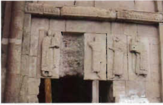
Şekil 4. Kilise duvarlarından sökülen taşlar nedeni ile çeşitli kabartmalar tahrip olmakta ve geçici tedbirlerle kısmen korunmaya çalışılmaktadır.

Takaichvilli, kilisenin ilk kuruluşunda kütüphane ve yemekhaneden oluşan bir manastır topluluğu şeklinde inşa edildiğini bildirmektedir. Ancak bugün bunlardan yalnızca kilise ayakta kalmıştır. Diğer bölümlerin izleri dahi mevcut değildir. 21