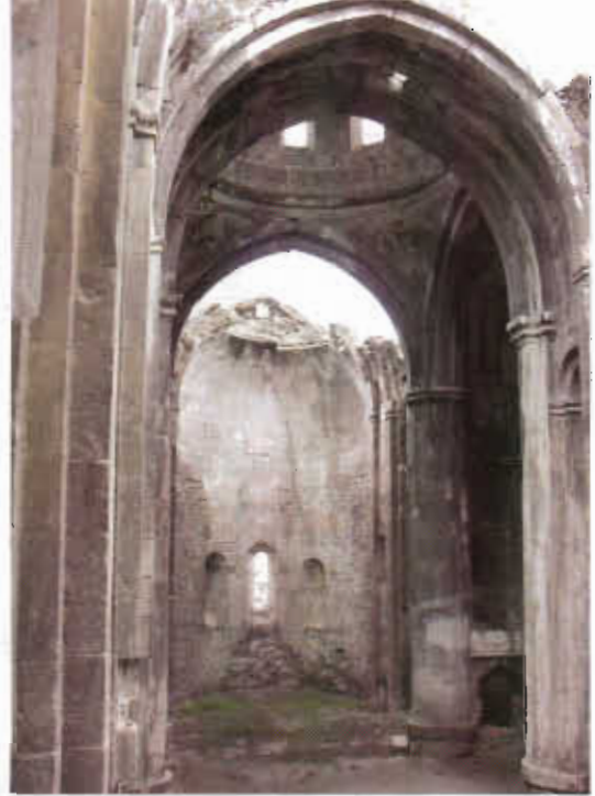
Şekil 5. Onarım ve koruma tedbirleri uygulanmadığından kilisenin çatı sistemi sürekli olarak tahrip olmaktadır.

Öşvank kilisesinin yanı sıra Kuzey Doğu Anadolu'da Çoruh, Oltu ve Tortum'un muhteşem manzaralı vadilerinde yer alan benzer örnekler tarihi değerleriyle birlikte bölgedeki turizmi artıracak öneme sahiptirler. 23