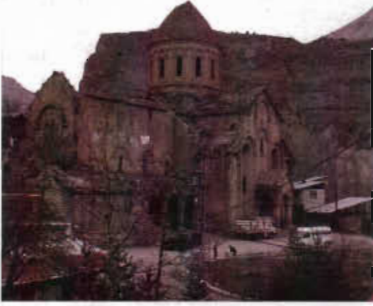
Şekil 7. Çamlıyamaç köyünde plansız yapılaşmalar (yapı materyali, çatı sistemleri, boyama v.s.) ve altyapı (elektrik ve telefon hatları) nedeniyle tarihi kilise ve köy yerleşimi birbirine yabancılaşmış durumda.

Tarihi kilise çatısında gelişen çalı ve diğer bitkisel materyalinin kök sistemlerinin gelişmesi ile çatının aşınmasına ve statik dengenin bozulmasına neden olması (Şekil 8),