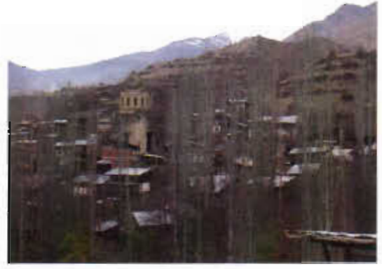
Şekil 3. Öşvank kilisesinin Çamlıyamaç köyü içerisindeki konumu ve bu yerleşimden genel bir görünüm

Öşvank Kilisesi bir manastırın ana kilisesidir. Manastır bulunduğu köyün eski ismiyle Öşk (Oşki-Osckhi) manastırı olarak tanınmaktadır. Manastır, Vaftizci Yahya'ya adanan ana kilise, kilisenin yaklaşık 75 m. doğusundaki skriptorium olduğu düşünülen yapı ve kilisenin yaklaşık 300 m. batısında, köy evleri arasında yer alan biri harap, diğeri iyi durumda günümüze ulaşan iki şapelden oluşmaktadır. 17 Şekil 3'te Öşvank Kilisesi'nin köy yerleşimi içindeki genel bir görünüşü verilmiştir.