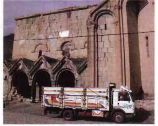
Şekil 6. Kilisenin ön cephesi yönünde araç parkı yapılması süreklilik arz etmektedir.

Öşvank Kilisesi'nin fiziki durumu ile ilgili ilk tespitler, Kültür ve Turizm Bakanlığı tarafından 1978 yılında yapılmıştır. Öşvank kilisesi köy yerleşim alanının merkezinde yer almış ve neredeyse günümüze kadar yapılaşma baskısı (kiliseden ev ve diğer amaçlı yapı yapmak için taş sökülmesi gibi) ile karşı karşıya kalmıştır. Alanda yapılan incelemelerde kilisenin hemen bitişiğinde cami, muhtarlık ve çeşitli yerleşimler bulunduğu, bunların da tarihi yapıyı olumsuz yönde etkilediği ve kilisenin iç avlusunun da araçlar için park yeri olarak kullanıldığı saptanmıştır (Şekil 6). Kilisenin sağ yan duvarına depo olarak bir yapı inşa edilmiştir. Tarihi kilise köy yerleşiminden hiçbir şekilde herhangi bir duvar, çit ya da paravan ile ayrılmadığından 1978 yılında Kültür ve Tabiat Varlıkları Koruma Kurulu tarafından tarihi eser olarak tescilleninceye kadar sürekli tahrip edilmiştir. Kiliseyi, konutlardan ayıran bir sınırlama olmadığı için sadece insanlar değil aynı zamanda küçük ve büyükbaş hayvanların da olumsuz etkileri söz konusudur.