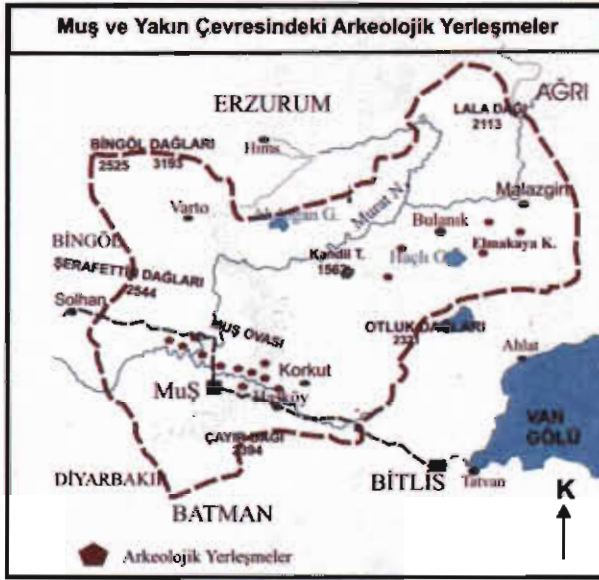
Resim-1: Muş-Bulanık Elmakaya Köyü ve Civarındaki Arkeolojik Yerleşimleri Gösterir Harita.