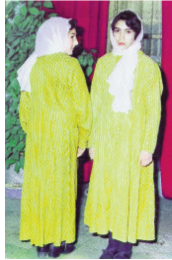
Resim-7: Gezi kumaştan yapılmış günlük kıyafet (S.Bulut'tan)

Gündelik hayatta kullanılan kadın giysileri arasında bu gün artık çok fazla görülmeyen ancak yakın zamanlara kadar varlığını sürdüren ve gezi kumaştan yapılan kıyafetler vardır. Uzun bir entari tarzında olan bu kıyafet ince dokulu bir özelliğe sahip kendinden çizgili gezi kumaşından yapılırdı. Baştan geçirilerek giyilen kıyafetin boyu ayak bileklerinin biraz üzerine kadar uzanmakta olup kol boyu da el bileklerine kadar uzundur. Ayaklara çizme, ayakkabı veya yemeni giyilirken başta yine beyaz bir tülbent sarılarak kullanılmaktadır (Resim-7).