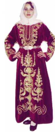
Resim-2: Geleneksel kadın kıyafeti (Bindallı).

B-Bedene Giyilenler: Bedene giyilen kıyafet parçaları üst beden ve alt beden olarak tasnif edilir. Üst bedene bindallı, entari, cepken giyilirken; alt bedene içdonu (dizlik), nadir de olsa şalvar giyilir.