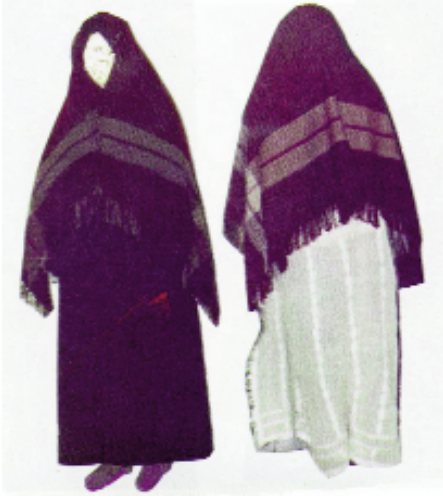
Resim-10A/B: Atkı (İ.C.Atılcan ve Z.Çomaklı'dan).

Karnavas Bezi: Olur ilçesinin Ormanağzı Köyü'nde Karnavas bezi adı verilen bir dokuma, ehramın yerine kullanılmaktadır (Resim-11). Kadınlar dışarı çıkarken bu örtüyü başlarının üzerine örterler. 25 Yöreye has olarak el tezgâhlarında dokunan bu kumaş türü pamuk ipliğinden yapılmaktadır. Üzerinde çeşitli motiflerle yapılmış süslemeler vardır. Kenarları da genellikle ince çizgiler ve şeritler halinde bordürlerle sınırlandırılmıştır.