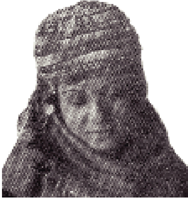
Resim-1: Milli Folklor Dergisi'nde yayınlanan başlık.

birlikte kadınlar sokağa çıkarken, giydikleri ehram, çarşaf gibi giysilere rastlamak hala mümkündür. 4