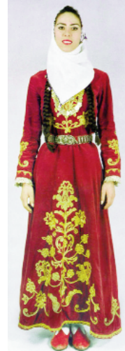
Resim-3: Geleneksel kadın kıyafeti (Bindallı).