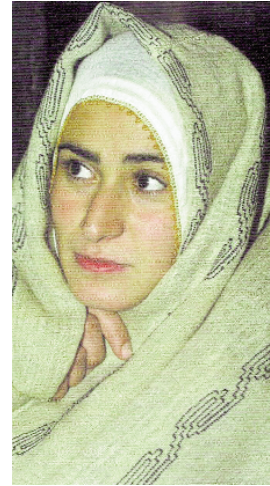
Resim-9A/B: İşlemeli ve sade olan iki ehram örneği (İ.C.Atılcın ve Z.Çomaklı'dan).