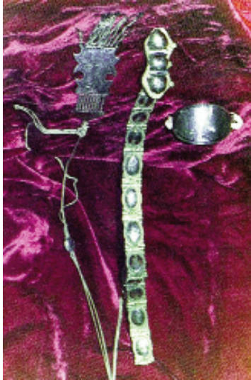
Resim-6: Takılar ve Aksesuarlar (İ.C.Atılcan'dan).

Takılar: Boyuna beşi birlik, Oltu taşı kolyeler, kollara burma bilezik parmaklara da yüzük takılmaktadır (Resim-6). Erzurum Arkeoloji Müzesi'nde bulunan gümüşten yapılmış çeşitli tepelikler, kolyeler ve gerdanlıklar, saç bağları eski Erzurum kadınının süse ne kadar düşkün olduğunu gösteren nadide örneklerdir.