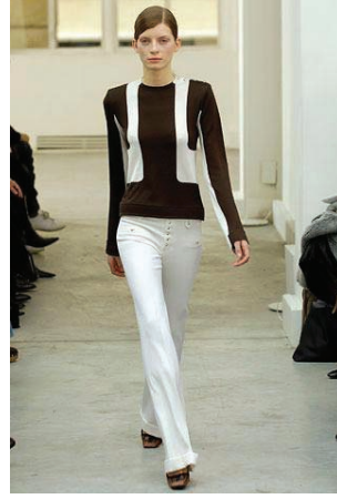
Resim-5: Nicolas Ghesquiere 2005

Milano, Memphis, Catalonia'ya ait tasarım akımları yani Gianni Versace'nin, Giorgio Armani'nin tasarımları 1980'li yıllarda koleksiyonlar üzerinde etkili olmuştur.