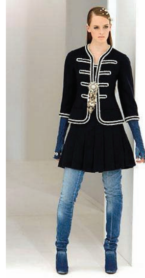
Resim-2: Karl Lagerfeld 2007 14

Almanya'da Weimar çağı olarak nitelendirilen bu dönemin etkilerini taşıyan Marilyn Manson ve fetiş model Dita Von Teese ve onların tarzı olan deri korseler, file çoraplar John Galliano'nun 2000li yıllarda tasarladığı yeni Dior koleksiyonlarının ilhamını oluşturmuştur. 13