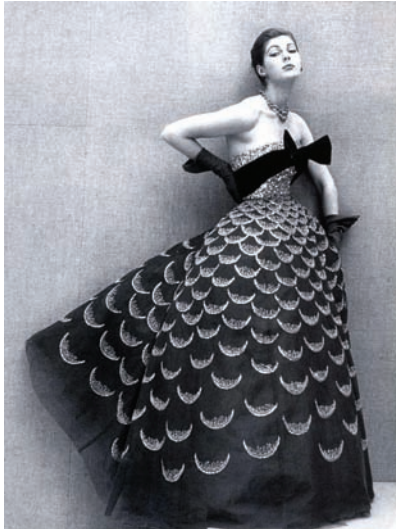
Resim-4: Christian Dior Couture 1951 18

*Erken rock dönemi: geç 1940'ların ve erken 1950'lerin birçok popüler müzik türünün karışımından oluşan Rock'n roll müziğinin başlangıç dönemleridir. Basit bir müzik tarzının çok ötesinde, yaşam tarzlarını, modayı, davranışları ve dili etkilemiştir. 16 MOWER Sarah, www.style.com.fashion NEW YORK, Şubat 16, 2009