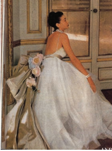
Resim-8: Christian Dior 1956 Harper's Bazaar 19

Rıfat Özbek'in yeni tasarımcısı olduğu Pollini markası için hazırladığı yeni koleksiyonlarda, Osmanlı İmparatorluğu, Tibet ve 1940'lı yıllara ait etkileşimler görülmektedir. Moda tasarımcısı Nicolas Ghesquiere'nin 2005 yılında Balenciaga için hazırladığı geçmişle günümüzü büyük bir ustalıkla birleştirdiği resim 5 ve resim 6 da görülen "1960'lı yılların retrospektifi" koleksiyonunda 60'ların önemli modacısı resim 7 deki Futuristik* akımın takipçisi Andre Courreges etkileri görülmektedir. 2005'te 1970'lerin nostaljisine ağırlık veren modacılar arasında Anna Sui, Emilio Pucci, Diane Von Furstenberg, Luella, Burberry Prorsum sayılabilir.