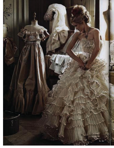
Resim-9: Harper's Bazaar 2008 20

yaşatmıştır. Bu korku, batı toplumunu, teknolojiyle yüklü geleceğin bilinmeyenleri endişesiyle geçmişe yönlendirmiş, moda tasarımında nostaljik yaklaşımların güçlenmesine neden olmuştur.