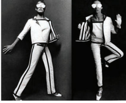
Resim-7: Andre Courreges 1960