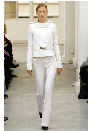
Resim-6: Nicolas Ghesquiere 2005