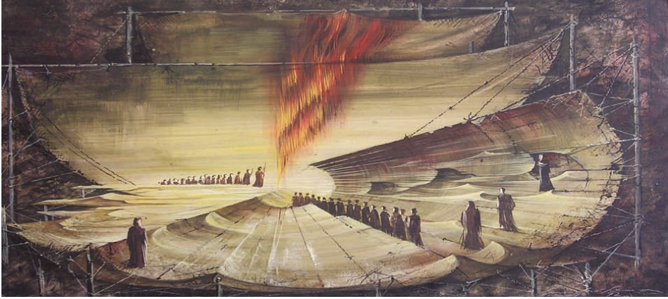
Çizim-2: Moses ve Aron, 1972, reji Ottoschenk, Grand Opera, Fransa - Paris.