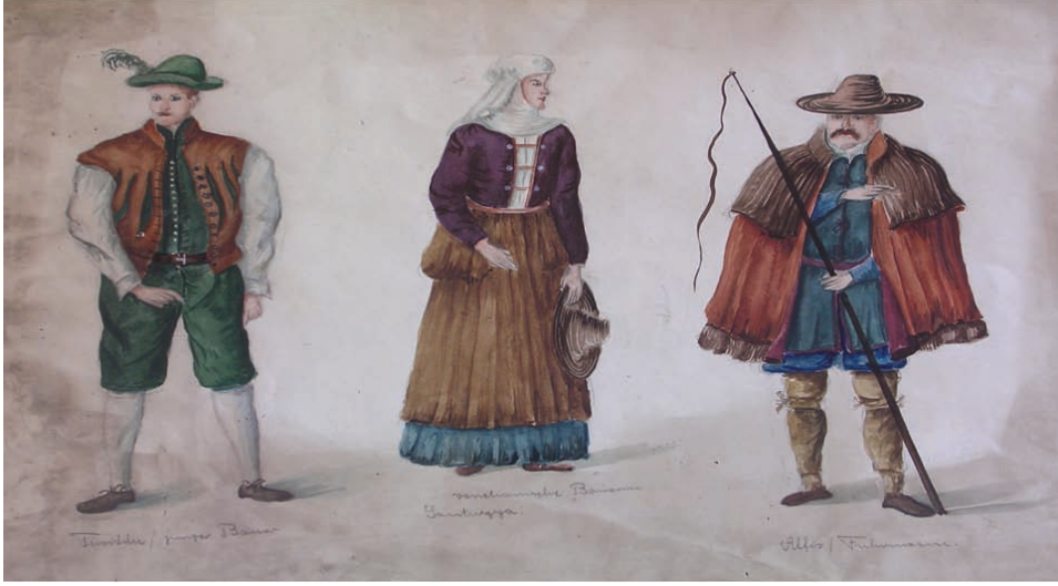
Çizim-5: Kostüm Çalışması (adsız).