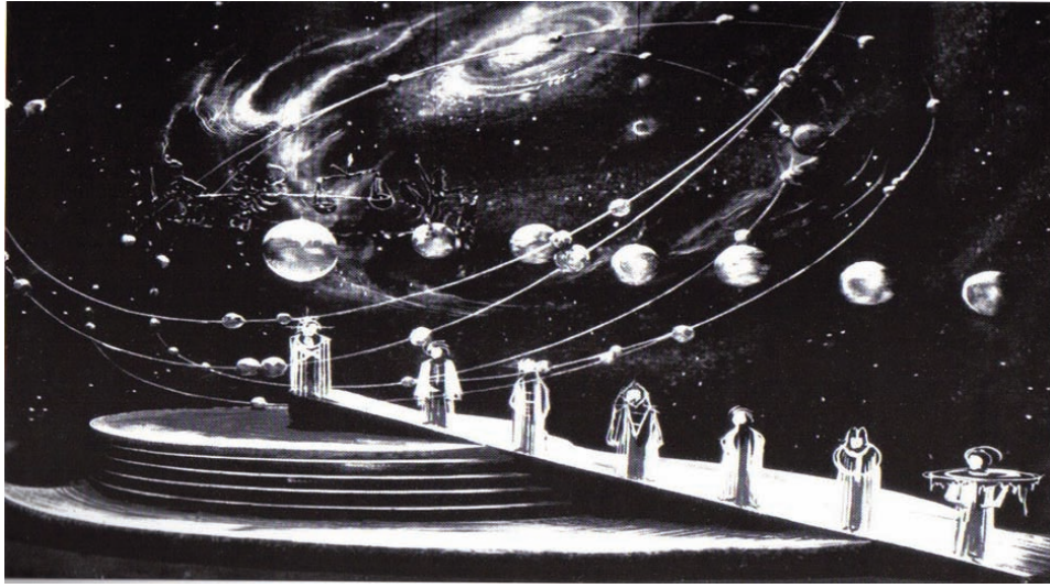
Çizim-6: Dünyanın Harmonisi, Die Bühne mein Leben, s. 14.

“Topluma geleceği düşünmeyi öğreten tiyatrodur. Bu tasarım anlayışında; yıldızlarla gelecekteki durumlarından kaderi anlamak ya da farz edebilmek için ‘kozmetik-galaksi’ sistemi vurgulanır. Bunun ötesinde insanın kendine kıymaması üzerine çalışmalar yapılmaktadır.” (Bkz Çizim 8, 9).