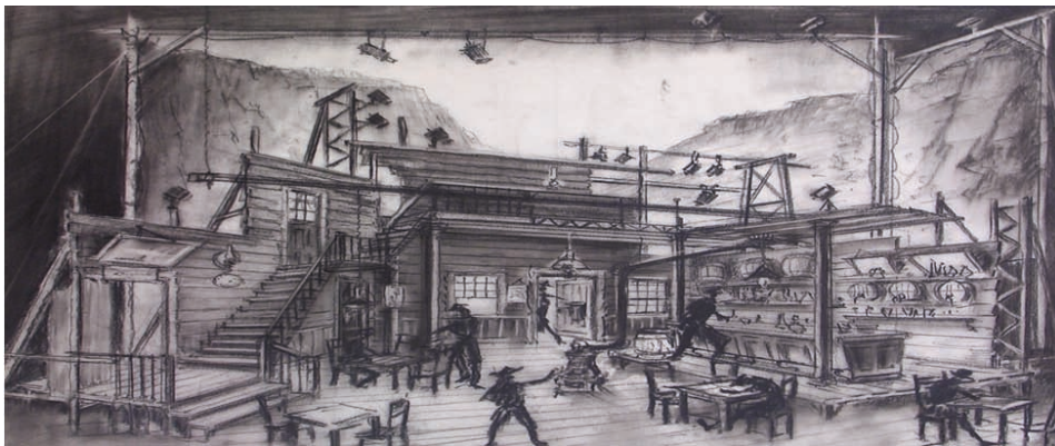
Çizim-3: Kız Çocuđu, Hollanda Festivali, 1982, reji Götze Friedrich.