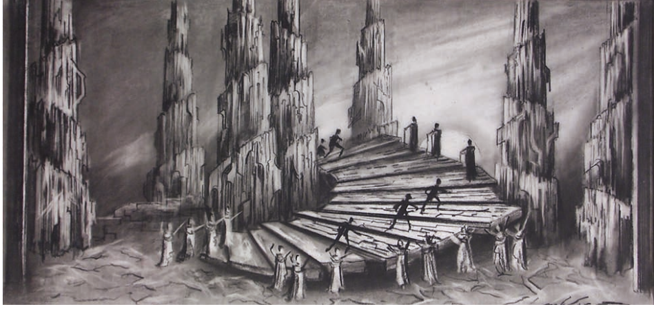
Çizim-1: Samson ve Dalia, 1984, reji: Cian Carlo del Monaco, Fransa- Niza.

New York, Opera San Francisco, Miami Opera , Opera Of Colorado,Denver, Grand Opera Houston, Oper Los Ageles, Boston Massacues, Opera Seattle İtalya: Scala Milano, Teatro La Fenice Venedig, Teatro San Carlo Dı Napoli, Arena Die Verona Batı Afrika: Staatstheater , Nico Malan Opera House Kapstad, İsrail: İsrail Festival Tel Aviv ve diğere birçok ÷lke.