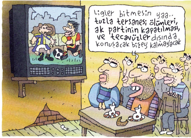
Resim-4: Metin Üstündağ, "Futbolun Büyüsü", PENGUEN, 2008.