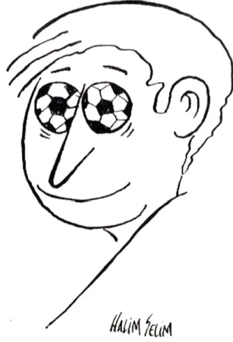
Resim-8: Selçuk Hünerli, "Futbol", Aydınlık , 1991.

ilde tanımlanabilecek olan futbol kimliği diğer toplumsal anlamlar ve öznelliklerden bağımsız bir şekilde var olmasa ve bunların bir kesim noktası ve göstereni olsa da tekil anlamlara ya da öznelliklere indirgenemeyecek bir özgüllük ve özerkliğe sahip görünmektedir.