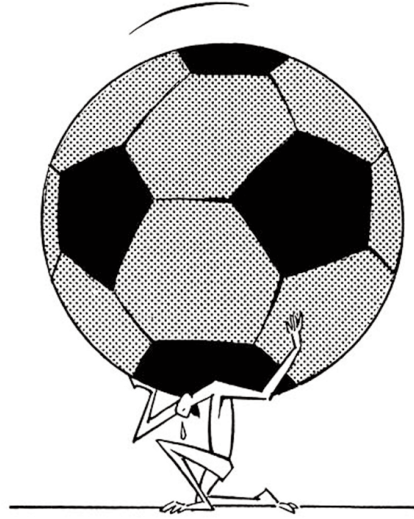
Resim-7: Turhan Selçuk, Futbol.

Karikatürde grupla değer ve iftihar duygularını paylaşarak günlük hayatın hayal kırıklıklarından, tatminsizliklerden ve monotonluğundan kaçarak yeni bir dünyanın kurulması anlatılmaktadır. Futbolun dünya çapında ilgi görmesinde, oyunun kendi özelliklerinden ve toplumsal değişim ile dönüşümlerden kaynaklanan çeşitli nedenlerle birlikte, günlük yaşamla olan benzerliğinin “toplumdaki merkezi değerleri yoğunlaşmış biçimde görünür kılmasının” önemi büyüktür. Taraftarlık, taraf olma, yani bir takıma karşı eğilim gösterme, onu destekleme, o takımın davranışlarına taraf olma, sempati duyma olarak da açıklanabilir. Turhan Selçuk’un karikatüründe olduğu takımın başarısızlığı fanatik bir taraftar için futbolun bireysel zevkten, benliğin çöküntü içine girmesine neden olur. Takımın gücü ve başarısı benliği destekler, başarısızlık durumu ise tahrip eder. Bu durum, düzenli bir seyirci topluluğunun bazı durumlarda dehşete kapılmış, kural tanımayan, saldırgan bir davranışa sevk edebilir. Bireysel seviyede veya toplumsal yaşamın bütün aşamalarında bu zihniyet egemen olduğunda, yenilgiler her şeyin kaybı olarak değerlendirildiğinde; korku ve ümitsizlik duyguları herkesi etkilemektedir. Bir taraftar için tuttuğu takımın işlevi bir referans grubu olarak görülmekte ve onun başarısı, kendisi için bir tür güven ve iftihar duygusunun kaynağı olmaktadır. Bu nedenle, taraftarı olduğu takımın yenilgisine katlanamayan bir kişinin intiharı, bir anda kendini tanımlayan ögenin sarsılmasıyla açıklanabilir.