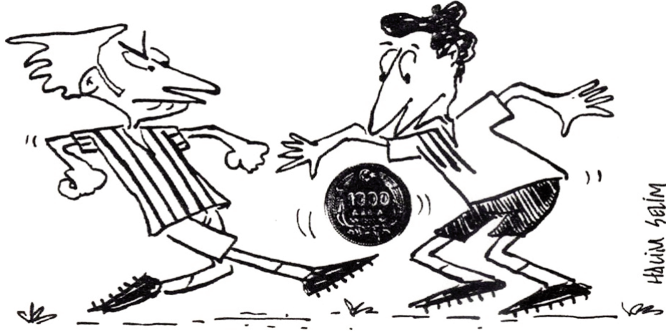
Resim-3: Selçuk Hünerli, “Futbol”, Aydınlık , 1991.

Türkiye’de toplumsal ve kültürel dokunun kolayca örtüştüğü futbol, kısa bir sürede bir oyundan amansız bir rekabete dönüşürken başta medya olmak üzere oluşan koşulların da etkisiyle “Mahalli Şovenizm” ya da “kent savaşları” olarak bilinen görünümüyle kitlesel bir tehdit haline gelmiştir. Belirli bir süreç içerisinde kurgulanış futbolcuların oyun içerisindeki kazanma odaklı iktidar mücadelesi ile oyun dışı rol güçler arasındaki ilişkilerin oyuna müdahil olarak iktidarı ele geçirme çabası sporun yozlaşmasına neden olmaktadır. Futbol oyununda bu yozlaşmanın giderilmesi demokratik bir yapıya sahip olması ve “eşitlik” kavramı üzerinde temellenmesi, oyun kuralları ve tribünlerde “tarafdar” kimliği altında tüm sosyal farklılıkların ortadan kalkması kent kalabalıklarının bu oyuna yönelmesinde önemli etkindir.