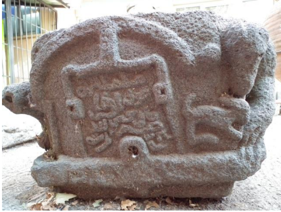
Foto. 3- Çankırı Müzesi'nin Bahçesinde Sergilenen Mimari Parçanın Ana Yüzü