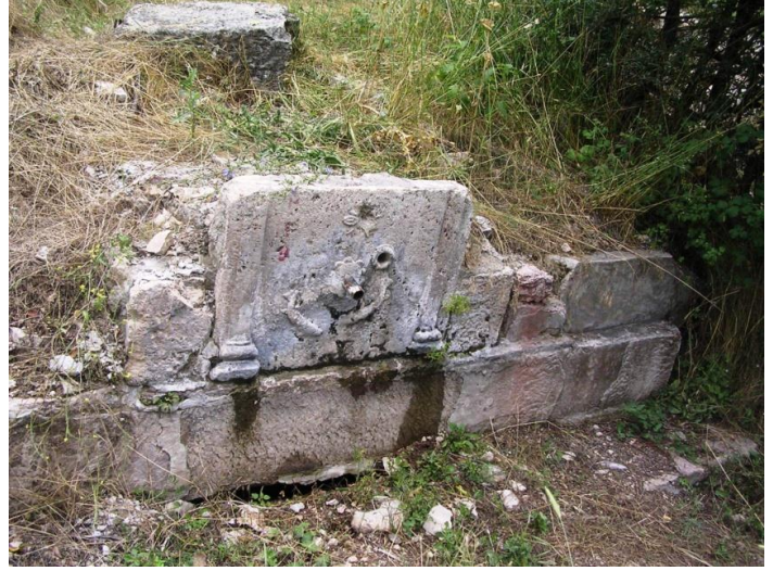
Foto. 6- Bayramören/Balıklı Pınar (Osman Ağa Çeşmesi)'daki Balık Figürleri