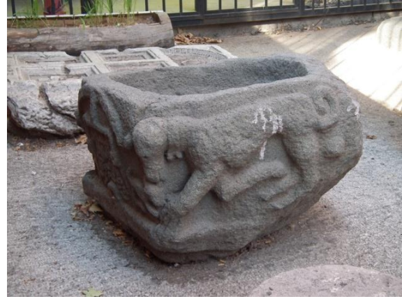
Foto. 4- Çankırı Müzesi'nin Bahçesinde Sergilenen Mimari Parçanın Sağ Yan Yüzü

Kitabenin alt kısmında, yuvarlak şekilli bir lüle deliği bulunmaktadır. Bu cephenin sağ tarafında, sağ yan cepheyle bağlantılı bir figüre (muhtemelen bir tavşan) yer verilmiştir. Beraberce değerlendirecek olursak, sağ yan cephede bir tazı ile onun avladığı tavşan tasvir edilmiştir. Tavşan, arka ayakları üzerine çökmüş, ön ayaklarını öne doğru uzatmış bir pozisyonda, profilden verilmiştir. Baş, kulak, ayaklar ve kuyruğuyla birlikte gövdenin uzuvları genel hatlarıyla yansıtılmaya çalışılmıştır. Kuyruk yukarıya doğru kıvrılmıştır. Taşın sağ yan yüzünü süsleyen tazı, baş ve ayağıyla avını yakalar pozisyonda tasvir edilmiştir. Başıyla ve ayağıyla avına bir yakınlık hissi vermektedir. Tazı, sağdan sola yürür vaziyette, sol ayağı ile avını kontrol ederken, sağ ayağı ön ve arka ayakları arasına geriye doğru kıvrılarak oradaki boşluğu doldurmuştur. Boynunda bir tasma asılıdır, tasmanın da boyun altında, yani orta kısmında iri bir şey asılıdır. Arkaya yatık kulakları, yuvarlak gözleri, açık ağzı ve burnu ile vücuduna nazaran oldukça mutedil görümlü başı, daha aşağıda bulunan avına doğru eğilmiş durumdadır. Uzun kuyruk, üst kısımda yukarıya ve içeriye doğru kıvrılarak bir daire motifi oluşturarak tasvirin arka tarafındaki boşluğu doldurmaktadır (Çizim 3, Foto. 4).