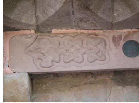
Foto. 1- Çankırı Şifahanesi'nin Giriş Kapı Lentosundaki Ejder Figürünün Mevcut Durumu

Şifahane'ye ait iki figürlü plastik bezeme söz konusudur. Bu iki bezemeden birincisi, günümüzde mevcut olmayan ve yerine imitasyonu yerleştirilmiş olan 1.00 x 0.25 m. ölçülerinde mermer levha üzerine işlenmiş dörder boğumla birbirine bağlanan bir çift ejder