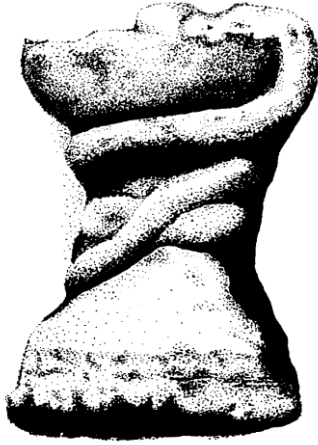
Çizim 2- Çankırı Şifahanesi'nde Bulunan Yılan Figürünün Çizimi (F. Salman)

Şifahane'den Çankırı Hastanesi'ne nakledilen, günümüzde de restore edilerek Çankırı Müzesi'nde sergilenmekte olan ikinci figürlü bezeme ise, bir havuza sarılmış vaziyetteki yılan figüründen ibarettir. Bu bezeme, kare bir kaide üzerinde oturan ve düz şekilde son bulan yüksekçe bir boyundan oluşan çan şeklindeki havuzun etrafına dolanan yılan figüründen meydana gelmektedir. Kaide kısmından ince bir kuyrukla başlayan yılan figürü, havuzun gövdesine üç kere dolandıktan sonra üst kısımda kalın bir başla son bulmaktadır 5 (Çizim 2, Foto. 2).