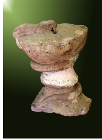
Foto. 2- Çankırı Şifahanesi'ne Ait Yılanlı Fiskiye'nin Görünüşü (Çankırı Müzesi)