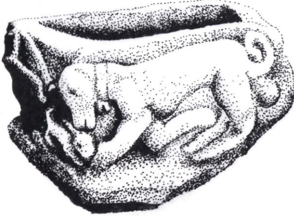
Çizim 3- Çankırı Müzesi'nin Bahçesinde Sergilenen Mimari Parçanın Sağ Yan Yüzü (F. Salman)