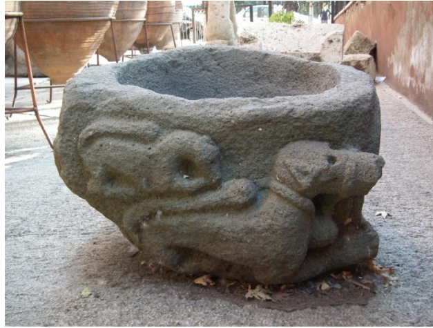
Foto. 5- Çankırı Müzesi'nde Sergilenen Mimari Parçanın Sol Yan Yüzü

Taş parçasının üçüncü yüzünde de, bir ana köpek (tazı) ve yavru (enik), çökmüş vaziyette yüksek kabartma tekniğinde işlenmiştir. Anaç köpek alttadır. Ağız, burun, yuvarlak gözler ve yapışık kulaklarıyla baş kısmı, gövde ile ölçülü biçimdedir. Karın kısmı tazının vücut yapısına uygundur. Boynunda yine tasma asılmıştır. Ön ayaklar, başın altındaki boşluğa doğru uzatılırken, arka ayaklar karın altındaki boşluğu doldurmaktadır. Kuyruk da üstte, bel çukuruna doğru uzatılmıştır. Kuyruğun üzerine doğru çökertilmiş olan enik, tasmatsız ve ana köpek ile aynı biçimde ve mutedil ölçülerle tasvir edilmiştir (Çizim 4, Foto. 5).