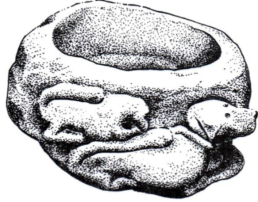
Çizim 4- Çankırı Müzesi'nin Bahçesinde Sergilenen Mimari Parçanın Sol Yan Yüzü (F. Salman)

Taş parçasının üçüncü yüzünde de, bir ana köpek (tazı) ve yavru (enik), çökmüş vaziyette yüksek kabartma tekniğinde işlenmiştir. Anaç köpek alttadır. Ağız, burun, yuvarlak gözler ve yapışık kulaklarıyla baş kısmı, gövde ile ölçülü biçimdedir. Karın kısmı tazının vücut yapısına uygundur. Boynunda yine tasma asılmıştır. Ön ayaklar, başın altındaki boşluğa doğru uzatılırken, arka ayaklar karın altındaki boşluğu doldurmaktadır. Kuyruk da üstte, bel çukuruna doğru uzatılmıştır. Kuyruğun üzerine doğru çökertilmiş olan enik, tasmatsız ve ana köpek ile aynı biçimde ve mutedil ölçülerle tasvir edilmiştir (Çizim 4, Foto. 5).