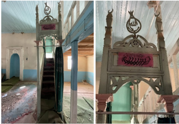
Şekil 8-9: Baharlar Köyü Eski Cami Minberinde Amentü Gemisi (19.03.2022/ 06.08.2022) 1