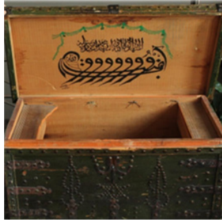
Şekil 20: Çeyiz Sandığı ( H.N. Beğiç-A. Sarıcan)