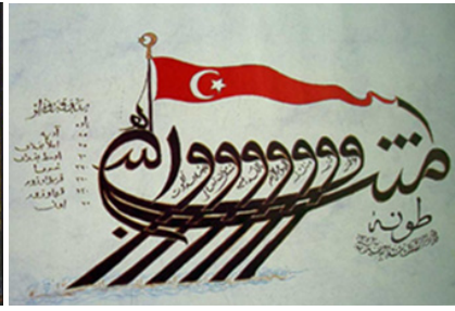
Şekil 14: H.1119/M.1707 Tarihli Amentü Gemisi (Y. Çiçekdal) Şekil 15: R. Anhegger Koleksiyonu Amentü Gemisi-19. yy (A.Ü.Erke ve H.A.Göksoy)