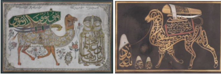
Şekil 5-6: Hz. Ali ve Devesi (İ. C. Schick)

Yazı-resimlerin diğer grubunu tasavvufî örnekler oluşturmaktadır. Mevlevilere ait sikkelerde “Ya Hz. Mevlana Muhammed Celâleddin-i Rumi”, Bektaşî başlıklarında ise “Ya Hz. Pir Hünkâr Hacı Bektaşî-i Veli” sözü yazılmaktadır (Alparslan, 1973, 25). “Hz. Ali’nin Devesi” olarak bilinen resim, halk arasında çok karşılaşılmaktadır. Hz. Ali’nin devesinin tasvir edilmesinde Hz. Ali hem tabutun içinde hem de kendi tabutunun önünde deveyi çekmektedir. Ölümünden sonra Hz. Hasan ve Hz. Hüseyin’e, yüzü örtülü bir devecinin geleceğini ve tabutunun bu deveciye verilmesini istemiştir. Deveci tabutu götüreceği zaman Hz. Ali’nin oğulları deveciden yüzünü açmasını istemiştir. Devecinin yüzünü açması sonrasında o kişinin Hz. Ali olduğunu gördükleri anlatılmaktadır (Schick, 2014, 5). Resim ile anlatılmak istenilen maddî vücut ve manevî vücuttur. Birisi tabutun içinde diğeri deveyi çeken iki ruh söz konusudur. Devenin taşıdığı tabutun üzerinde Mûtû kable en temûtû yazılı olup ölmeyi ifade etmektedir. Vilâyetname ve menakıbnameler de de Hz. Ali’nin hem tabutta hem de devenin önünde yer almasından bahsedilmektedir (Aksel, 2010, 85-87). Bu süsleme köy odalarında, evlerde, hanlarda ve dükkânlarda süs amaçlı duvara asılmaktadır (Alparslan, 1973, 24-25). Camilerde karşılaşılan tasavvufî örnekler arasında mizan terazisi, keşkül, tespih, nefir, sancak, teber, Zülfikâr sayılabilir (Şekil 5-6-7).