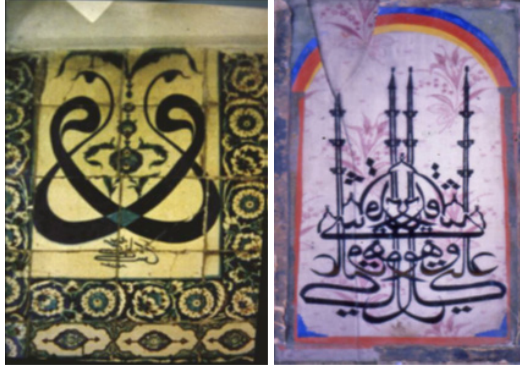
Şekil 1-2: Çifte Yav ve Cami Süslemesi (Ş. Z. Dağlı)

tarafından da kuş şeklinde yapılan yazı-resim tasviri bulunmaktadır (Alparslan, 1973, 9) (Şekil 1-2-3-4).