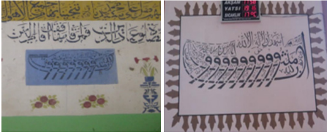
Şekil 10: Bayat Köyü Cami Amentü Gemisi (T. Değirmenci) Şekil 11: Gelendost Abdulgaffar Cami Amentü Gemisi (S. Yarar)

Manisa-Sarıgöl'e yakın olan diğer bir örnek Denizli- Çivril ilçesine bağlı Bayat Köyü Camindedir. 1870 yılında inşa edilen caminin hariminde sıva üzerine mavi ve siyah renklerle kalem işi tekniğinde yapılan gemi tasviri bulunmaktadır. Burada geminin gövdesi kürek çeken yedi vav la tasvir edilmiştir. Vav ların arasına Yedi Uyurların isimlerinden bazılarının yer aldığı fakat tamamlanmadığı görülmektedir (Değirmenci, 2021, 131). Isparta- Gelendost ilçesindeki 1878 tarihli Abdulgaffar Caminde de Amentü gemi süslemesi yine kalem işi tekniğinde ele alınmıştır. Etrafında palmet motiflerinin bulunduğu dikdörtgen çerçevenin merkezinde yer almaktadır. Geminin baş kısmında bayrakta “Allah” yazmaktadır. Yukarıda “ Eşhedüenlailaheillallah ” yazılıdır. Amentü duası ise yatay olarak vav ların arasına yerleştirilmiştir (Yarar, 2021, 1034) (Şekil 10-11).