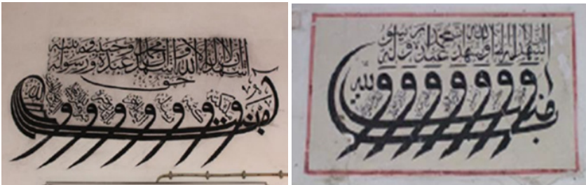
Şekil 12: Yundağı Yenice Mahallesi Cami Amentü Gemisi (H.İ. Eryılmaz) Şekil 13: Bursa- Keles Dedeler Köyü Cami Amentü Gemisi (H.Gülgen)

Amentü gemisinin mimaride uygulandığı diğer örnek ise Manisa'da Yundağı Yenice Camindedir (Eryılmaz, 2018, 578). 1901-1902 tarihli camide, harimin doğu duvarında Amentü gemisi sıva üzerine kalem işi tekniği ile tasvir edilmiştir. Buradaki tasvirde Kelime-i Şehadet, Amentü duası, yedi vav harfi aralarda da “Yedi Uyurların” isimleri yazılmıştır. Dinî mimaride ele alınan başka bir örnek Bursa'nın Keles ilçesine bağlı Dedeler Köyü Camindedir. Caminin kitabesi olmadığı için inşa tarihi bilinmemektedir. Yapıdaki kalem işi tekniği ile yapılan süslemeler 1946 yılına aittir. Harimde yazı süslemeleri yer almaktadır. Bunlardan birisi harimin doğu duvarında bulunan Amentü gemisidir. Kırmızı renkte dikdörtgen bir çerçeve içerisinde celi sülüs yazı ile ele alınmıştır. Vav ların arasında yine Yedi Uyurların isimleri söz konusudur (Gülgen, 2012, 86) (Şekil 12- 13).