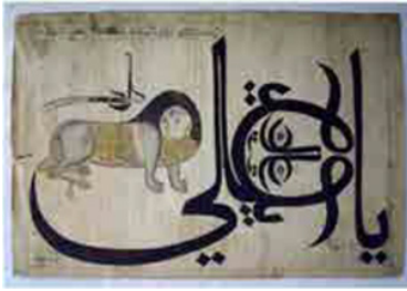
Şekil 7: Zülfikâr Şeklinde Ali Yazısı (M. Demirkan)

Bursa, Manisa, Denizli ve Isparta illerinde bulunan camilerde Amentü gemi süslemesi tespit edilmiştir. Yapılan çalışmalar daha çok mimari açıdan ele alınmıştır. Yazı-resim süslemesi olarak değerlendirilmemiştir. Kalem işi tekniği ile yapılan örneklerin yanı sıra farklı el sanatlarındaki örnekler de değerlendirilmiştir.