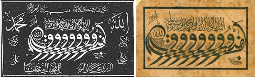
Şekil 18: Amentü Gemisi Hat Örneği (M. Aksel Koleksiyonu) Şekil 19: Amentü Gemisi Taş Baskı (M. Aksel Koleksiyonu) (E.Neumeier ve İ.C.Schick)

gövdesi Amentü duası ve yazı istifinde ise Kelime-i Şehadet siyah dikedörtgen çerçeve ile sınırlandırılmıştır. Sıva üzerine kalem işi, camaltı sanatı, minyatür sanatı ve taş baskı uygulamasının dışında bir de ahşap üzerine yapılan örneği bulunmaktadır (Beğiç-Sarıcan, 2019, 37). Ahşap çeyiz sandığının kapağının iç kısmında köşklü formuyla ele alınmıştır. Burada vavların arası boş bırakılmıştır. Üstte yazı istifinde Kelime-i Şehadet yazılıdır. En üste ise yeşil renkle kıvrımlı-püsküllü perde çizimi bulunmaktadır. Ahşap çeyiz sandığının nerede yapıldığı ve tarihi bilinmemektedir (Şekil 18-19-20).