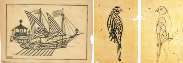
Şekil 3: Ashab-ı Khef Gemisi (E. Neumeier-İ. C. Schick) Şekil 4: Hattat Mustafa Râkım'a Ait Yazı-Resim ve Taslağı (F. Özkafo)