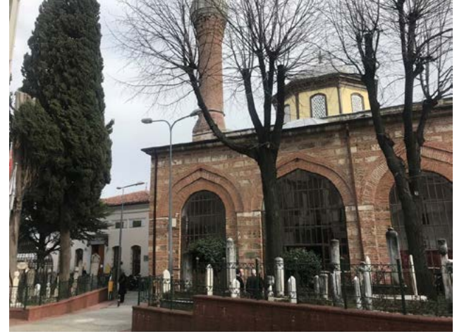
Görsel 1 Üftâde Camii, Üftâde Türbesi ve hazirelerin genel görünümü

Buradan anlaşıldığı üzere 1855 depreminin yıkıcı etkisi sebebiyle 1866'da cami onarılırken âdeta yeniden inşa edilmiş ve 19. yüzyılın dönem üslubu etkilerini