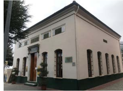
Görsel 23 Üftâde Türbesi