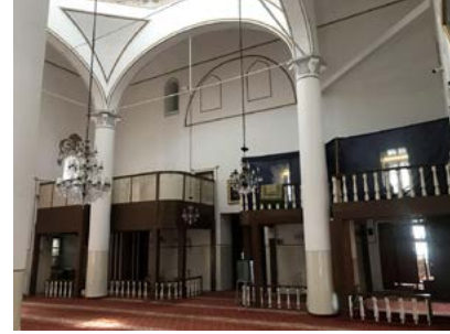
Görsel 22 Üftâde Camii'nin kuzeyindeki ahşap kadınlar mahfili

Üftâde Türbesi'nin giriş kapısı üzerinde, yapının Rıza Paşa tarafından H. 1259-M. 1843 yılında onarıldığını belirten talik ile yazılmış on altı satırlık bir kitâbesi yer almaktadır. Bu cephede yeşil zemin üzerine altın harflerle yazılmış 60x75 cm boyutlarında altı adet kitâbe bulunmaktadır. Kitâbelerde sağdan sola (batıdan doğuya doğru) sıra ile şu kıtalar yazılıdır (Baykal, 1950, s. 177; Beşbaş ve Denizli, 1983, s. 292):