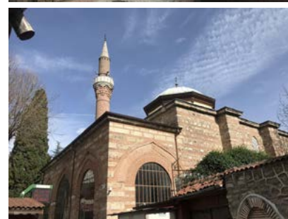
Görsel 5 Üftâde Camii'nin batı cephesi ve payandaları