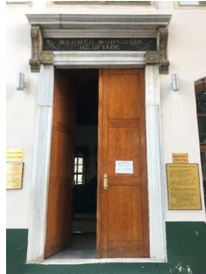
Görsel 24 Üftâde Türbesi'nin giriş kapısı