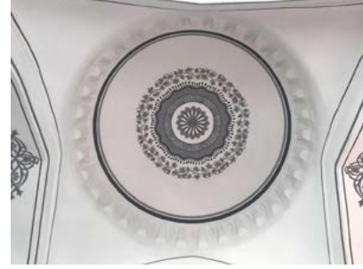
Görsel 11 Üftâde Camii'nin son cemaat yeri orta kubbesinde yer alan kalemîşi bezemeleri

Asıl ibadet mekânındaki tonoz yüzeylerinde ise kahverenginin açık ve koyu tonlarıyla bir merkezde yer alan çiçek motifinden gelişen kıvrımlı çiçek dalları ve dört yöne uzanan bir baklava dilimi motifi yer alır (Görsel 20). Dört yöne doğru gelişen baklava dilimi motifi, beş yapraklı çiçek formlarıyla sonlanmaktadır.