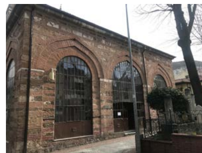
Görsel 4 Üftâde Camii'nin son cemaat yeri