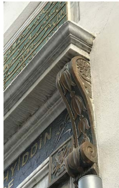
Görsel 25 Üftâde Türbesi'nin giriş kapısının bezemeleri