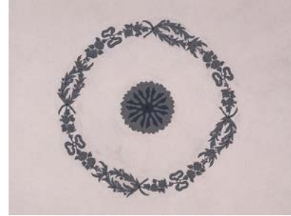
Görsel 13 Üftâde Camii'nin son cemaat yeri yan kubbeleerindeki kalemîşi bezemeler