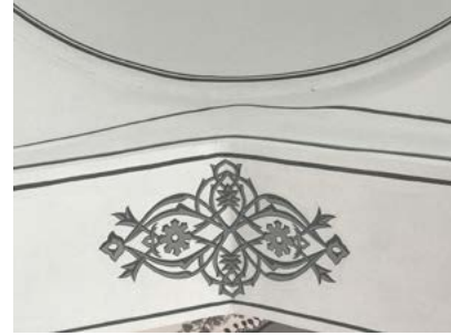
Görsel 12 Üftâde Camii'nin son cemaat yeri kemer içi kalemîşi bezemeleri