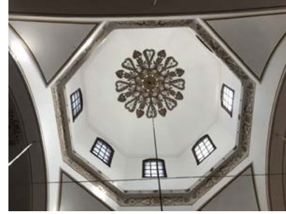
Görsel 15 Üftâde Camii'nin sekizgen kasnaklı kubbesinde kalemîşi bezemeler