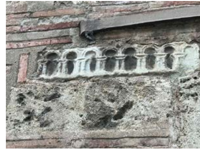
Görsel 3 Üftâde Camii'nin doğu cephesinde devşirme taş malzeme