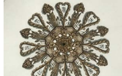
Görsel 16 Üftâde Camii'nin kubbe göbeğindeki kalemîşi bezemeler