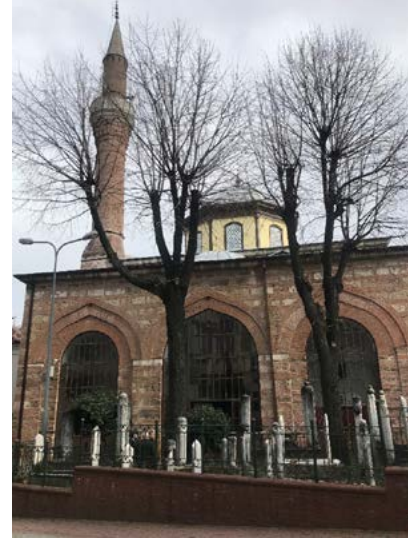
Görsel 2 Üftâde Camii

Tevevül eyleyüb kalben cenabı Pirden ol an İcazet aldığın imarına itmiş idi îmâ