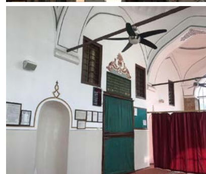
Görsel 6 Üftâde Camii'nin son cemaat yeri