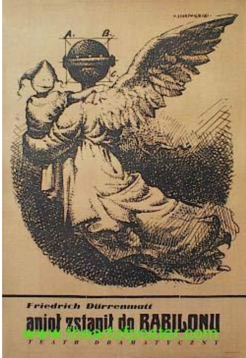
Resim 6. Franciszek Starowieyski, "Kuş Babilon'a Uçuyor", 1961 http://www.theartofposter.com/poster.asp?id=4484

Polonya'da afiş tasarımının başarısının ardında güçlü sanatsal temeller bulunmaktadır. Herbiri kendi çizgisinde olan tasarımcıları ayıran farklılıklar olmakla birlikte bu farklılıkların tasarımlarına yansımaları, tasarım ürünlerinin nitelik yönünden daha zenginleşmesini sağlamıştır. Franciszek Starowieyski de çok güçlü olan bu sanatsal temeli, toplumsal yapının ona kazandırdıklarıyla birleştirip izleyiciyi şaşırtmayı seviyor, sürrealist motiflerden kaçınıyordu.