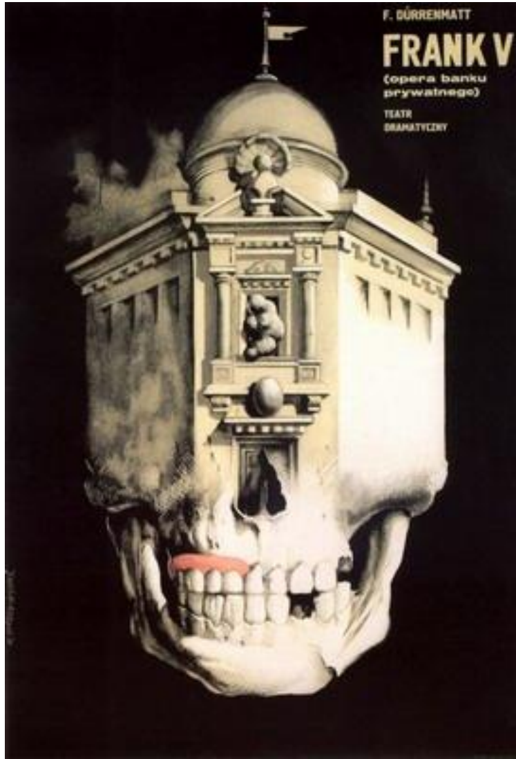
Resim 5. Franciszek Starowieyski, "Frank V", 1962 http://www.poster.pl/poster/starowieyski/frank_70

mekânda asılı duran kafatası imgesinin şaşırtıcı karışımıyla oluşan bir kompozisyonudur. Bu afişte zemin rengi olan siyah, genel olarak değerlendirildiğinde, afişte her zaman birlikte kullanıldığı rengi güçlendirici bir karakter taşımıştır. Karamsar, ürkütücü, bazen de düşündürücü nitelikteki oyunların afişleri için siyah, vazgeçilmez bir renktir. Siyah-beyaz karşıtlığı da afişin yalın ve çarpıcı bir karaktere sahip olmasını sağlar. Bunun yanı sıra siyah, beyaz ve gri değerlerin olduğu bir afişin belirgin bir yerinde farklı bir rengin kullanılması anlamı güçlendirir ve siyahın karamsarlığını hafifletir. Bu afişte siyah rengin ağırlığının ve kafatası ile birleşiminin ürkütücülüğüne karşın kafatasının dişleri arasından görünen pembe dil, afişe mizahi bir karakter de kazandırmıştır. Ama bu mizah kara mizahtır. Kırmızı, Polonya’da, komünist rejim tarafından kullanılması yasaklanan bir renktir. Fakat tasarımcılar, bu rengi oldukça esprili bir anlayışla kullanmışlardır ve kırmızı renk afişin olmazsa olmazı olmuştur. Burada pembe renk belki de bu yasağa alaycı bir gönderme olabilir.