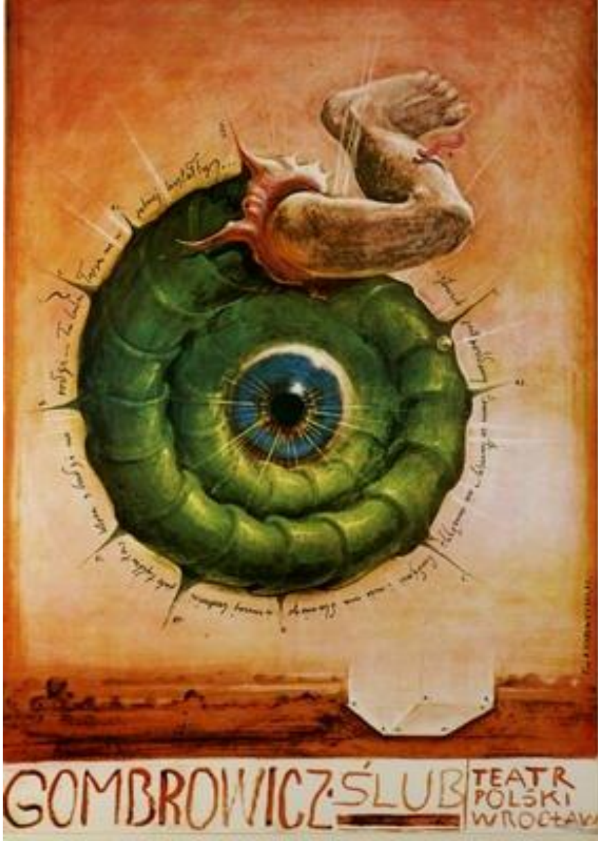
Resim 7. Franciszek Starowieyski, "The Marriage" Yazar Witold Gombrowicz'in bir oyunu için afiş, 1975 http://poster.pl/poster/starowieyski_slub_wzn

"Starowieyski kendini bildi bileli, resim yapmanın düşüncelerini ifade etmede en iyi yol olduğunu belirtir. Ayrıca tiyatrolarla işbirliği içinde tasarladığı afişlerin, üslubunu en iyi yansıtan afişler olduğunu belirtir. Bir tiyatro afişi tasarlarlarken oyunu, tasarım süresince sık sık okuduğunu, provalara katıldığını, bunun dışında her bir afiş için çok sıkı ve çok uzun süre çalıştığını, sayısız eskiz yaptığını söyler." 6