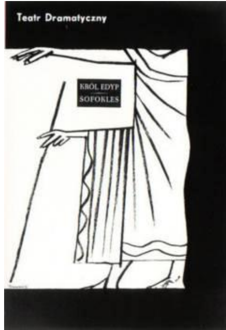
Resim 2. Henryk Tomaszewski, Oedipus Rex by Sophocles, 1961. S:76 http://www.pigamus-gallery.de/Posters/Tomaszewski_e6.htm

kompozisyon alanının sınırına dayanıyor olması; afişin hem içeriğini açıklamakta, hem de tek bir çizgi ile ifadenin ne kadar etkili olabileceğinin işaretini vermektedir.