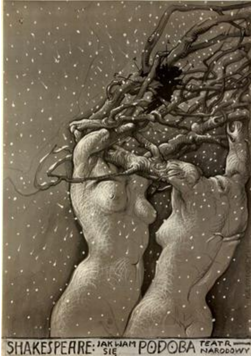
Resim 8. Franciszek Starowieyski, "As you like it" William Shakespeare Oyunu İçin Afiş, 1976 http://poster.pl/poster/starowieyski_jak_wam_80

Starowieyski'nin Shakespeare oyunu için tasarladığı afiş, tasarımcının desen gücünü, grafik tasarımcı kimliğiyle birleştirdiği etkili afişlerinden biridir. Tipografiyi, resimsel unsurların dışında belirlediği bir alana yerleştirerek, resim ve yazıyı birbirinden ayrı ama kompozisyonun bütününe, oyunun içeriğine hizmet eder şekilde kullanarak güçlü bir tasarım oluşturmuştur.