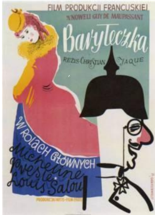
Resim.1 Henryk Tomaszewski, La Petit Füt (French Film) 1947. s:31 http://www.pigasus-gallery.de/Posters/Tomaszewski_e1.htm

alanı dışındadır. Buna karşılık bakışlarının erkek figürüne yönelik olması, aralarındaki ilişkiyi güçlendirmektedir. Renk anlamında da pembe elbisenin erkek figürüne bağlanması, iki figür arasında lekesel bütünlüğü vurgulamaktadır. Ayrıca kadın figürünün giysisinin mavi alanındaki siyah ve beyaz tipografik düzenleme, el yazısının hareketliliğiyle hem giysiye hem de kompozisyondaki diğer tipografik elemanlarla ilişkisine dinamizm kazandırmıştır. Bu özellikler, izleyicinin gözünün, afişin bir noktasına odaklanması yerine – ki bu durum kompozisyon için bir olumsuzluktur - afişin her yerinde aynı yoğunlukta dolaşmasını sağlar. Tomaszewski'nin bu dönem afişleri, hala savaş öncesi etkiler taşımakla birlikte, renk ve çizgi lekeleri ile farklı grafik elemanlardan oluşmuştur.