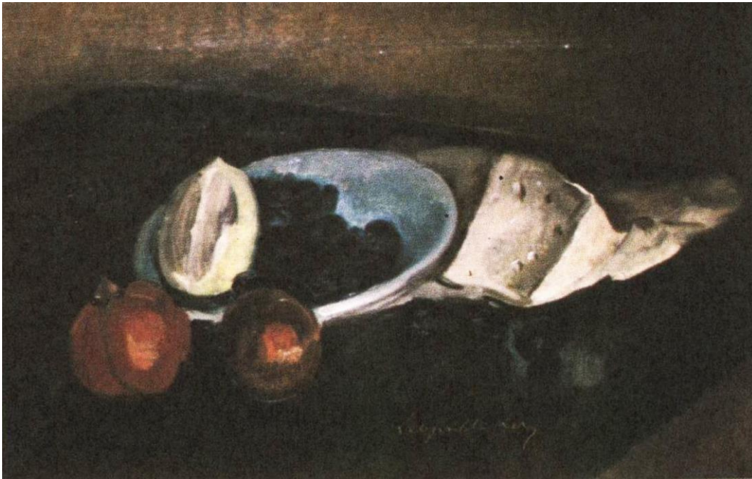
Resim-1: Léopold Lévy, Natürmort, Tuval Üzerine Yağlıboya, 60x45cm., İstanbul Resim ve Heykel Müzesi.

Resim atölyesi şefi olarak yetiştirdiği birçok öğrenci üzerinde olumlu bir takım etkilerinin olduğu birçok eleştirmen tarafından vurgulanan Lévy, zaman zaman olumsuz görülen yönleriyle de eleştirilmiştir. Olumsuz açıdan en çok eleştirilen yönü renkçi bakışa sahip olmamasıdır. Bu konuyla ilgili olarak dönem yazarlarından birisi “ Elbette değerli ve dikkate layık bir sanatkâr olan Mösyö Léopold Lévy'nin, Allah'ın insanlara en büyük ihsanlarından biri olan renkleri pek de sevmeyerek, bütün eserlerini gümüşü bir ahenk içine gömdüğüne ise epey zamandan beri vakıfım (Resim-1). Hatta kendisinin etkisi ve nüfuzu altında, pek çok genç ressamımıza da, böyle sise gömülmüş resimler âdeti geldiğini, iki üç seneden beri farketmişimdir ” 47 demektedir.