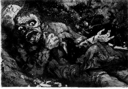
Resim 3. Otto Dix, The Wounded Man (Yaralı Adam) Akuatinta- Gravür, 1924