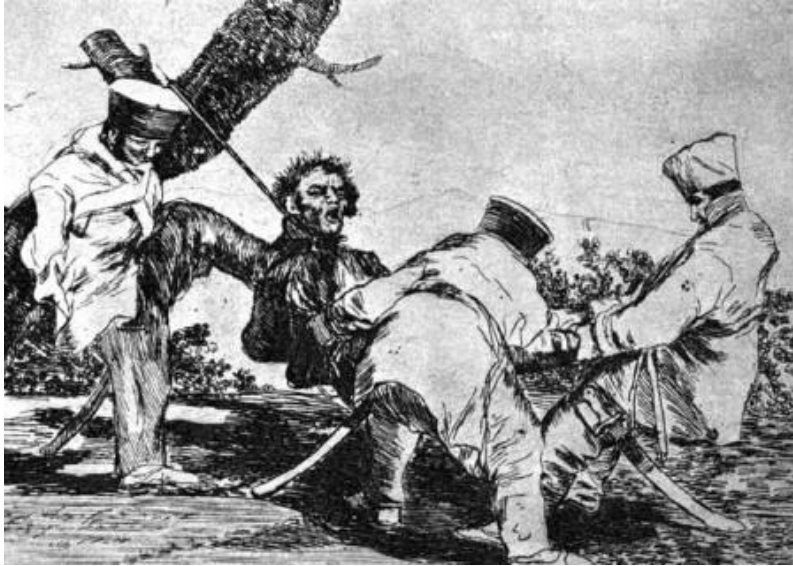
Resim 2. Francisco de Goya, Los Desastres de la Guerra (Savaşın Felaketleri) , Akuatinta-Gravür, (1808-1814)

Eleştirmenlerin Dix’in barışsever bir duruşunun olduğuna inanmalarının bir sebebi, Der Krieg serisini Francisco de Goya’nın 1808 İspanyol Bağımsızlık Savaşı’nda yaşanan vahşeti resmettiği 82 parçadan oluşan Los Desastres de la Guerra (Savaşın Felaketleri) serisi ile karşılaştırmalarıdır. Ancak, her iki baskı serisi arasında önemli bir fark vardır. Goya savaşın bir izleyicisi iken, Dix yaşadıklarını, birebir edindiği deneyimlerini betimlemiştir. Savaşın Felaketleri Goya’nın anlatımı ile zalimlik ve yabancı bir aptallığının göstergesi iken Dix’in Der Krieg ’i madde ve ruhun çürüme ve duygusuzlaşma yönünde bozulduğunu göstermiştir. “Duygusal yoğunluk, vahşi, birden fazla detay ve şeytanın eline tamamen düşmüş insanlara kişisel katılım hissi Dix’in baskılarında Goya’ninkilerden daha belirgindir. Dahası, Goya’nın eserlerinde ahlaksız Fransız askerlerine nazaran İspanyol askerleri daha onurlu ve ezilmiş olarak görülmektedir.” 10