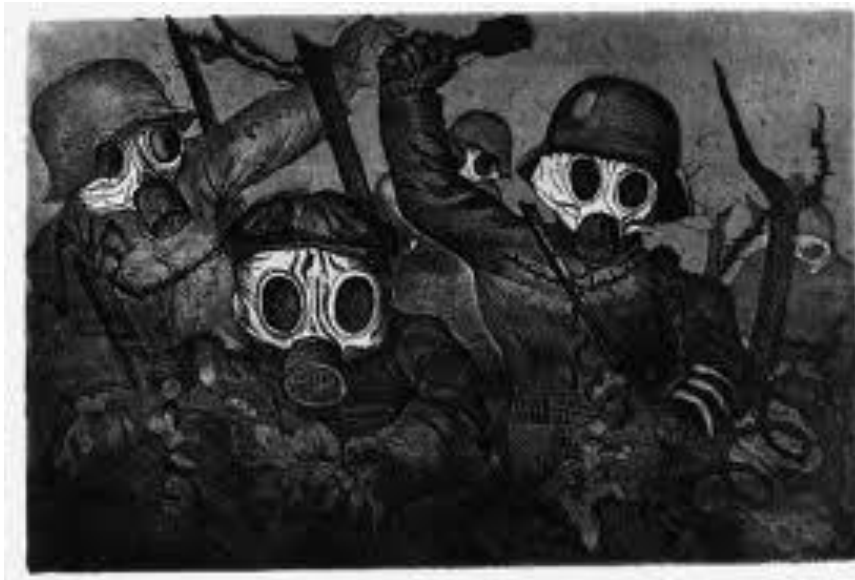
Resim 9. Otto Dix, Stormtroopers During a Gas Attack (Saldırı Kıtası Gaz Altında İlerliyor), Akvatinta-Gravür, 1924

Resim 7’de görülen, Friedrich’in Krieg dem Kriege! serisinde yer alan fotoğrafta yaralı bir askerin portresi görülmektedir. Aslen tarım işçisi olan 36 yaşındaki asker, 1917’de cephede yüzünden yaralanmıştır. 20 operasyonla, vücudunun baş, göğüs ve kolundan alınan parçalarla burun ve sol yanağı yenilenmiştir. Resim 7 ve 8’deki iki eser de savaşın masum insanlarda bıraktığı acı izleri belgeler ve her iki sanatçı da bu yaşananların asla unutulmamasını ister gibidir. Dix’in bu gravür serisi çok büyük yankı yaratmış, basında geniş yer almış ve birçok eleştirmen tarafından anıt değerinde bir seri olarak nitelendirilmiştir. Willi Wolfradt bu seri için: “Bu gravürlerdeki müthiş sahiciliği göz ardı etmek mümkün değil... Hangi okulda olursa olsun bu eseri duvarlarda düşünün! Ne büyük bir anıt!” 13 diyerek serinin sanatsal değerini ve etkisini vurgulamak istemiştir.