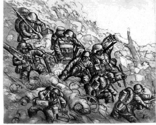
Resim 4. Otto Dix, Machine Gunners Advancing (İlerleyen Makineli Tüfekliler) Akuatinta-Gravür, 1924

Serinin The Wounded Man (Yaralı Adam) adlı çalışmasında, yere düşmüş yaralı bir asker, yaşadığı acı ve şoku izleyiciye aktarmak istercesine, yüzünü ekşitmiş bir halde betimlenmiştir. Tüm gece devam eden sürekli bombardmanın şoku ve içinde bulunduğu yıpratıcı korkunun etkisi ile omzunu kavramıştır. Burada Dix'in, askeri parçalayan çamurlu patlamanın etkisini anlatabilmek için zengin, lekeselel aquatinta efektleri kullandığı görülmektedir. Machine-Gunners Advancing (İlerleyen Makineli Tüfekliler) , ucu bucağı olmayan ceset tepesinden aşağıya ağır teçhizatlarını sürükleyerek inmeye çalışan askerleri betimleyen bir kompozisyonudur. Askerler yüzlerinde çok net görülen tikslenme ve dehşet ifadesi ile ölü bedenlerin üzerinde adım atmakta zorlanmaktadırlar.