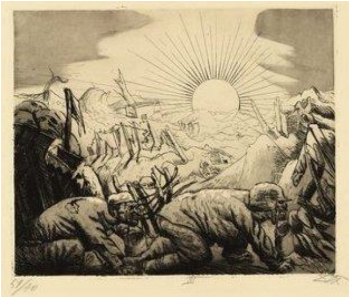
Resim 5. Otto Dix, Essenholer bei Pilkem (Pilkem Yakınında Yemek Taşıyanlar) , Akuatinta Gravür, 1924

Serinin The Wounded Man (Yaralı Adam) adlı çalışmasında, yere düşmüş yaralı bir asker, yaşadığı acı ve şoku izleyiciye aktarmak istercesine, yüzünü ekşitmiş bir halde betimlenmiştir. Tüm gece devam eden sürekli bombardmanın şoku ve içinde bulunduğu yıpratıcı korkunun etkisi ile omzunu kavramıştır. Burada Dix'in, askeri parçalayan çamurlu patlamanın etkisini anlatabilmek için zengin, lekeselel aquatinta efektleri kullandığı görülmektedir. Machine-Gunners Advancing (İlerleyen Makineli Tüfekliler) , ucu bucağı olmayan ceset tepesinden aşağıya ağır teçhizatlarını sürükleyerek inmeye çalışan askerleri betimleyen bir kompozisyonudur. Askerler yüzlerinde çok net görülen tikslenme ve dehşet ifadesi ile ölü bedenlerin üzerinde adım atmakta zorlanmaktadırlar.