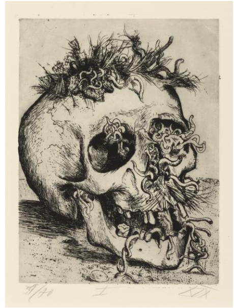
Resim 6. Otto Dix, Skull (Kafatası) Akuatinta-Gravür, 1924