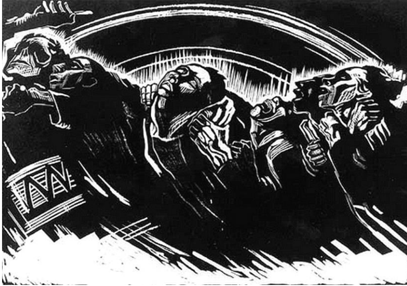
Resim 1. Kathe Kollwitz, Volunteers (Gönüllüler) , Ağaç baskı, 1922

Savaş konulu baskı serisi yapan tek Alman sanatçı Dix değildir. Alman heykeltıraş ve baskı sanatçısı Kathe Kollwitz de bir yıl önce Der Krieg ( Savaş ) başlıklı baskı serisini yapmıştır. Dix'in birebir cephede yaşadıkları, Kollwitz'in de oğlunu savaşta kaybetmesi, iki sanatçının derin acılarını dışavurmasına neden olmuştur. "Onlar eserlerinde savaşın acımasızlığını, insanın kaos içindeki acı ve zaaflarını, sahteciliğini ve tutkularını, ifadecilik kuramlarının sınırlarını zorlayan ve hatta uzaktan da bakabilen bir nesnellik içinde ve cesaretle konu etmektedirler." 5