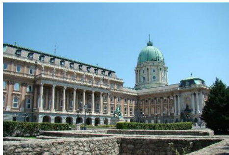
Resim 4: Macaristan Ulusal Galerisi

Takip eden yıllarda müzede önemli iki değişiklik yaşanır. 1934 müze hareketi olarak adlandırılan bu olayda, Macaristan Ulusal Müzesi'nin Antik Mısır Sanatı eserleri ile Etnografya Müzesi, Güzel Sanatlar Müzesi'nin Mısır koleksiyonu şekline getirilir. İkinci önemli olay ise, Müze içerisinde çalışmaların sergilenmesine dair yaşanan yer sıkıntısıdır. Bu problemi çözmeye adına 19. ve 20.yüzyıllarda Macaristan sanat çalışmaları 1957'de Macaristan Ulusal Galerisine taşınır (Vecsey,2001:14). Bu galeride Rönesans, Barok ve Maniyerist dönem çalışmalarını görmek mümkündür.