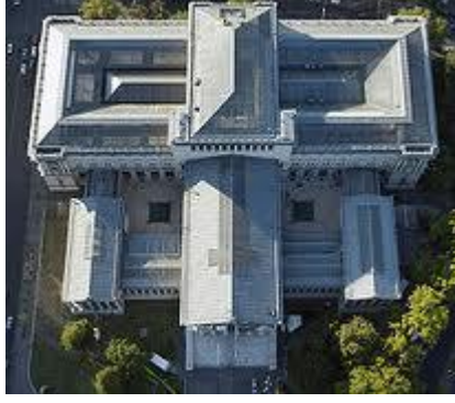
Resim 5: Müzenin kuşbakışı görünümü