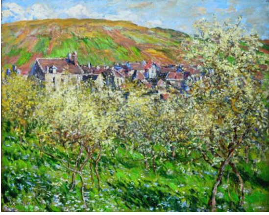
Resim 10 : Claude Monet Blossom'da Erik Ağaçları 1879, T.Ü.Y.B. 1800 sonrası sanat koleksiyonu