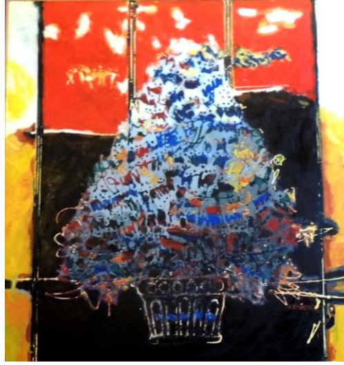
Resim 15: Hasan Pekmezci "Bir Çiçek Gibi", 1982, Tuval Üzerine Yağlıboya, Kalıcı Koleksiyon