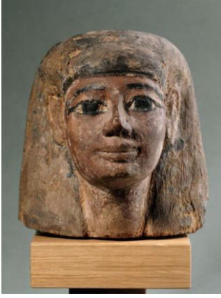
Resim 13: Adam Başı Yaklaşık M.Ö 13. Yy, ağaç üzerine boyama vernik. Mısır Sanatı Koleksiyonu