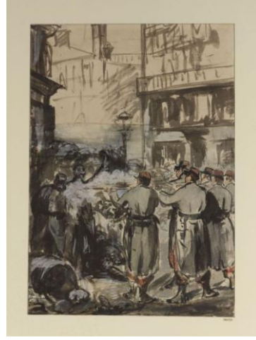
Resim 11: Edouard Manet Barikat 1860, Kağıt Üzerine Karışık Teknik Baskı ve Çizim Koleksiyonu