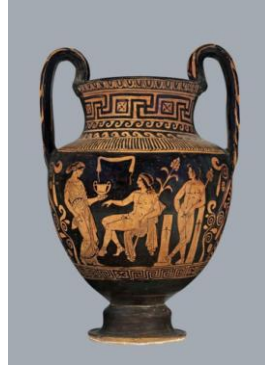
Resim 6: "Vazo" 370-360 BC. Klasik Antikçağ Koleksiyonu

Müzeden içeriye girdiğinizde sağda geçici sergilerin düzenlendiği salonlar, solda ise kalıcı koleksiyonlardan biri olan Klasik Antikçağ Koleksiyonu 'nu görmeniz mümkündür. Tüm bu koleksiyon 5000 parçanın üzerinde esere sahiptir. Yunan, Etrüsk, Roma ve Greko-Mısır sanatından örneklerin yer aldığı bu koleksiyonun 1000 parçası kalıcı olarak sergilenmektedir. Antikçağ periyodunu kapsayan bu bölüm Macaristan'da tek olma özelliğini taşımaktadır.