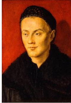
Resim 9: Albert Dürer “Genç bir adamın portresi- İfju Kepmasa” 1471-1528 Ustalar Koleksiyonu

Müzenin birinci katı zemin katındaki sergi salonlarından farklı olarak daha küçük bölümlerden oluşur. Bu bölümde 1800 Sonrası Sanat Koleksiyonu ’nu görebilirsiniz. Delacroix, Carot, Courbet, Manet, Monet, Cezanne ve Gauguin gibi sanatçıların yanı sıra heykeltıraş Rodin ve Maillol’ün çalışmaları da bu katta yer alır. Yaklaşık olarak 10.000 çizim ve 100.000 baskının yer aldığı baskı ve çizim koleksiyonu , kullanılan kağıtların ışığa duyarlılığı nedeniyle sadece geçici sergilerde halka açılmaktadır. Leonardo, Raphael, Dürer, Altdorfer, Wolf Huber, Poussin, Rembrandt, Delacroix, Manet, Van Gogh ve Cezanne gibi sanatçıların baskı ve çizimleri bu geçici sergilerde yer alır.