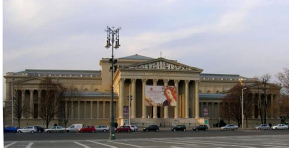
Resim1- Budapeşte Güzel Sanatlar Müzesi

Tuna Nehri üzerinde yedi köprü'nün Buda ve Peşte olarak kurulan şehrin iki yakasını birbirine bağlamasıyla oluşan Budapeşte , Orta Avrupa'nın en güzel başkentlerinden biridir. Peşte'nin odak noktası olan Kahramanlar Meydanı (Hösök Tere) Tuna Nehri'nin güney kısmındaki düz arazileri üzerinde yer alır. Üzerinde Macaristan tarihinin önemli kahramanlarının heykellerinin bulunduğu birbirine bakan iç bükey iki dev kaide ve bu kaidelerin ortasında 36 metre yüksekliğindeki sütunun üzerinde Cebrail Heykeli bulunur. Bu görkemli manzara sağda Budapeşte Güzel Sanatlar Müzesi , solda ise Mücsarnok Sanat Sarayı ile yapıldığı tarihin sanat anlayışını tamamen yansıtan eşsiz bir mimari örneği sunar.