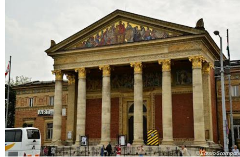
Resim 3: Mücsarnok Sanat Sarayı

Budapeşte Güzel Sanatlar Müzesi , Macar asıllı bir sanatçı olan Karoly Pulszky'nin (1853-1899) bir çalışmasıdır. Babası Ferenc Pulszky, 1848 yılı devrim hareketlerinin çoğu Avrupa ülkelerini etkilediği bir dönemin ardından İngiltere'ye göç etmek zorunda kalır. Oğlu Karoly Londra'da doğmuş ve büyümüştür. Baba Pulszky İngiltere'de bir müzenin, bir ülke için ne denli güçlü bir sembol olduğu gerçeğini öğrenir ve böylece kendi ülkesinde de eşsiz bir müze gerçekleştirme tutkusunu içinde doğar. Amacı, Macaristan'ı modern dünyanın amiral gemisi konumundaki İngiltere ile aynı seviyeye getirmektir (Vecsey,2001:9). Öyle ki, bu müze; içerisinde insanlık tarihinin her döneminde gerçekleştirdiği, tüm sanat dallarından yüksek kalitede örneklerin sahibi konumunda olacaktır. Adeta sanat tarihinin eksiksiz bir ansiklopedisini oluşturmaktır amaç. Pulszky'nin bu tutkusu Macaristan tarihinde emsali olmayacak bir olaydır ve bu olay ona politik anlamda sempati kazandırmasının yanı sıra,