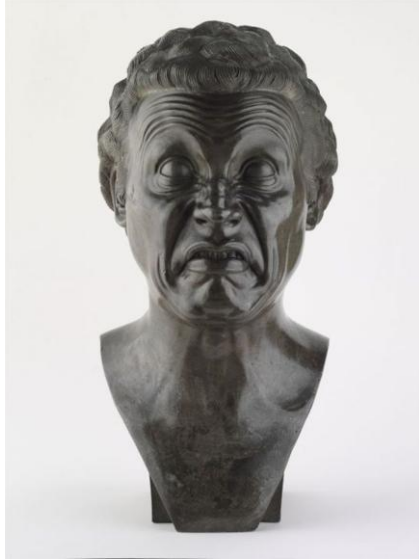
Resim 12: Franz Xaver Messerschmidt "Karakter Başı: Çocukça Ağlayan" 1771-83, Kalay, Kurşun Alaşımı Eski heykel koleksiyonu

Müzenin ikinci katında ise Eski Heykel Koleksiyonu bulunur. Uzun bir süre yer sıkıntısı nedeniyle açılmayan sergi 2013 yılının ilk aylarında kalıcı sergi salonlarında halka sunulmuştur. Rönesans ve Barok dönemi küçük bronz heykellerin yanı sıra ağaç heykellere de rastlamak mümkün. Bu katta Riemenschneider, Donner ve Messerschmidt gibi bölgesinde heykel periyodunun en parlak sanatçılarının çalışmalarını görmek mümkündür.