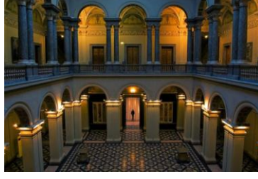
Resim 7 : Mermer Salon