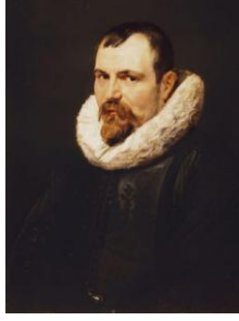
Resim 8: Anthony Van Dyck “Bir Adamın Portresi-Ferfikepmas” 1617-1620 Ustalar Koleksiyonu