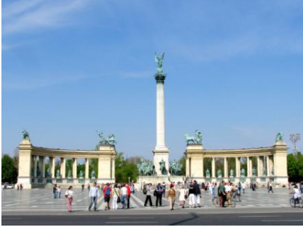
Resim 2: Kahramanlar Meydanı