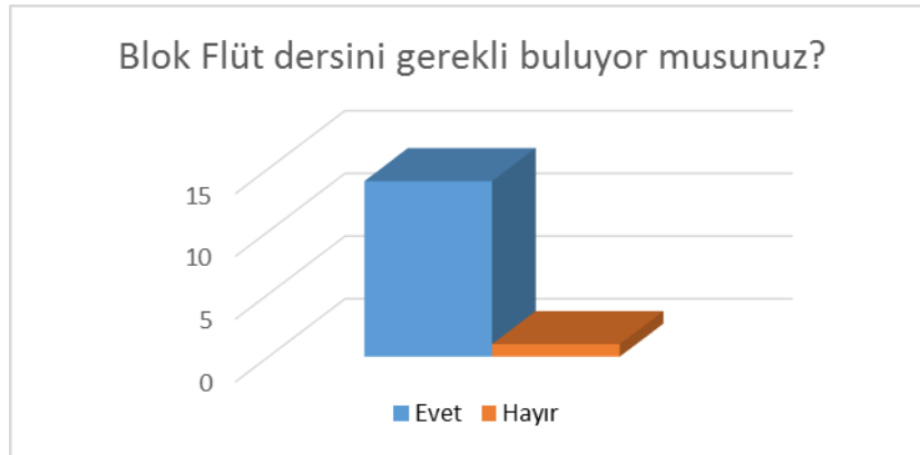
Şekil 1. Öğrencilerin Okul Çalgıları – Blok Flüt dersini gerekli bulma durumları

Öğrenciler ile yapılan görüşmelerde blok flüt dersine yönelik görüşlerini belirlemek için sorular sorulmuştur. “Müzik öğretmeni adayı olarak Okul Çalgıları – Blok Flüt dersini gerekli buluyor musunuz?” sorusuna 14 öğrenci evet, bir öğrenci hayır cevabını vermiştir (Şekil 1).