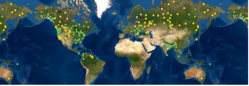
Resim 2. “Suya Dalan Biri /Dalgıç” motifinin dünyaya yayılmasının haritası. Yeşil renk ile genel olarak “Suya dalan biri” (C6), kırmızı renkle “Suya dalan kuş” (C6C) motifleri gösterilmektedir. Sarı renk ise bu iki motifin çakışmasına işaret etmektedir.

Yu. Ye. Beryozkin’in geliştirdiği metot “arkeolojik yaklaşım” olarak adlandırılabilir. Söz konusu yaklaşımın ana amacı, folklorun sistemleştirilmesi, analiz edilmesi ve haritaya geçirilmesi vasıtasıyla kültür ilişkilerini araştırmaktır. Belli başlı epizotların mevcut olması-olmaması, halklar arasındaki bağlantılar açısından önemli bir rol üstlenmektedir. Arkeolojik yaklaşıma dayanarak yapılmış karşılaştırma vasıtasıyla “Suya Dalan / Dalgıç” olarak adlandırılan motifi içeren mitlerin neredeyse dünyanın yarısında yaygın olduğu tespit edilmiştir (Resim 1).