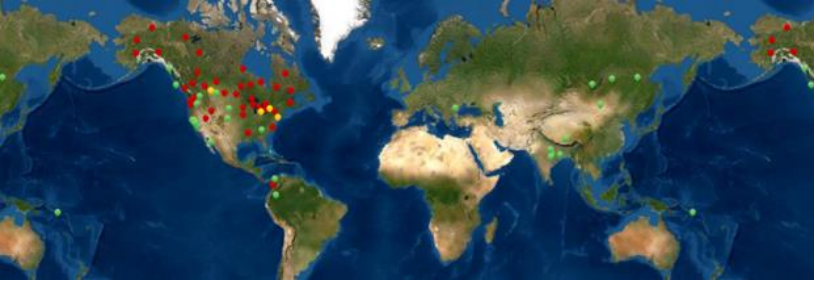
Resim 1. Yeşil renkle suya dalan olarak kurbağa veya kaplumbağa motifi (C6A), kırmızı renkle suya dalan misk sıçanı veya kunduz (C6B) motifi gösterilmektedir.