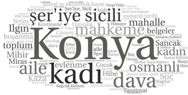
Şekil 1. Anahtar Kelimelerine Dair Kelime Bulutu

Şekil 1'de Konya şer'îye sicilleri ışığında yazılan lisansüstü tezlerinin mevcutta ulaşılan anahtar kelimelerine dair kelime bulutu gösterilmiştir. Bu bağlamda en çok kullanılan kelimelerin "Konya", "şer'îye sicili", "kadı", "mahkeme", "Osmanlı" ve "dava" olduğu görülmektedir.