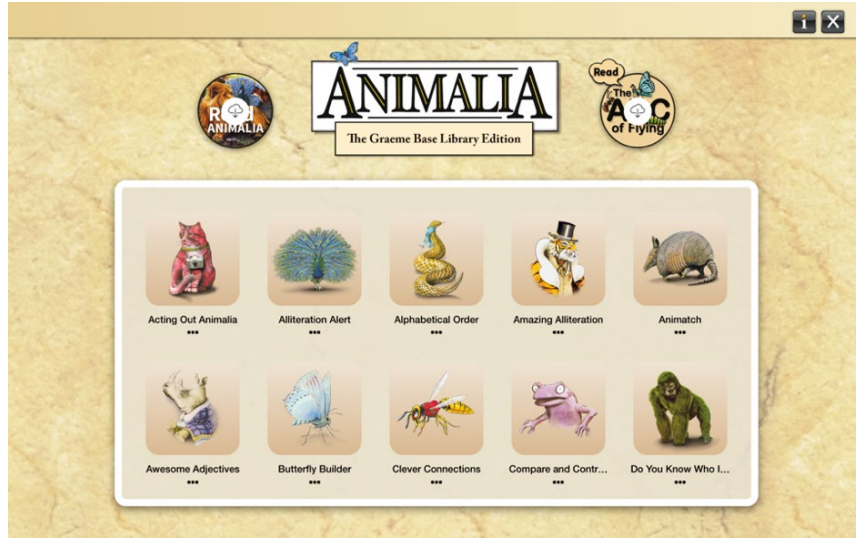
Görsel 11: The Graeme Base Library Edition, “ Animalia ”