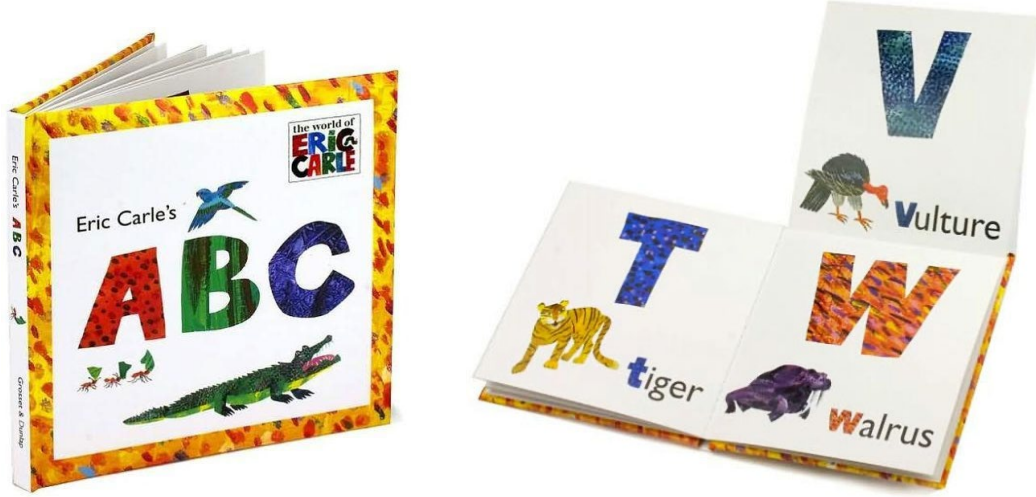
Görsel 1-2: Eric Carle, “Eric Carle’s ABC”

Kaynak: https://tinyurl.com/bdh58kay (Erişim Tarihi: 09.03.2020)