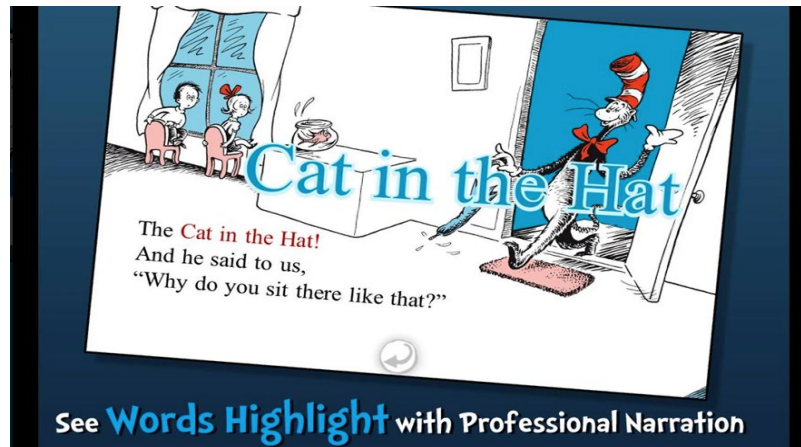
Görsel 10: Dr. Seuss, “ The Cat In The Hat ”

Dr. Seuss’un “ The Cat in the Hat ” ( Şapkalı Kedi ) adlı kitabının Oceanhouse Media tarafından uyarlanan interaktif kitap uygulaması da bulunmaktadır. Basılı kitapla aynı öykü kurgusuna sahip uygulamada, ses özelliği ve metin yapısının farklı renklerle vurgulanması ile, etkileşimli bir materyal kazanımı sağlanmıştır. Basılı kitabın dijital ortama uyarlanmasıyla, teknolojik ekranlar üzerinden ve ebeveyn gözetiminde istenilen erken okuryazarlık becerilerine katkı sağlayabilecek materyaller sınıflamasına girer. Eğitim kategorisindeki bu uygulamanın dili İngilizce olup, iPhone, iPad ve iPod touch ile uyumludur.