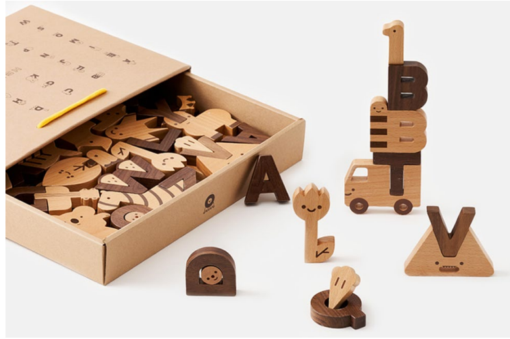
Görsel 5. Oioiooi, “Alphabet Play Block Set”