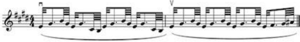
Görsel 16 B