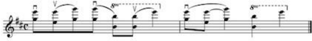
Görsel 6: 3 no'lu etüt, 10. ve 43. ölçüde gelen oktavlar için çalışma önerisi