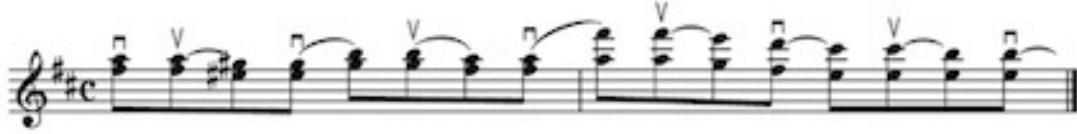
Görsel 2 B: 3 no'lu etüdün 1. ölçüsü için çalışma önerisi 2