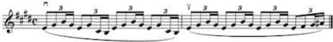
Görsel 16 D