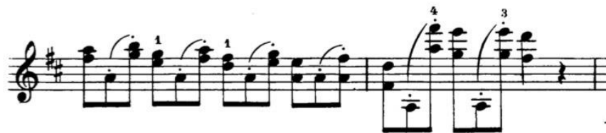
Görsel 9: 3 no'lu etüt, 13. ölçü

Yukarıda, metodun 9. ölçüsünde sesler çift olarak gelmekte, 10. ölçüde tek sese düşünce nüans aynı kalmalı, büyük volüm ile çalmaya devam etmelidir.