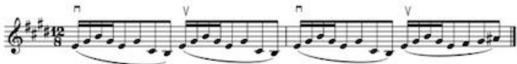
Görsel 16 F