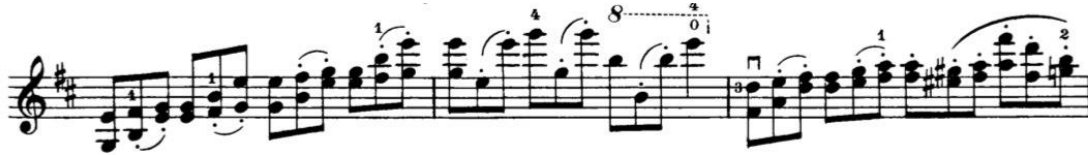
Görsel 8: 3. Etüt, 9. ve 10. ölçüler

Nüanslara bağlı olarak bu dip kısım doğal olarak yer değiştirecektir, bu normaldir. İki sayfa devam eden etütte üçleme ritmi aksamadan korunmalıdır.