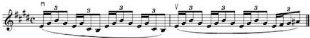
Görsel 16 E