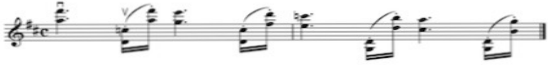
Görsel 4 A: 3 no'lu etüt, 6. ölçü için çalışma önerileri 1