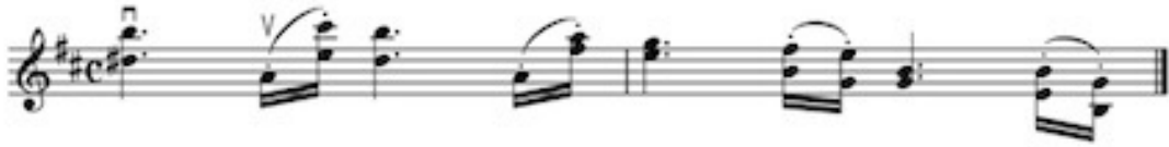
Görsel 5 A: 3 no'lu etüt, 39. ölçü için çalışma önerisi 1

Aşağıda 3. Etüt 39.ölçü için çalışma önerileri bulunmaktadır. (Görsel 6 A ve 6 B )