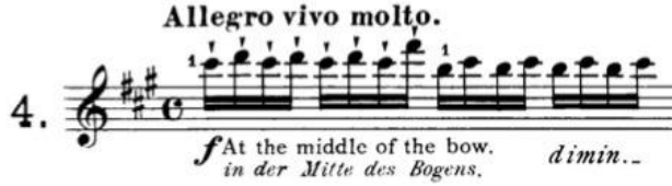
Görsel 12: 4. etüt, 1.ölçü

1. ölçüde, 2. vuruştan 3. vuruşa geçerken gelen pozisyona geçilirken yay hızı ve yay büyüklüğü değişmemelidir.