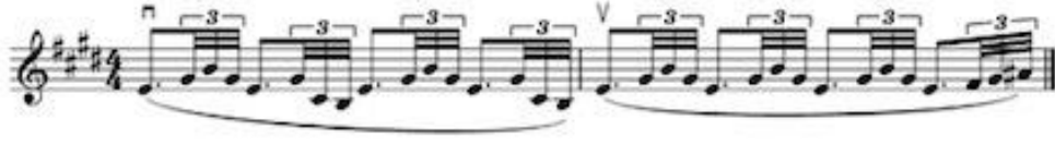
Görsel 16 A