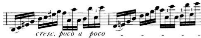
Görsel 14: 4 no'lu etüt 9. Ölçü

3. ölçünün 2. vuruşuna girmeden önce yeni bir cümle başladığı için 1. vuruştan itibaren bir bitirme yaparak yay staccato hareketini yapmak üzere yayın ortasına gelmelidir.