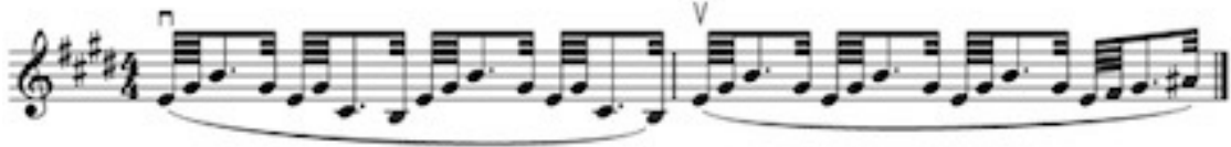
Görsel 16 C