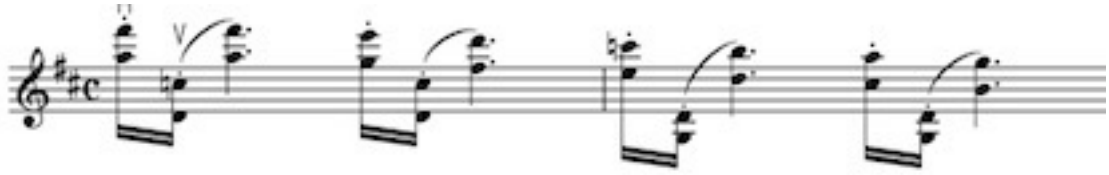
Görsel 4 B: 3 no'lu etüt, 6. ölçü için çalışma önerileri 2

Aşağıda 3. Etüt 39.ölçü için çalışma önerileri bulunmaktadır. (Görsel 6 A ve 6 B )