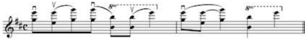
Görsel 2 C: 3 no'lu etüdün 1. ölçüsü için çalışma önerisi 3