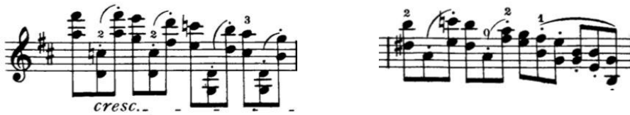
Görsel 3: 3 no'lu etüdün 6. ve 39. ölçüleri