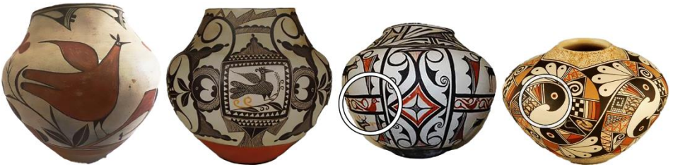
Görsel 27: Kuş sembolü, Kuzey Amerika Kızılderili seramik örnekleri 1 (Eroğlu, 2015a).

Kızılderili seramiklerinde farklı kuş sembollerine rastlanmaktadır. Doğa elamanlarından yararlanma ve doğadaki birçok malzemeyi kullanmada ustalaşan Navajo’lar toprağa şekil vererek gerek günlük kullanım eşyası gerekse dekoratif süs unsuru olan seramik objeler yapmışlardır. Bu objelerini de farklı kuş sembolleri ile süslemişlerdir. Böylelikle kutsal saydıkları kuşları seramiklere uygulayarak hayatlarının bir parçası haline getirmişlerdir.