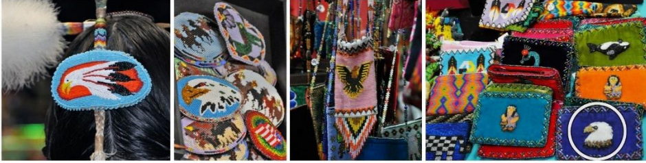
Görsele 35: Kuş sembolü, Kuzey Amerika Kızılderili aksesuar örnekleri (Eroğlu, 2015b).