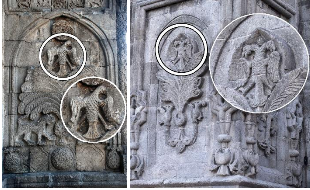
Görsel 15: Kartal figürü, Erzurum Yakutiye Medresesi (URL-10).