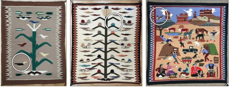
Görsel 24: Kuzey Amerika Kızılderililerine ait kuş sembolü dokuma örnekleri 2, Navajo Rezervasyon Alanı (Eroğlu, 2015a).