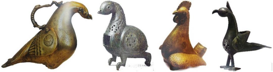
Görsel 20: Kuş formunda buhurdanlık örnekleri, Selçuklu Dönemi (Eravşar vd., 2013).

Geniş bir ürün çeşitliliği olan Türk maden sanatında da kuş motiflerine ve figürlerine rastlanılmaktadır. Saray için üretilen günlük kullanım eşyalarından olan buhurdanlıklar ve sürahilerin kuş biçiminde olduğu görülmektedir. Ayrıca aynalar, takılar ve kemer tokaları gibi aksesuarlara, kuş motifinin farklı şekillerde işlendiği görülmektedir. Maden işçiliğinde kullanılan tekniklerden olan döküm, oyma, dövme, kazıma gibi teknikler ile yapılmış objeler de kuş figürlü objelere örnek olarak gösterilebilir.