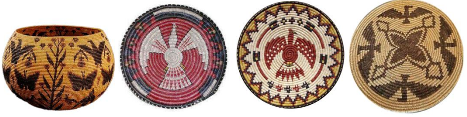
Görsel 22: Kuş sembollü, Kuzey Amerika Kızılderili sepet örnekleri 2 (Eroğlu, 2015a)