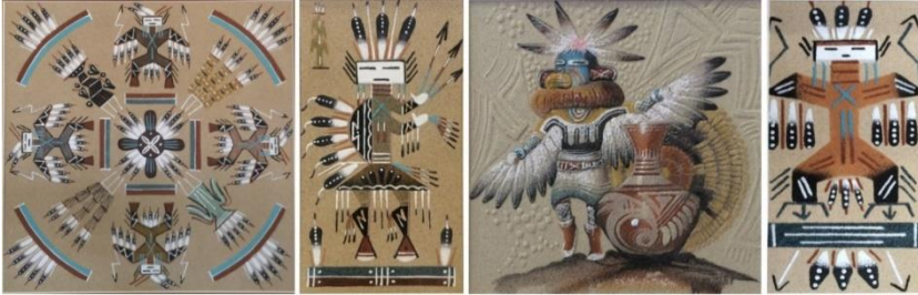
Görsel 31: Kuş Sembollü, Kuzey Amerika Kızılderili Kum Boyama Tablo Örnekleri (Eroğlu, 2015a).