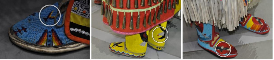
Görsel 26: Kuzey Amerika Kızılderili ayakkabılarında kuş sembolü örnekleri, powwow, Albuquerque (Eroğlu, 2015b)