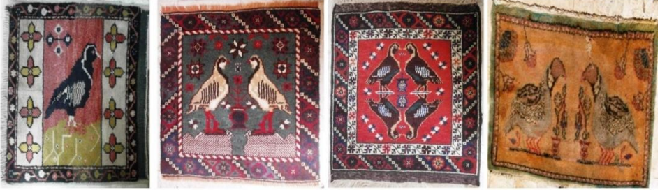
Görsel 7: Kuş figürlü halı örnekleri, Döşemealtı (Kartal ve Alp, 2021: 281).

Döşemealtı halılarında kullanılan keklik sembolü bazı dokumalarda birebir uygulanmaktadır. “Özellikle Döşemealtı halılarında, sıklıkla kullanılan soyut anlatım yerine figürsel olarak ifade edilen kuş figürleri (keklik, güvercin) bulunmaktadır” (Akpınarlı ve Arslan, 2018: 284).