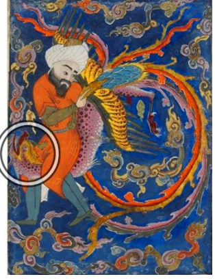
Görsel 17: Simurg'un Zal'ı yuvasına götürmesi, Şehnâme, 1587-97, DCBL, Per 277.12.