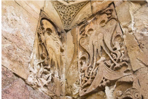
Görsel 14: Divriği Ulu Camii Batı-Tekstil kapısının yan duvarından detay, solda doğan figürü, sağda çift başlı kartal figürü (URL-3).