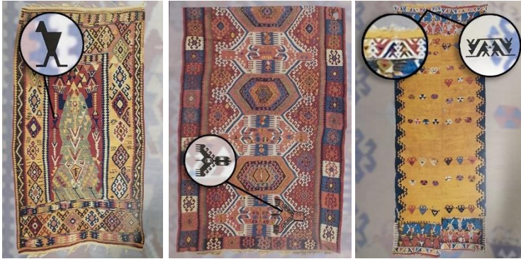
Görsel 4 – Gümüşhane Bayburt yöresine ait kilim ve kuş motifi detayı, 19. yy., özel koleksiyon (Erbek, 1995: 138).