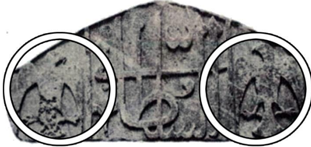
Görsel 13: Konya Kalesi duvarlarında “es-Sultan” yazıtı ve iki yanında birer yırtıcı kuş (Alsan ve Sezaver, 2020: 158).

“Tek ve çift olarak kullanılan kuş veya kartal kabartmaları oldukça yaygındır. Önemli örnekleri şöylece sıralayabiliriz: Konya Kalesi’nden İnce Minareli Medrese Müzesi’ne getirilen bir taş Üzerinde iki kartal (1220 civarı), Denizli Akhan’ın portalinde iki kuş (1253), Diyarbakır’dan İstanbul Türk ve İslam Eserleri Müzesi’ne getirilen bir taş Üzerinde sırt sırta iki kartal (12. yüzyıl), Kayseri Karatay Han’ın avlu portalinde iki kuş (1240), Tercan Mama Hatun Türbesi portaline gizlenmiş tek kuş (13. yüzyıl), Niğde Sungur Bey Camii doğu portalinde gizlenmiş tek kuş (1335)” (Öney, 1992: 42).