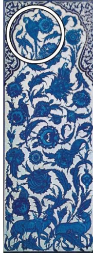
Görsel 8: Topkapı Sarayı sünnet odası cephesi (Sönmez, 2021: 214; Esemeli, 2000).