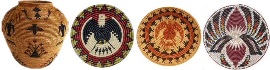
Görsel 21: Kuş Sembollü, Kuzey Amerika Kızılderili Sepet Örnekleri 1 (Eroğlu, 2015a).

Kızılderili kültüründe önemli olan sepet örücülüğü, sadece kullanım objesi olmaktan ziyade, sepetlere işlenen motiflerle birlikte birer mesaj verme araçları olarak karşımıza çıkmaktadır. Bitkisel, geometrik ve figürsel süslemelerin yapıldığı sepetlerde kuş motiflerinin de kullanımı yaygındır.