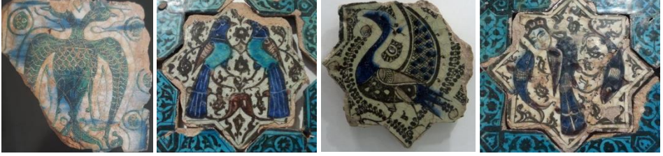
Görsel 9: Çift Başlı Kartal, Kubad Abad, Büyük Saray, yıldız çiniden kesilmiş kare levha, Konya Karatay Müzesi (Arık, 2000: 121).