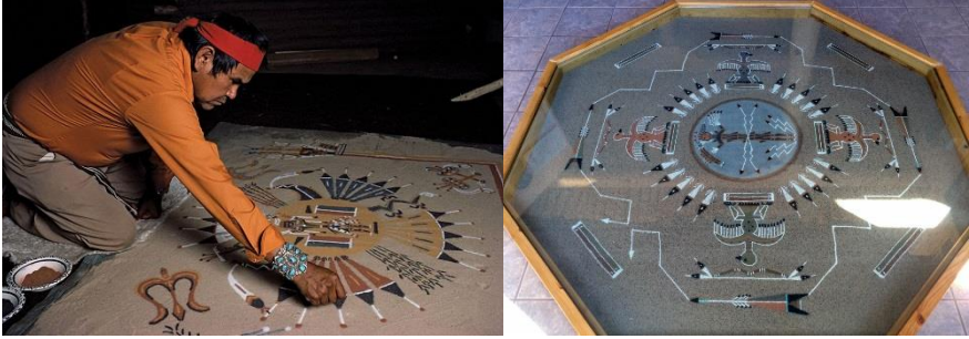
Görsel 29: Kuzey Amerika Kızılderili kum boyama sanatı yapım aşaması (URL-5)

Kum boyama sanatında kullanılan önemli bir faktör olan sembolleri, bilge ve büyücü kişilerin çizdikleri bilinmektedir. Kum boyama sanatı; Kızılderili kültüründe sadece bir süsleme unsuru olmayıp, tedavi edici ve kötülüklerden koruduğuna inanılan dinsel bir ritüeldir.