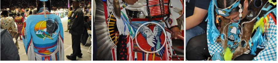
Görsel 25: Kuzey Amerika Kızılderili kıyafetlerinde kuş sembolü örnekleri, powwow, Albuquerque (Eroğlu, 2015b).