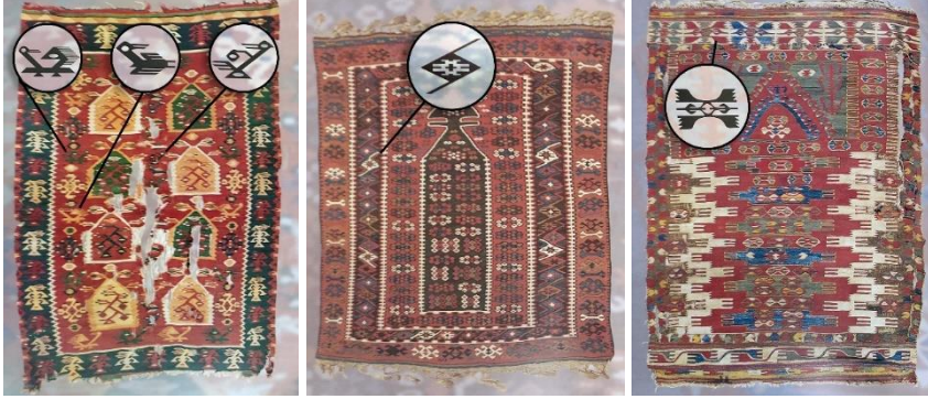
Görsel 1: Tekirdağ Şarköy yöresine ait kilim ve kuş motifi detayı, 19. yy, Vakıflar Halı Müzesi, İstanbul (Erbek, 1995: 98).

Anadolu'nun birçok yerleşim yerinde kuş motiflerinin uygulandığı dokumalara rastlanmaktadır. Özellikle Uşak yöresinde madalyonlu ve kuşlu halılar literatürdeki önemli kuş motifli halı örneklerindedir. Kocaeli/Hereke, Erzurum, Çorum, Balıkesir, Malatya, Konya, İzmir/Bergama, Aksaray, Tekirdağ/Şarköy, Afyonkarahisar, İçel, Van ve Uşak yörelerinde çeşitli formlarda kullanılmış kuş motifli dokuma örnekleri görülmektedir (Erbek, 2002: 90-92).