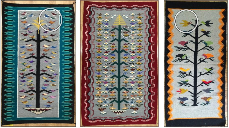
Görsel 23: Kuzey Amerika Kızılderililerine ait kuş sembolü dokuma örnekleri 1, Navajo Rezervasyon Alanı (Eroğlu, 2015a).