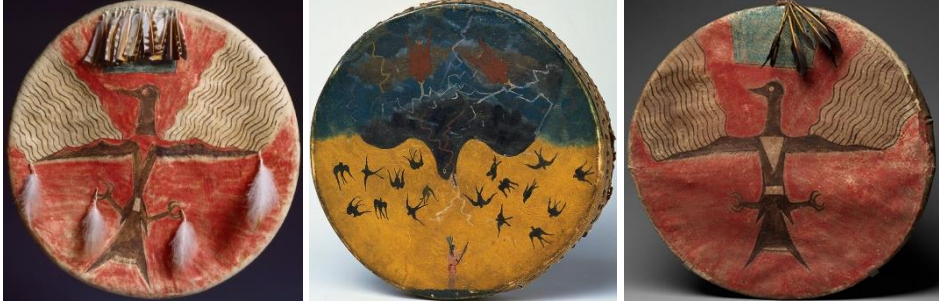
Görsele 32: Kuş sembolü, Kuzey Amerika Kızılderili davul örneği (URL-4).

kafataslarının üzerinde ve kachina bebeklerinde de kuş sembollerinin kullanımına rastlanmaktadır. 1700 ila 1800 yılları arasında deri üzerinde, çadırlarında, boncuk işi kıyafetlerinde de kuş sembolünün kullanıldığı görülmektedir.