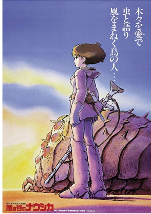
Görsel 1: “Rüzgarlı Vadi” (2007) film afişi.