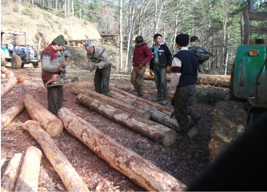
Şekil 3. Pınarbaşı Orman Köylülerinin Geçim Kaynağı: Orman Üretim İşleri