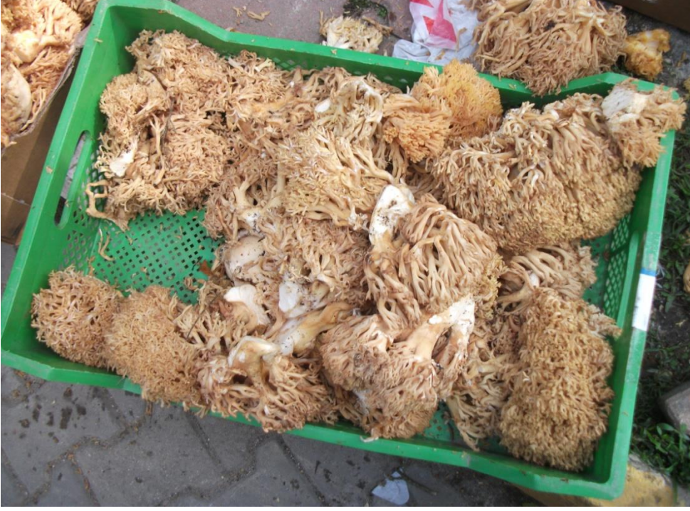
Şekil 2. Orman Köylülerinin Önemli Geçim Kaynakları: Mantar Toplayıcılığı

zamanlarda yaz aylarında eski geleneksel yayla alanlarından ve orman içi açıklıklarından, turizm ve rekreatif amaçlı yararlanmaktadır.