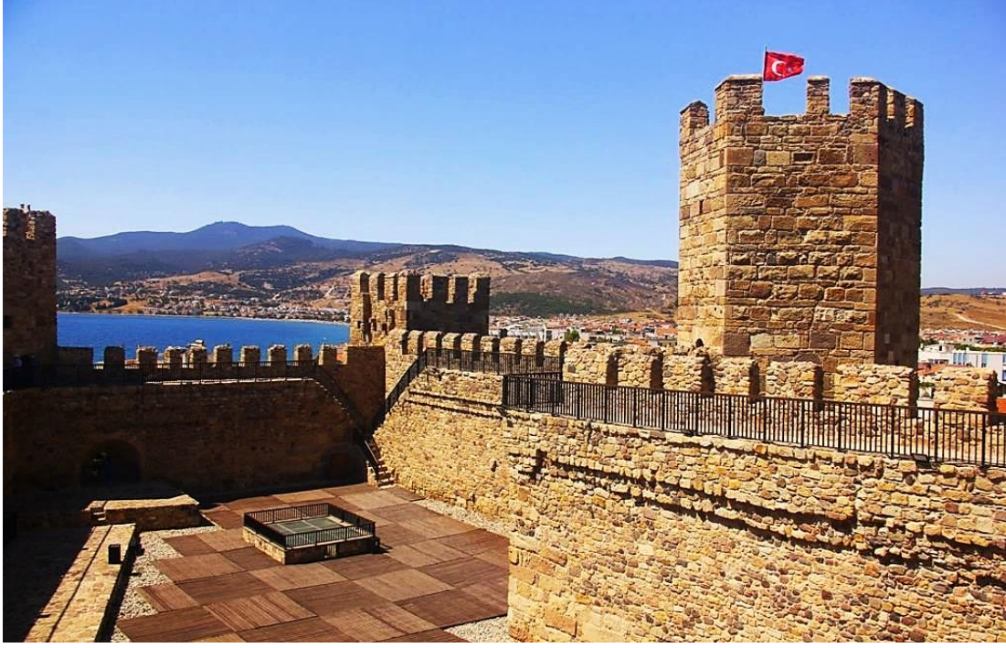
Resim 1: Çandarlı Kalesi 2

Çandarlı'nın Türkler tarafından fethi hemen olmamıştır. Zaman zaman Türklerin hâkimiyetine geçtiği, daha sonra yine kaybedildiği görülmektedir. Kesin olarak hâkimiyet altına alınması 1302 yılından sonradır. Nitekim bu yıllarda Bergama ve çevresinden Bizanslıların çekilmeye başlamasıyla birlikte Türkler bölgeye yerleşmeye başlamıştır. Özellikle Anadolu Selçuklu Devleti'nin son döneminde ortaya çıkan beylikler (Saruhanogulları, Karesiogulları), bölgenin Türk beldesi haline gelmesi sürecinin başlangıcını teşkil etmiştir (Çandarlı 2004: 8-9). Zira Çandarlı, Karesi Beyliği döneminde önemli bir limandır. Karesi Bey, Balıkesir kasabasını kendisine merkez yaparak Çanakale sahilleri ile Çandarlı limanında bir donanma vücuda getirmiştir ( Yarım Ay Dergisi , 1 Mayıs 1940: 17).