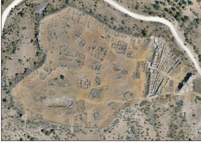
Karacahisar Kalesi Hava Fotoğrafi

XI. yüzyılın ikinci yarısından itibaren Selçuklu ile Bizans arasındaki hâkimiyet mücadelelerinin yoğun yaşandığı sınır hattında yer alan Karacahisar Kalesi'nin bu süreçte üstlendiği rolü ve kaledeki hâkim güçleri aktaran herhangi bir kaynak yoktur. Kalenin Dorylaion ve Miryokefalon savaşlarında etkin bir rol oynaması muhtemel olmakla birlikte, 1175 yılında gerçekleşen Miryokefalon savaşı sonrasında yıkılması kararlaştırılan kalelerden biri olan Dorylaion kalesi 20 ile kastedilenin Karacahisar olması muhtemeldir.