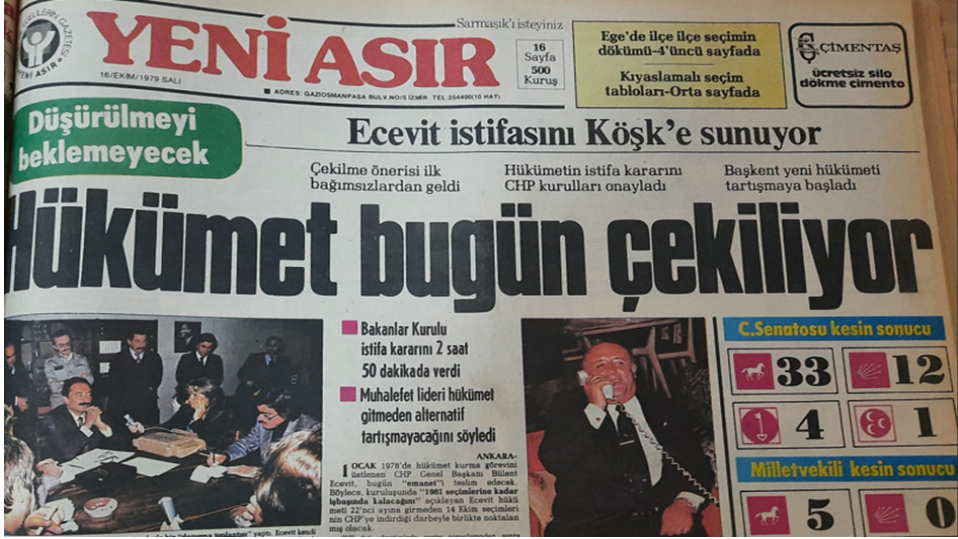
Seçim sonrası Bülent Ecevit'in istifası ( Yeni Asır , 16 Ekim 1979, s.1.)

15 Ekim günü tüm gözlerin çevrildiği Ecevit, sessiz kalmayı tercih etmiştir. Ancak siyasi partilerin Manisa'daki yöneticilerinin dahi üzerinde sıklıkla durduğu hükümet değişimi konusu, seçimden iki gün sonra gündeme gelmiştir. 16 Ekim'de Bülent Ecevit istifasını Cumhurbaşkanı Fahri Korutürk'e sunarak çekilmiştir. 74 Hükümet kurma görevini tekrar üstlenmeyeceğini Korutürk'e belirten Ecevit, milletin AP'nin hükümet kurmasını uygun gördüğünü söylemiştir. 75 Demirel'e göre de bu bir istifa değildir, millet Ecevit'i indirmiştir. 76