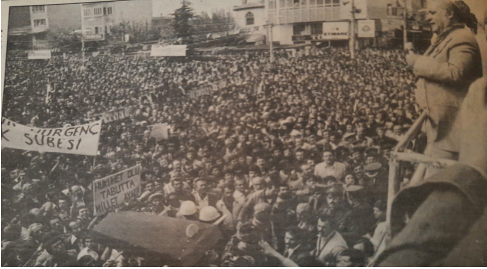
Süleyman Demirel'in 8 Ekim 1979 tarihli Manisa Mitingi ( Ekspres , 9 Ekim 1979, s. 2.)

Konuşmasında sıklıkla CHP'yi eleştiren Demirel, devletin arabasının tekerindeki taşın CHP hükümeti olduğunu söylemiştir. Ülkenin büyük bir çıkmazda bulunduğunu, bu sürecin bitmesinin tek yolunun da AP hükümetinin iş başı yapması olduğunu eklemiştir. Ayrıca hiçbir seçim döneminde tank ve zırhlı araçların himayesinde siyasi miting yapılmadığını, bu ortamı yaratanların ömür boyu vebalden kurtulamayacaklarını ifade etmiştir. Konuşmasının sonunda bozuk ekonomiye ve siyasi cinayetlere değinerek "... yirmi bir ayın korkunç bilançosu 2.240 kurban, 9.500 yaralı, 750 soygunu içine alan korkunç bir tablodur" açıklamasında bulunmuştur. 52 Manisa'daki ilgiden oldukça memnun ayrılan Demirel, AP teşkilatına teşekkür etmiş ve Manisa'nın AP'nin yıkılmaz kalesi durumunu koruyacağını eklemiştir. 53