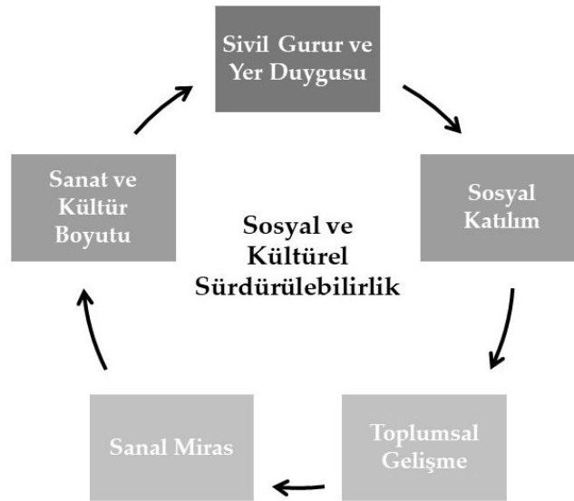
Şekil 2. Sosyal ve Kültürel Sürdürülebilirlik Kriterleri (Stubbs, 2004)