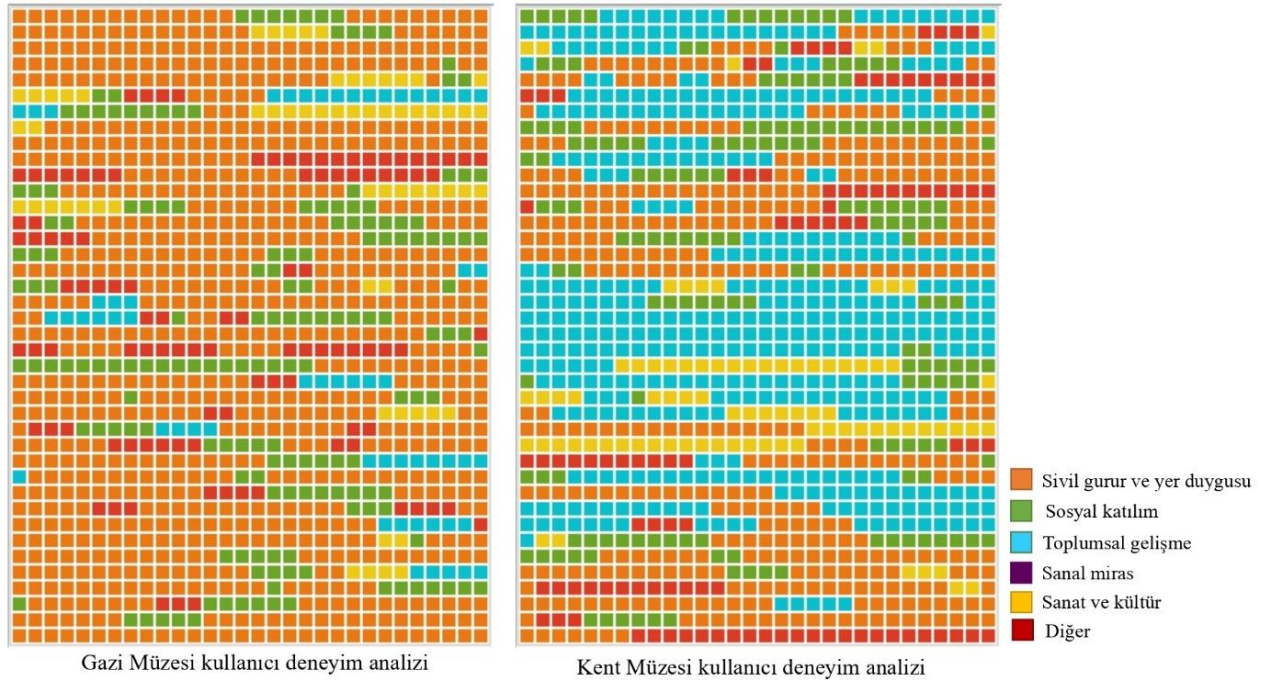
Şekil 5. Örneklemenin Yorum İçerik Modeli

İçerik analizinde Gazi Müzesi için 86 kullanıcının yorumlarından 161 içerik; Kent Müzesi için 83 kullanıcının yorumlarından 163 içerik 6 kod ile eşleştirilmiştir (Şekil 6). Gazi Müzesi'nde yorum içeriklerinin %49'u sivil gurur ve yer duygusu, %24,2'si sosyal katılım, %5,8'i toplumsal gelişim, %5,5'i sanat ve kültür boyutu, %15,5'i ise diğer başlıkları ile ilişkili olmuştur. İçeriklerde sanal mirasla ilişkili yoruma rastlanmamıştır. Kullanıcıların sivil gurur ve yer duygusuna ilişkin olarak Atatürk ve Kurtuluş Savaşı ile ilgili çok sayıda fotoğrafın, balmumu heykelin ve eşyanın müzede sergilenmesi, sergilenen eşyaların kurtuluş mücadelesine bizzat tanıklık etmiş olması, müzede yer alan yazılı kaynaklardan dönemin tarihine ve Samsun'a ilişkin bilgilere ulaşılıyor olması vurgulanmıştır. Kullanıcılar sosyal katılım ile ilişkili olarak müze ziyareti için ücret ödemediklerini, müzenin şehrin merkezinde konumlanmasını ve yakın çevresinde ziyaret edilecek farklı lokasyonların olduğuna dikkat çekmişlerdir. Toplumsal gelişim ile ilişkili olarak ise müzede sergilenecek çok sayıda eserin bir araya getirilmesinin topluma sağladığı fayda öne çıkarılmıştır. Sanat ve kültür boyutu için kullanıcılar tarihi bir yapının korunarak ve aktif bir şekilde kullanılarak günümüze kazandırılmasını vurgulamışlardır. Bunun yanı sıra kullanıcılar diğer olarak değerlendirilebilecek tavsiye, beğeni ve eleştiri odaklı yorumlarda bulunmuşlardır.