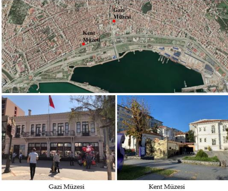
Şekil 1. Örnekleme Oluşturan Yapılar ve Kentteki Konumları

geçici ve kalıcı sergileme alanları; lokal binasında kent arşiv kütüphanesi, teknik birimler, depo ve ıslak hacimler yer almaktadır (Us vd., 2017; Yalçın, 2017). Yeni ek yapılar da ise giriş, danışma, etkinlik ve sergi alanları bulunmaktadır. Kent müzesi ziyaretçilere Samsun'un tarihi, sosyal, kültürel, coğrafi ve ekonomik yapısına ilişkin kalıcı ve geçici sergi alanları, sanal sergiler ve çeşitli etkinlikler ile kent belleğini ve toplumsal hafızayı canlı tutan bir deneyim sunmaktadır. Ayrıca kent müzesi bulunduğu alan içerisinde kafeterya, bakım atölyesi ve açık alanlar bulunmaktadır. Müze pazartesi günleri kapalı olup diğer tüm günler ziyarete açıktır (Şekil 1).