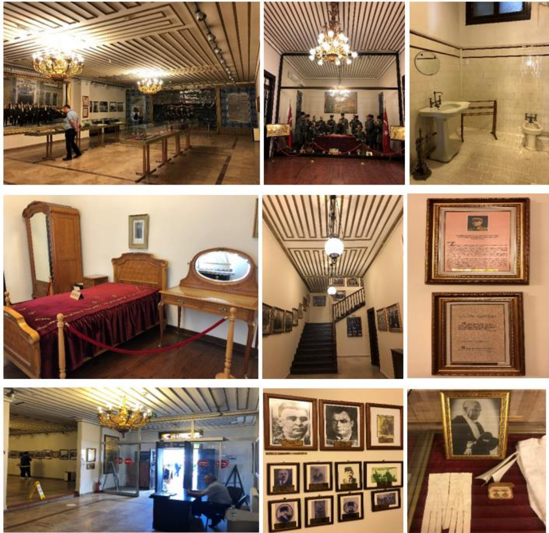
Şekil 3. Gazi Müzesi'ne Ait Görseller

veren okulların toplu ziyaretleri ile toplumun eğitim ve öğrenimine katkı sağlamaktadır. Müzenin tanıtımına yönelik çeşitli kurumlara ait resmi web sayfaları bulunmakla birlikte bu sayfaların içerikleri yapının tarihsel süreçteki kullanımı ve müzenin bölümleri ve içeriğine ilişkin kısıtlı bilgilerden oluşmaktadır. Bu durum güncel ve doğru bilgi ve duyurulara ulaşmakta kısıtlar oluşturmaktadır. Diğer taraftan çeşitli seyahat sitelerinin yorum bölümlerinde müzeyi deneyimleyen kullanıcıların çeşitli yorum ve fotoğraflarına ulaşmak mümkündür. Yeniden kullanıma adapte edilerek topluma kazandırılan yapı döneminin yapı kültürünü ve mimari anlayışını yansıtmaktadır. Atatürk'ün konakladığı oda, bekleme ve oturma alanı gibi yapının özgün işlevine ait birimler mekan ve mobilya kapsamında korunarak özgün işleve atıfta bulunulmuştur. Diğer taraftan tarihsel süreçte yapı, kısım kısım farklı işlevlerde kullanılmış olmakla birlikte, Gazi Müzesi işleviyle tüm katlarında bütüncül mekan kurgusu korunabilmiştir. Böylece farklı işlevden dolayı yapıda oluşabilecek çeşitli tahribatların önüne geçilmiştir. Öte yandan yapı, çevre yapılarla ilişkisi kapsamında açık, yarı açık mekanlar ve ziyaretçilerin vakit geçirip sosyalleşebileceği ortak alanlar bakımından yetersizdir (Şekil 3).