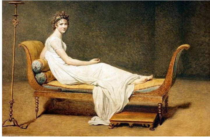
Resim 5. Jacques Louis David, Madame Recamier, 1800 (URL-5).