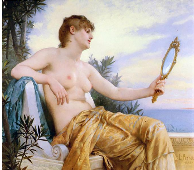
Resim 11. Léon Bazile Perrault, The Mirror (Narcissa), 1886 (URL-11)

John Berger, sanat yaratımında kadın bedeninin eril toplum tarafından metalaştırılması, arzu nesnesi haline getirilmesini keskin bir dille eleştirmekte, kadına çıplak olması üzerinden ahlak dersi verilmeye çalışıldığından bahsetmektedir. Sadece bakmaktan zevk alındığı için çıplak kadın resmi çizildiğini, kadının kendisine, çıplaklığına bakılmasını içselleştirmesi için elindeki ayna ile onu da bu çıplaklığına bakışa ortak edildiğini vurgulamaktadır. Kendine hayranlık olarak adlandırılan, elinde aynalı bu tarzdaki resimler aynı zamanda ahlaki bağlamda günaha davet, iffetsizlik gibi lanse edildiğini ve böylelikle kadın üzerinden ahlak dersi verilmeye çalışıldığını söylemektedir (Antmen, 2008: 45). Berger bu cümleleriyle erkek merkezli bir toplumda kadın çıplaklığını resmetmekten sanatçının da o resme sahip olanında zevk aldığını ve eline tutuşturulan ayna ile kadının kendini nesneleştirmesine ortak etmeye çalışıldığını bunun riyakâr bir ahlakçılık olduğunu belirtmiştir. 1973 yılında Carol Duncan'ın yazdığı "18.Yüzyıl Fransız Sanatında Mutlu Anneler ve Başka Yeni Fikirler" başlıklı makalesinde, 18.yüzyıl Fransa'sında kadınlara uygun rolleri benimsetmeyi amaçlayan üretimlerle anneliğin ve evliliğin doğal, değerli ve mutluluk veren rolü üzerinde durulduğunu ancak bunun burjuvazinin yeni oluşan devlet yapısının ihtiyaçları doğrultusunda oluşturulduğunun altını çizmektedir.