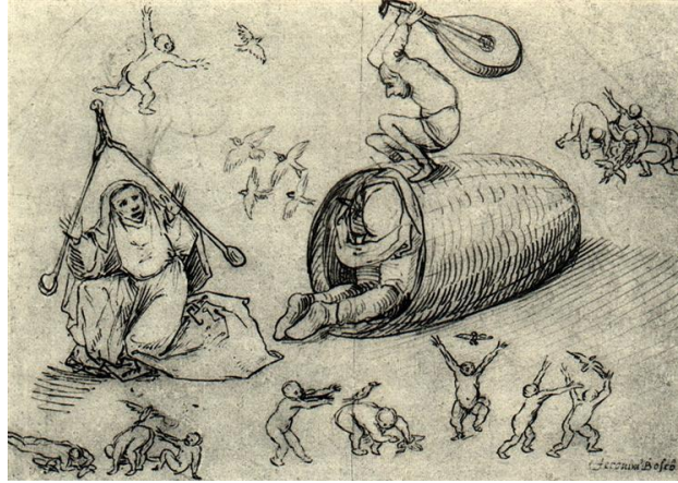
Resim 1. Hieronymus Bosch, Beehive and witches, 1465-1516 arası (URL-1).