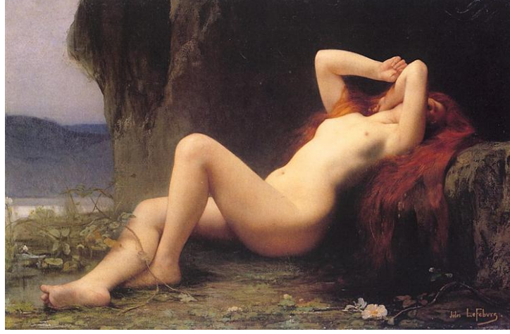
Resim 9. Jules Joseph Lefebvre, Mary Magdalene In The Cave, 1876 (URL-9).