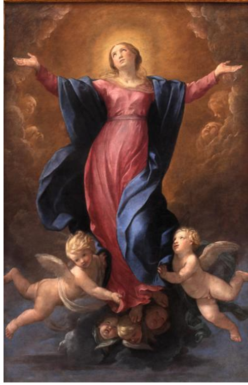
Resim 4. Guido Reni, The Assumption of the Virgin, 1580 (URL-4)