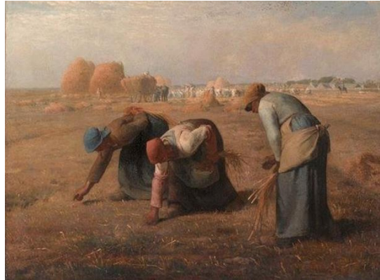
Resim 8. Jean François Millet, "The Gleaners", 1857 (URL-8).

Kadın imgesini olduğu gibi hayatın içinde ve dönemin koşullarında sosyal yaşamın ağır sorumluluklarını yerine getirirken yansıtan gerçekçi ressamların varlığını da belirtmek gerekir. Gerçekçi ressamlardan Millet'in "The Gleaners" (toplayıcılar) ve Daumier'in "Çamaşırcı Kadın" tabloları kadınların toplumsal gerçekliğini gözler önüne serer.