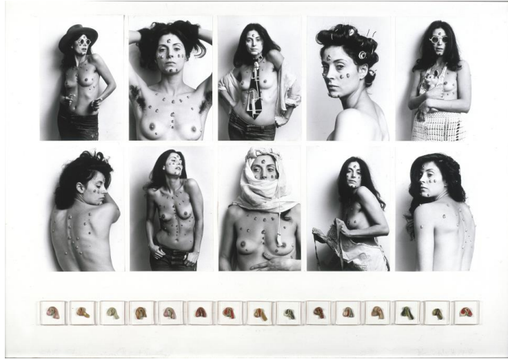
Resim 14. Hannah Wilke S.O.S. - Starification Object Series, 1974-82 (URL-14).

1982'de yapılan bir söyleşide feminist sanatçı ve kuramcı Mary Kelly kadın imgesinin yani bedeninin veya kimliğin sanat eserlerinde sunulmuş olmasını ciddi bir problem olduğunu söylemektedir. Bilhassa kendisini, kendi bedenini sanat eseri olarak sunan kadın sanatçıların aslında eril düşüncenin öne sürdüğü bakılan nesne olarak kadın imajını desteklediklerini vurgulamaktadır. Bu tarz temsillerin bir meydan okuma ya da verili bir kendilik durumu olarak kadınlık kavramını sorgulamayacağını, yanlış seçilmiş yabancılaştırma araçları olduğunu ifade etmektedir (Antmen, 2008: 304).