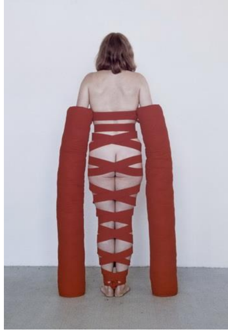
Resim 12. Rebecca Horn, Arm Extensions, 1968 (URL-12)

Ancak dönemin, Feminist sanatçıları ve bazı eleştirmenleri herhangi bir şekilde kadın bedeninin sunulmasını veya temsil edilmesini fetişizm dinamiğine kaçınılmaz olarak bir katkı olarak görmüş ve herhangi bir yolla işaret edilmesinden kaçınılması gerektiğini savunmuşlardır (Akalin ve Baş, 2018:125- 128).