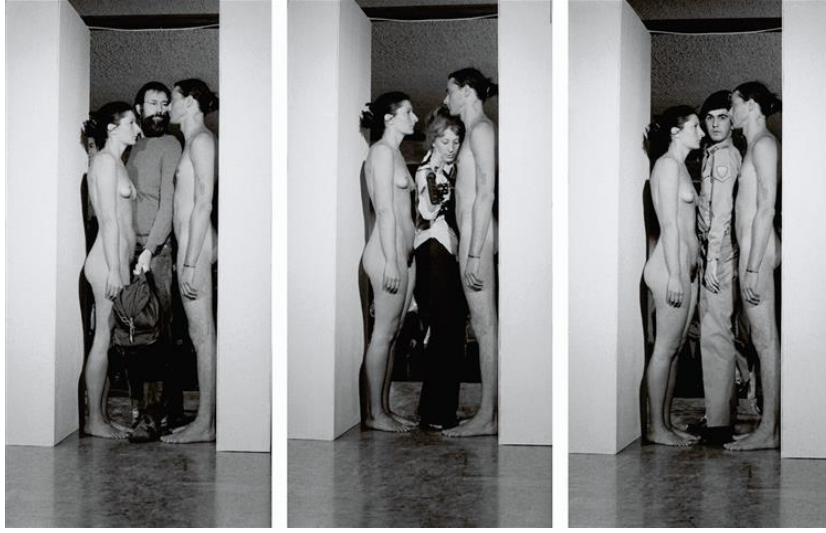
Resim 13. Marina Abramovic, Imponderabilia, Bologna, Italy 1979 (URL-13)