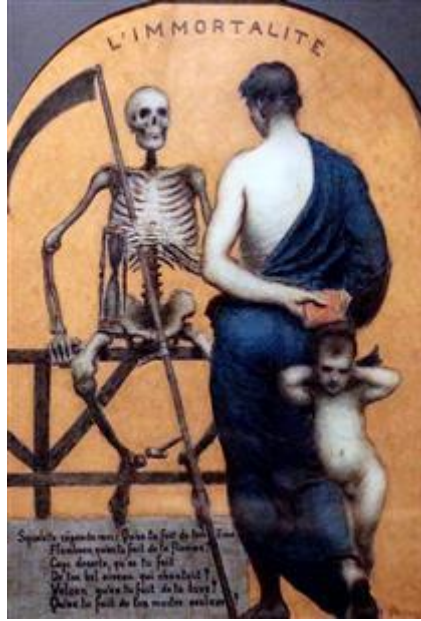
Resim 7. Xavier Mellery, Immortality, 1890

Kadın imgesini olduğu gibi hayatın içinde ve dönemin koşullarında sosyal yaşamın ağır sorumluluklarını yerine getirirken yansıtan gerçekçi ressamların varlığını da belirtmek gerekir. Gerçekçi ressamlardan Millet'in "The Gleaners" (toplayıcılar) ve Daumier'in "Çamaşırcı Kadın" tabloları kadınların toplumsal gerçekliğini gözler önüne serer.