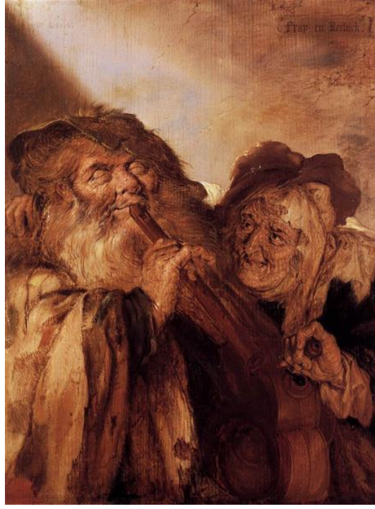
Resim 2. Adriaen van de Venne, Beautiful and Ugly, 1628 - 1634 (URL- 2)