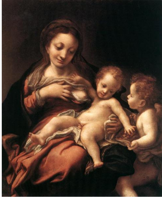
Resim 3. Correggio, Virgin and Child with an Angel, 1520 – 1524 (URL-3).

Barok dönemde ise kutsal Meryem'in bekâreti yüceltilmiştir. İktidara tek başına sahip olmak isteyen erkeklerin, kadınları kontrol altında tutma hevesiyle manipüle aracı olarak kullandığı bekâret konusu birçok sanatçı tarafından resmedilmiştir.