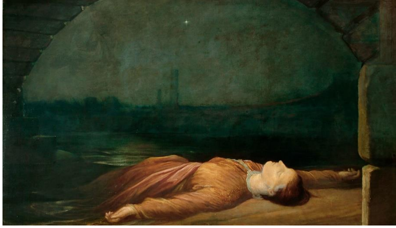
Resim 6. George Frederic Watts, Found Drowned 1850 (URL-6).