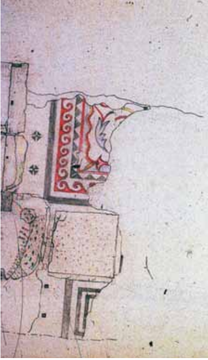
Resim 2 1 Numaralı mekan