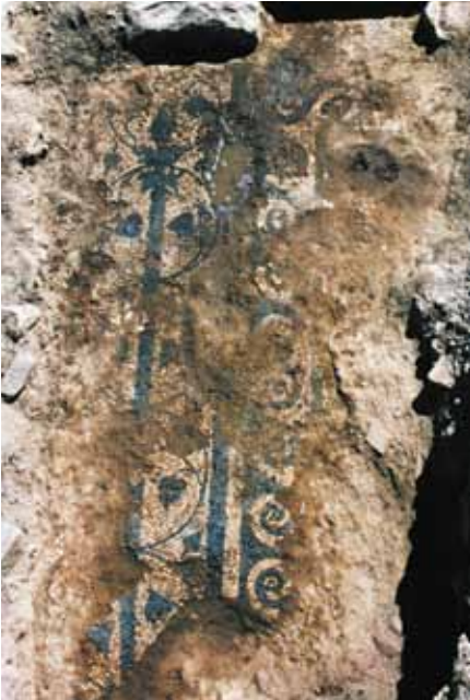
Resim 14 4 Numaralı mekan

devam etmiştir 44 . Gara Kilise'sinde 45 , Ksanthos'ta 46 , Dağ Pazarı Kilise'sinde 47 , Kephalos'daki Hagios Stephanos Bazilika'sında 48 kenar bordürü, ikili halat motifinin çok sayıdaki örneğinden birkaçıdır.