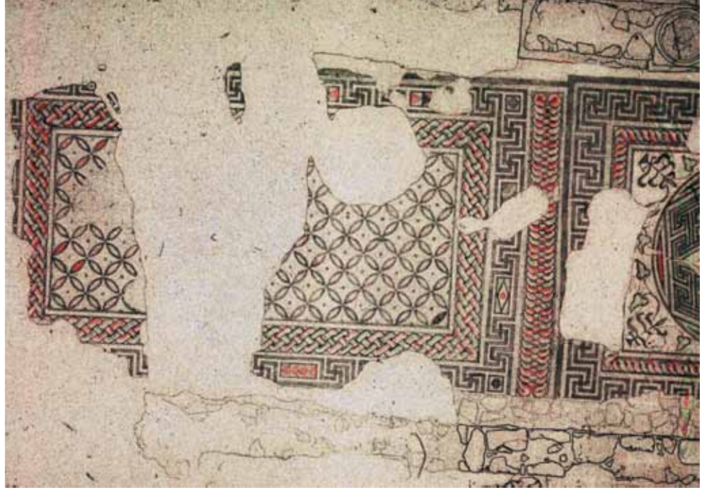
Resim 10 3 Numaralı mekan

Bu düzenlemenin yakın benzerleri Bodrum'da 35 , Knidos'ta E Bazilikasının narteks mozağında 36 , Kos Ada'sındaki dört bazilikada 37 ve Milet'te 38 karşımıza çıkmaktadır. Bu kompozisyonda genel hatlar sabit kalmakla birlikte dört pelta arasında oluşan dörtgenlerin içleri farklı motiflerle bezenmektedir. Kos'daki Hagios Stephanos'ta dört pelta motifinin ortasında kalan kare mekânı kuş, Knidos'ta Süleyman düğümü doldururken, Milas'taki örnekte diğerlerinde görmediğimiz birbiri ile kesişen çapraz şeritlere yer verilmiştir.