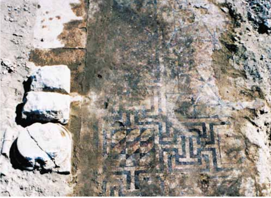
Resim 8 2 Numaralı mekan 1 nolu pano bordür

kullanılmış bir motiftir 30 . Knidos'ta, Ksanthos'ta, Sardis'de, Narlı Kuyu'da, Bursa Derecik Bazilika'sındaki mozaiklerde yer alan motifler içinde birçok örneği bulunmaktadır 31 . Yaygın olarak görüldüğü Pompeii ve Spolato motifin çıkış yeri olarak kabul edilir 32 .