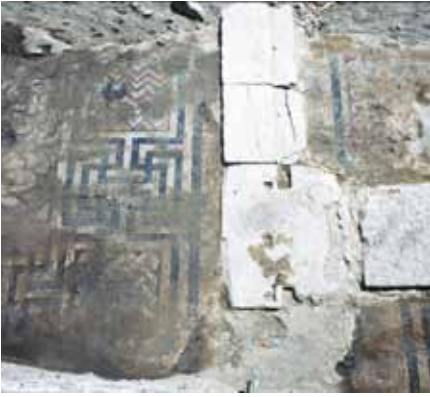
Resim 3 1 ve 2 Numaralı mekanların bordürleri

Bu yöndeki kazılar sonucunda duvarın batıya doğru da devam ettiğini gösteren iki temel taş bloğu daha ortaya çıkarılmıştır. Bu duvar temelinin kuzey ve güneyinde farklı kompozisyonlarda yapılmış mozaikler bulunmuştur.