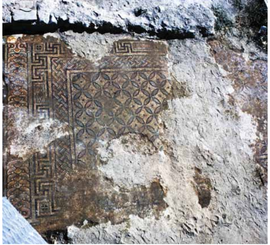
Resim 13 3 Numaralı mekan 2 nolu pano detay