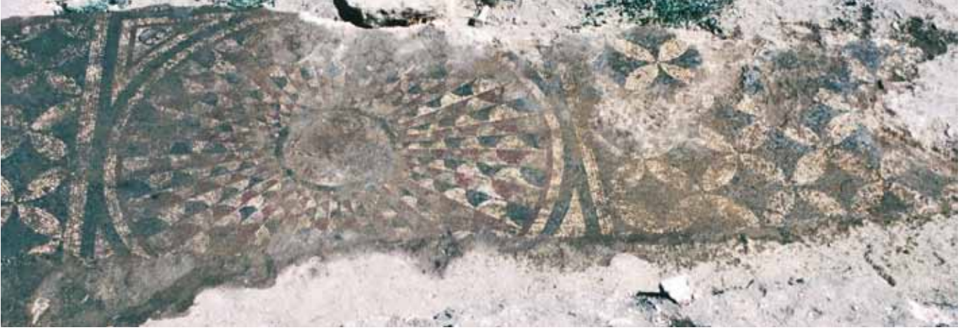
Resim 16 6 Numaralı mekan

mozaiklerde 62 benzer motifi görmek mümkündür. Aynı desen Orta Bizans dönemi mimari plastik eserler üzerinde de bezeme unsuru olarak kullanılmıştır 63 .