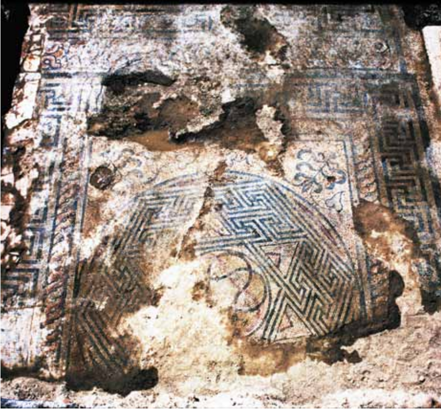
Resim 11 3 Numaralı mekan 1 nolu pano detay

deseniyle doldurulmuştur. Üçgenlerin içinde yer alan küçük üçgenlerde kırmızı tesseralar kullanılmıştır. Altıgenin merkezinde daire içinde, siyah ve kırmızı renkte üçlü düğüm deseni vardır. Bu üçlü düğüm, birbirine geçmeli halka biçimindedir. Panonun dışında, ikili örgü bandı ve mavi tesseralı gamalı haç desenli bordür mevcuttur. Panonun dar kısmı tahrip olmuştur.