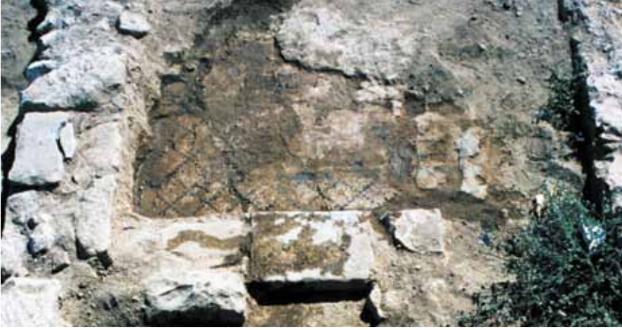
Resim 15 5 Numaralı mekan