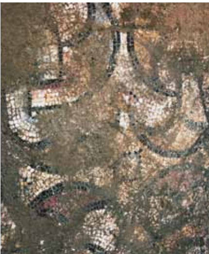
Resim 7 2 Numaralı mekan 1 nolu pano detay

Tek olarak yaygın bir kullanım gösteren pelta motifi 25 , buradaki şekliyle de erken dönemlerden itibaren zemin mozaiklerinde yer almıştır 26 . Ksanthos Bazilika'nın kuzeydoğusundaki mozaik kalıntılarında 27 , Sardis'teki Sinagog'da 28 , Sinop'taki Kilise'de 29 , Milas'takine benzer düzenlemede yapılmış pelta ve Süleyman düğümleri görülmektedir. İç içe geçmiş oval halkardan oluşan Süleyman düğümü İ.Ö. I. yüzyıldan itibaren mozaik döşemelerde