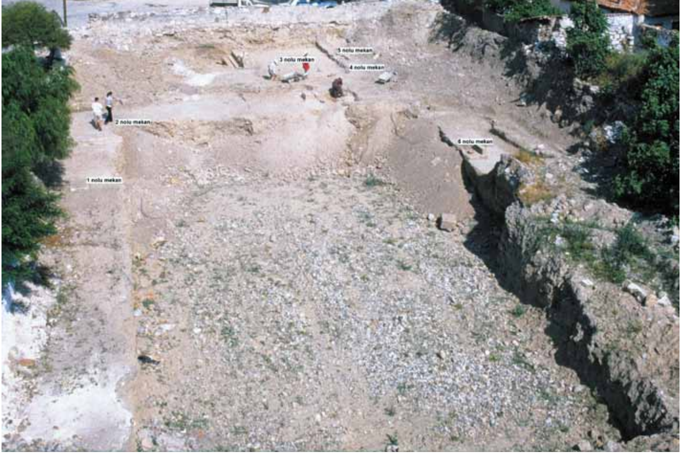
Resim 1 Mozaikli alan

Milas'ın Ahmet Çavuş mahallesindeki bir arsada yapılan temel hafriyatı sırasında antik döneme ait duvar kalıntılarıyla bunların arasında kalan mekânların zemininde döşeme mozaiklerinin olduğu tespit edilerek alanda, Milas Müzesi tarafından bir kurtarma kazısı gerçekleştirilmiştir 1 . 54 x 38.42 m. boyutlarındaki bir alanı kapsayan kazılar sırasında parselin kuzey, güney ve doğu kısımlarında taban mozaiklerinin yer aldığı belirlenmiştir 2 . Bu mozaiklerin doğuya ve kuzeye caddelerin altına doğru da devam ettiği görülmüştür. Güneyde ise, konutlar ve büyük toprak yığınları bu alandaki kalıntıların varlığı hakkında bilgi edinilmesini zorlaştırmıştır (Resim 1).