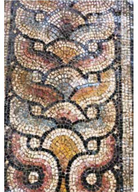
Resim 12 3 Numaralı mekan orta bordür

Kompozisyonu içten çevreleyen ikili örgü motifinin de svastika gibi erken dönemlere kadar giden bir geçmişi vardır 42 . Kökeni mimariye dayanan motif, birbirine sarılmış iki halattan oluşmaktadır 43 . Bu motif, hiçbir değişime uğramadan Erken Bizans dönemi mozaiklerinin yanında taş bezemelerde de kullanılmaya