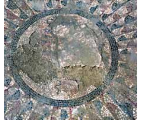
Resim 17 6 Numaralı mekan detay

Kesişen dairelerden oluşan düzenleme Atina'daki Areopagus ve Efes yamaç evlerindeki Dionysos Villa'sında 76 eskiçağa ait örnekler olarak karşımıza