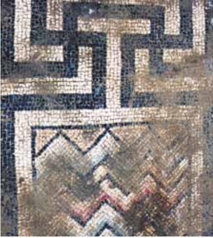
Resim 5 2 numaralı mekan zigzag motifi

Adası 14 , Perge 15 , Dağ Pazarı 16 ve Kastamonu'daki 17 mozaik kalıntıları içinde de svastika motifinin ana düzenleyici olduğu bordürler kullanılmıştır. Ancak Milas'taki örnekte kare ve dikdörtgen panoların içleri farklı geometrik düzenlemelerle bezenmiştir. Bordürün kuzey köşelerindeki kareleri dolduran sepet örgü motifini 3 numaralı mekânda görüldüğü gibi kenar bordürü olarak da kullanılabilmektedir. Ksanthos Doğu Bazilikasının atriumundaki panolardan birinin ortasında 18 , Sardis'teki Sinagog'da 19 , Knidos'taki E Bazilika'sının narteks mozağında 20 Milas'ta olduğu gibi kare çerçevelerin içine yerleştirilmiş örgü motiflerine yer verilmiştir. Dikdörtgen çerçeveler içinde yer alan renkli tesseraların açıktan koyuya doğru dizilmesi ile bir gökkuşağı etkisinin yaratıldığı zikzak motifi Ksanthos Bazilika'sındaki mozaiklerde de görülmektedir 21 . Aynı motif, Pompeipolis ve Sebastopolis'teki döşeme mozaiklerinde geniş bir alanın bezemesi olarak kullanılmıştır 22 . Bordürde yer alan kare çerçeve içindeki dama motifinde renk tonları ile üç boyutlu bir görünüm oluşturulmuştur. Zeugma mozaikleri arasında yer alan bir panonun iç kompozisyonunun tamamı Milas'taki ile benzeşen dama motifinden oluşmaktadır 23 . Bunun bir benzeri Erken Bizans döneminde Kastamonu'daki mozaiklerde kullanılmıştır 24 .