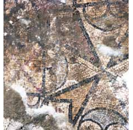
Resim 9 2 Numaralı mekan 2 nolu pano detay

Diğerine göre oldukça tahrip olmuş durumdaki ikinci panoda (Resim 4) kırmızı ve sarı renkli dört kollu yıldız desenleri görülür. Kollarında içi rozetli kare desenleri yer alır. Bunların arası, pelta, paralel kenarlar ve kare desenleriyle doldurulmuştur (Resim 8, 9). Peltaların önlerinde içi eşkenar dörtgen şeklinde olan dikdörtgenler yer alır. Haçın kolları arasındaki üçgenlerin ucundaki içleri haç formu çiçekle bezenmiş kareler, köşelerdeki üçgenlerle tamamlanmıştır. Tanımlanan formdaki iki motifin yan yana geldiği alanın etrafı dört pelta ile çevrilerek içi çapraz şekilde kırmızı renkli taşlarla döşenmiştir. Kompozisyonu oluşturan formların dış konturları mavi renkli tesseralarla çevrelenirken peltaların içleri açık mavi, haç kolları beyaz, kol araları sarı ve kırmızı, haç formu çiçekler kırmızı, dikdörtgenler ise sarı ve açık mavi renktedir. Dört kollu yıldız olarak adlandırılan 33 bu motifin sadece Karia'nın güney batısında yaygın olarak görüldüğü ileri sürülmektedir 34 .