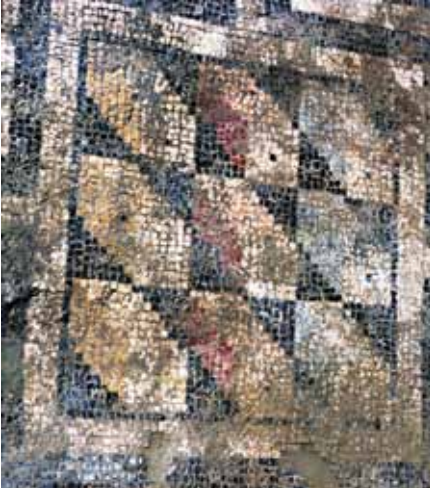
Resim 6 2 Numaralı mekan dama motifi

Adası 14 , Perge 15 , Dağ Pazarı 16 ve Kastamonu'daki 17 mozaik kalıntıları içinde de svastika motifinin ana düzenleyici olduğu bordürler kullanılmıştır. Ancak Milas'taki örnekte kare ve dikdörtgen panoların içleri farklı geometrik düzenlemelerle bezenmiştir. Bordürün kuzey köşelerindeki kareleri dolduran sepet örgü motifini 3 numaralı mekânda görüldüğü gibi kenar bordürü olarak da kullanılabilmektedir. Ksanthos Doğu Bazilikasının atriumundaki panolardan birinin ortasında 18 , Sardis'teki Sinagog'da 19 , Knidos'taki E Bazilika'sının narteks mozağında 20 Milas'ta olduğu gibi kare çerçevelerin içine yerleştirilmiş örgü motiflerine yer verilmiştir. Dikdörtgen çerçeveler içinde yer alan renkli tesseraların açıktan koyuya doğru dizilmesi ile bir gökkuşağı etkisinin yaratıldığı zikzak motifi Ksanthos Bazilika'sındaki mozaiklerde de görülmektedir 21 . Aynı motif, Pompeipolis ve Sebastopolis'teki döşeme mozaiklerinde geniş bir alanın bezemesi olarak kullanılmıştır 22 . Bordürde yer alan kare çerçeve içindeki dama motifinde renk tonları ile üç boyutlu bir görünüm oluşturulmuştur. Zeugma mozaikleri arasında yer alan bir panonun iç kompozisyonunun tamamı Milas'taki ile benzeşen dama motifinden oluşmaktadır 23 . Bunun bir benzeri Erken Bizans döneminde Kastamonu'daki mozaiklerde kullanılmıştır 24 .