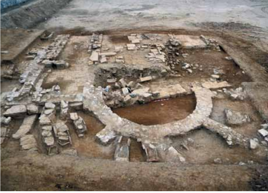
Resim 4 Yapıya doğu yönden bakış. Apsisin çevresi gömü alanı olarak kullanılmıştır.