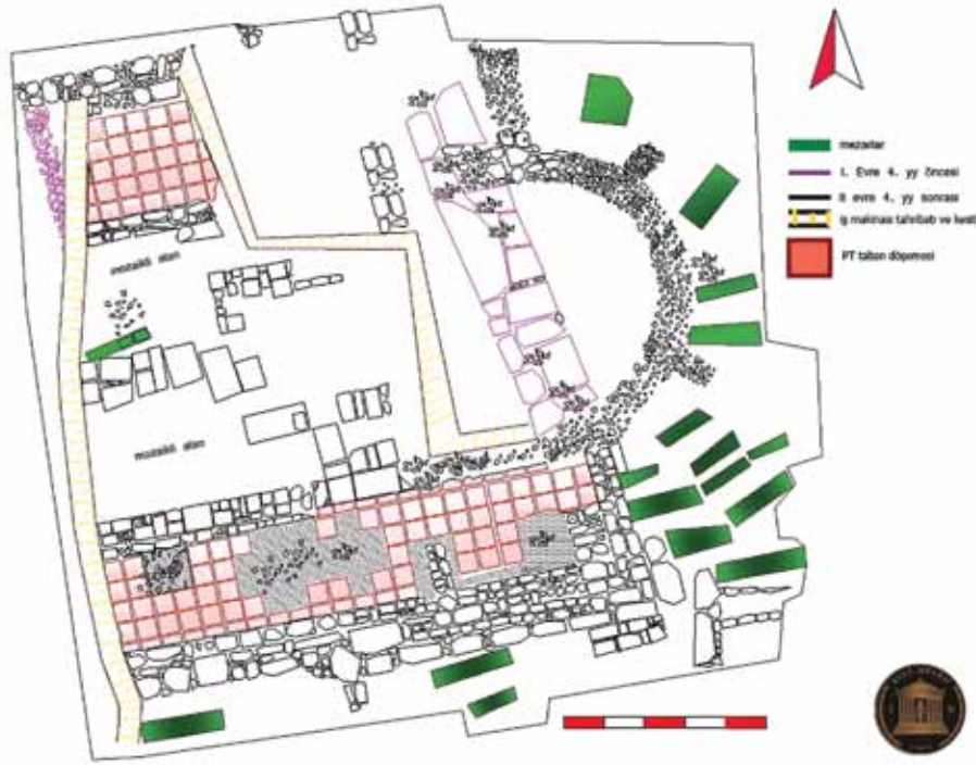
Plan 1 Arvalya Bazilikası (Çiz. Efes Müzesi)