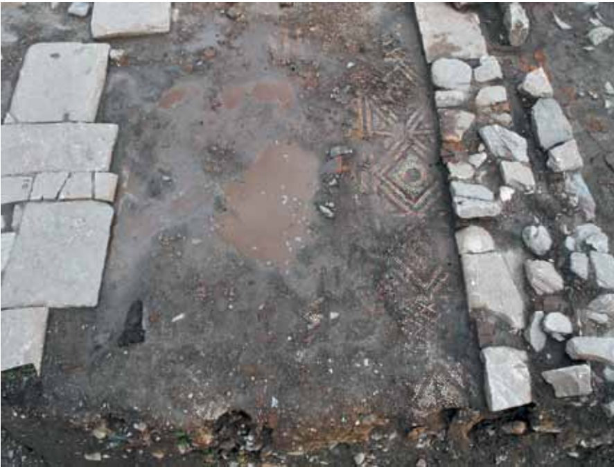
Resim 5 Orta nefte günümüze ulaşan mozaik döşemeye batı yönden bakış.

bölümü kaybolmuştur. Mozaik, güney kesimde doğrudan devşirme olarak kullanılmış taş döşeli yatağın üzerine döşenmiştir. Taşların üzerinde yer yer rudus/harç tabaka izlenmektedir. Mozaik'in tamamen kaybolduğu kesimlerde ise statumen tabakası kısmen takip edilmektedir.