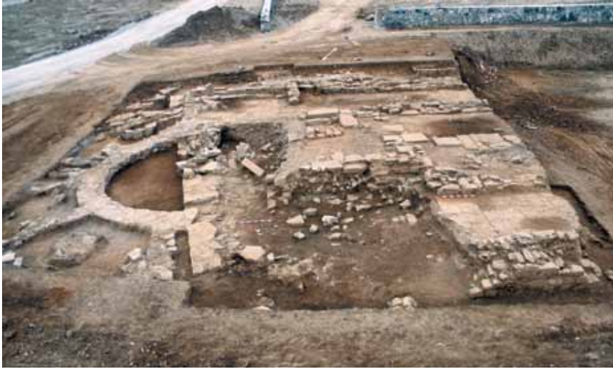
Resim 1 Yapıya kuzey yönden bakış. Kuzey yan nefin tahribatı dikkat çekmektedir.

Kilise, doğu-batı doğrultusunda uzanmaktadır. Üç nefli bazilikal plan şemasındadır (Bkz. Plan 1). Orta nef yan neflere göre daha geniştir. Doğusunda, içten ve dıştan yuvarlak planlı bir apsisi bulunmaktadır. Batı sınırları inşaat hafriyatı sırasında kaybolmuştur. Yapının bugüne ulaşan boyutları, kuzey-güney yönünde 17 m.; doğu-batı yönünde 18 m.dir. Apsisi birinci evrenin doğu duvarına yaslanmaktadır. Kuzey nefin büyük bölümü iş makinesi tahribatına uğramıştır (Resim 1). Güney nef kısmen daha iyi durumdadır (Resim 2). Nefleri ayıran destekler günümüze ulaşmamıştır. Kazı buluntuları içinde üst örtüyü taşıyan sütun parçası ve ona ilişkin herhangi bir başlık ele geçmeyişi, arşitrav parçası bulunmayışı, neflerin payelerle birbirinden ayrıldığını ve payelerin kemerlerle birbirine bağlandığını düşündürmektedir 2 . Yapının planına ilişkin bir diğer veri de