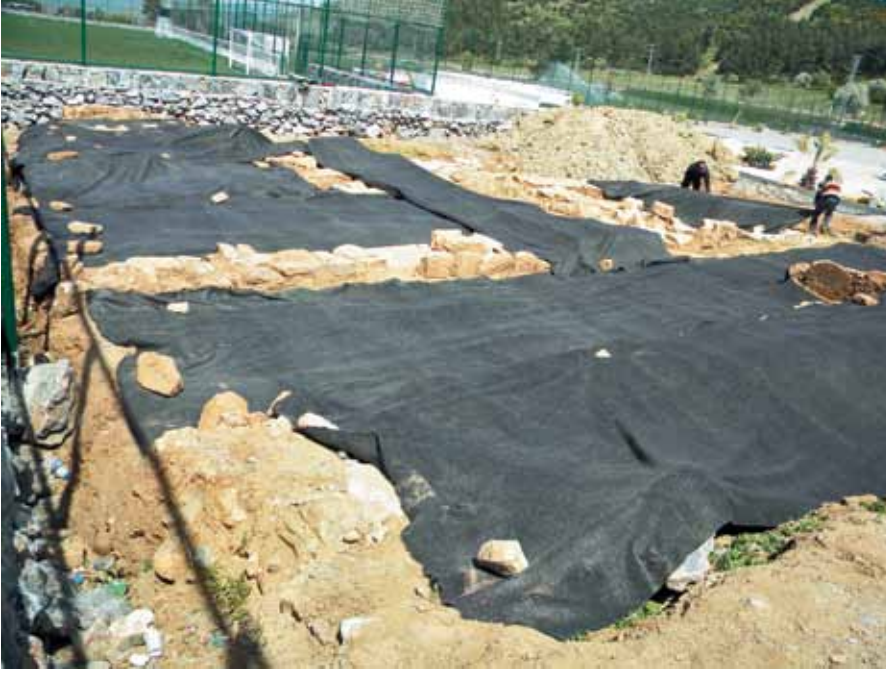
Resim 6 Kilisenin kazısı yapıldıktan sonra üzeri kapatılarak koruma altına alınmıştır.