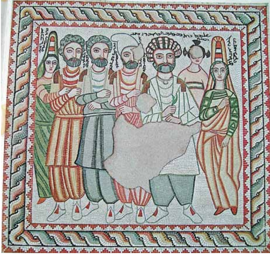
Resim 4 Aile Portresi Mozaïği, Edessa (Segal 2002: fig. 1)

(Resim 4) (Salman 2007: 75; Salman 2008: 123). Üzerlerinde yazıtlardan kesin tarihli iki Orpheus Mozaïğinden biri kayıptır (Segal 1959: 155-157), diğeri ise Dallas Art Museum'da sergilenir (Healey 2006; Salman 2008c: 110). Orpheus mozaiklerinde hayvanlar üst üste dizilmişlerdir. Yine MS. 3. yüzyıla ait bir mozaikte bu sefer bir aileyi oluşturan bireylerle beraber, figürlerin üzerlerinde yer alan yazıtlardan okunduğu üzere, Zeus ikonografilerine uygun olarak betimlenmiş Maralaha ve Hera betimlemeleri yer alır. Aynı mozaikte Prometheus'un cansız bedenlere ruh vermesi işlenmiştir (Resim 5) (Bowersock 2001: 411-416).