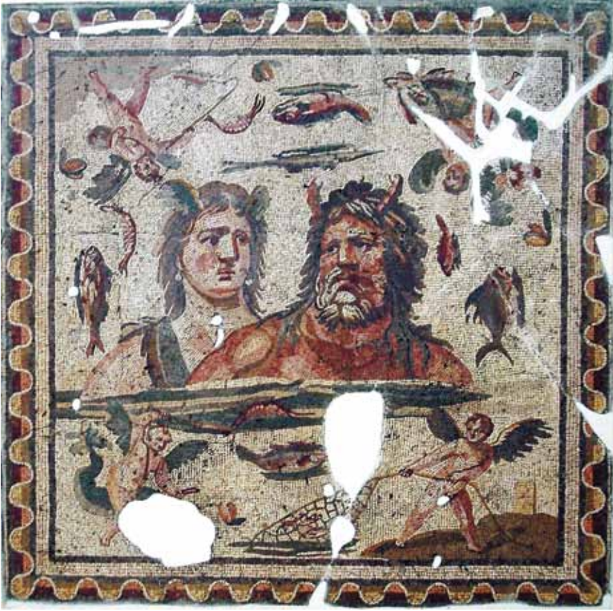
Resim 10 Okeanos ve Thetis, Antiokheia