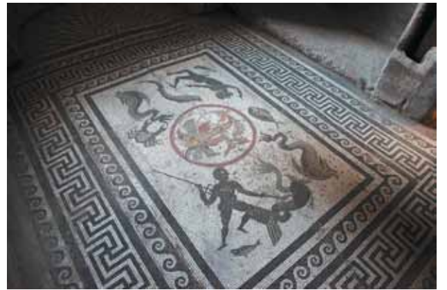
Resim 8 Herakles Mozaği, Birta