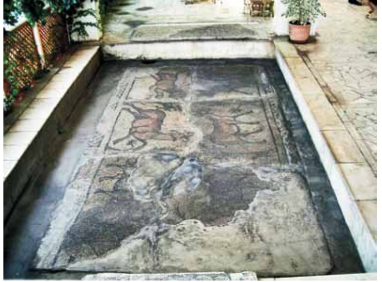
Resim 6 Hayvan Mozaïği, Edessa