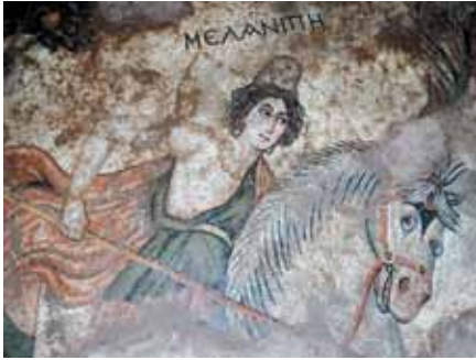
Resim 7 Haleplibahçe Mozaïği (Aydemir vd. 2008: fig. 5)

geçen ve çoğunlukla figüratif sahneler oldukça renkli olarak tasvir edilmişlerdir. Geometrik desenler dışında bu yapıya ait mozaiklerde Amazonların av sahneleri, aslan ve kuş tasvirleri ilk sezondaki çalışmalarda ortaya çıkarılmıştır (Aydemir et al. 2008: 2-4, fig. 1-7). Daha sonraki çalışmalarda ise yapının 8 nolu odasında Ktisis (Aydemir et al. 2009: fig. 1-2), 9 nolu odada Zebra Mozaïği (Aydemir et al. 2009: fig. 4), apsisli koridorda ise Akhilleus'un bekleliğinden Troia Savaşına götürülüşüne kadarki süreç resmedilmiştir (Aydemir et al. 2009: fig. 5-7). Haleplibahçe Mozaiklerindeki figürlerin işleniş ve zeminde uygulanan teknik bu mozaiklerin MS. 5.-6. yüzyıla ait olduklarını göstermektedir (Aydemir et al. 2008: 7; Aydemir et al. 2009: 18) (Resim 7).