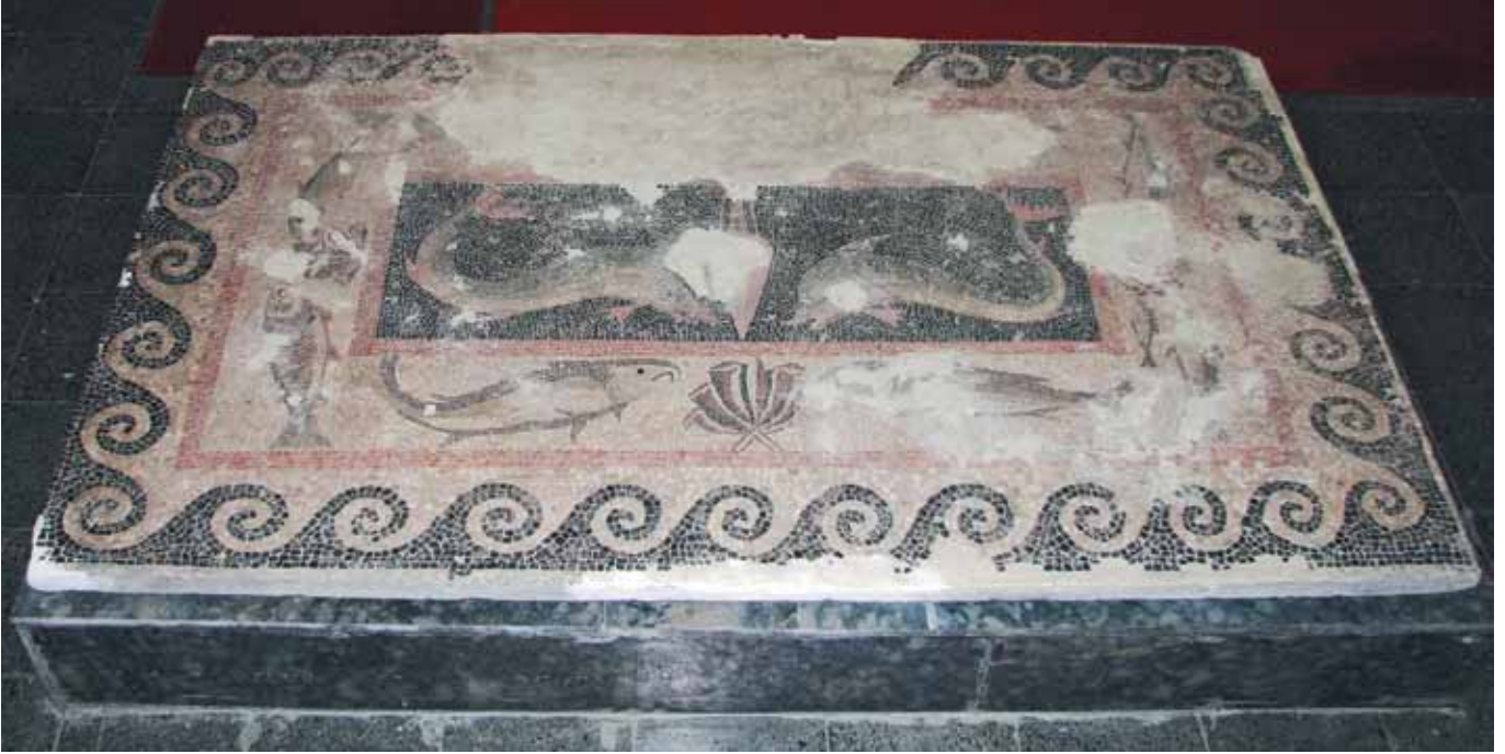
Resim 1 Hellenistik Devir Balıklı Mozaik, Samosata

atası Arseme'stir. 1 Kral 1. Antiokhos'un babası Mithradates Kallinikos (M.Ö. 100–70) zamanında burada bir hierothesion meydana getirilmiştir. 2 Arsemeia'daki mozaikler platonun batı tarafındaki Hellenistik Dönem tören mekanlarında bulunmuştur. Buradaki iki tören odasında zeminler mozaik döşeme ile kaplıdır. Bunun dışında F.K. Dörner ve ekibi bu mekanların hemen yanı başlarında iki küçük mozaikli alan daha tespit etmiştir. Mozaik döşemelerin hiç biri tam olarak ele geçmemiştir. Bir numaralı tören alanındaki, rekonstrüksiyon'u yapılan mozaik döşeme, 10. 87 x 9. 22 m. Ölçülerindedir (Dörner 1999: 188). Diğer tören alanının zeminindeki mozaik 13.85 x 14. 62 m. lik bir alanı kaplamaktaydı. Buradaki mozaığın sadece kenar bordürlerine ait bazı parçalar ele geçmiştir. Emblema kısmında nasıl bir sahne olduğu bilinmese de, yine yunus balıklı bir sahnenin olması yüksek bir ihtimaldir (Bingöl 1997: 106–107) (Resim 2).