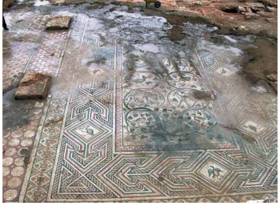
Resim 3 Perre Mozaïği