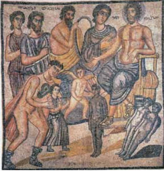
Resim 5 Maralaha Mozaïği, Edessa (Bowersock 2001)