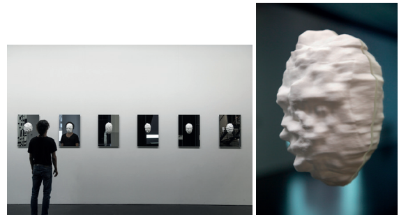
Resim 7. ve 8. Sterling Crispin ve Data-Masks (Series), 2015, (e.a: http://www.sterlingcrispin.com/zkm_infosphere.html ) (Soldan sağa doğru)

Tayvanlı sanatçı Shu Lea Cheang, on altıncı yüzyılda hapis olarak hizmet veren, şu anda ise sergi mekânı olarak kullanılan Palazzo delle Prigioni'nin tarihinden esinlenerek bir çalışma yaratmıştır. Eserin başlığı, günümüzün standartlaştırılmış endüstriyel hapis mimarisine atıfta bulunmaktadır. Öyle ki; 6 kamera tarafından sürekli izlenen 3 x 3 metre karelik bir hücre (Resim 9. 10.) kurgusuyla hem fiziksel olarak hem de dijital gözetleme mekanizmalarının varlığıyla inşa edilen hapis gerçeklerine değinmektedir. Koşulların ışığında sanatçı, çağdaş iletişim ve gözetleme teknolojilerinin kimlikleri nasıl şekillendirdiğini yeniden düşünmek için adeta panoptikon kavramı üzerinden Prigioni'yi yüksek teknoloji bir gözetleme sistemine dönüştürmüştür.