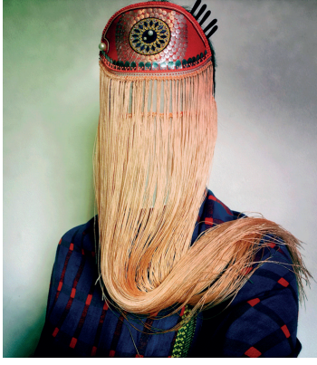
Resim 14. Damselfrau, (e.a: https://www.damselfrau.com/ )