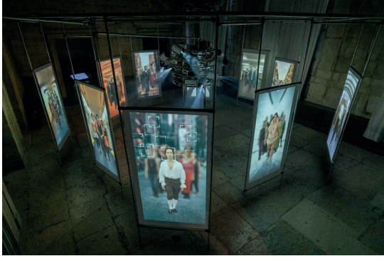
Resim 9. Shu Lea Cheang, 3x3x6 adlı enstalasyon çalışması, Palazzo delle Prigioni, 2019