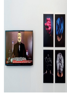
Resim 6. Solda Zach Blas'ın Facial Weaponization Suite projesi, 2012, (e.a: https://www.mcevoyarts.org/news/a-i-fantasies-and-beliefs-with-zach-blas/ )

Sterling Crispin ise, görsel sonuç olarak Blas'a çok benzer tarzda ürettiği Data Masks adlı maske serileri projelerinde, yüz tanıma ve algılama algoritmalarını tersine mühendislikle kullanarak, makinelerin yüzlerimizi görsel olarak nasıl anlayabileceğini gösteren üç boyutlu basılı maskeler ve fotoğraflar üretmiştir. Sanatçının deyimiyle sanatçı bize, makinelerin bizi nasıl gördüğünü göstermeye çalışmaktadır. Ortaya çıkan formlar oldukça ilginç ve kullanıldıkları düşünüldüğünde ise kişileri insan görüntüsünden yabancılaştırıcı görünümde nitelendirilebilirler (Resim 7. 8.).