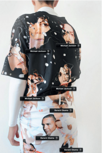
Resim 16. Simone C. Niquille, Realface Glamouflage, (e.a: https://www.theatlantic.com/technology/archive/2013/10/avoid-facial-detection-algorithms-with-a-t-shirt/280253/ )