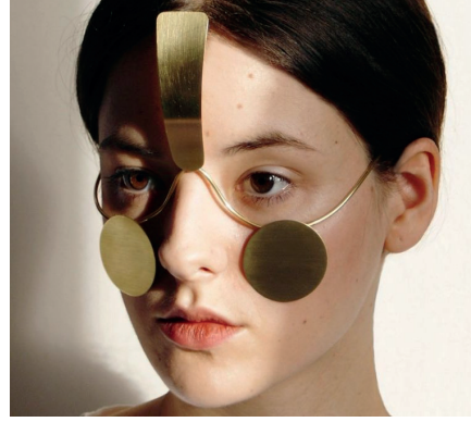
Resim 17. Ewa Nowak, Incognito, (e.a: https://settingmind.com/anti-facial-recognition-mask-created-by-designer-ewa-nowak/ )