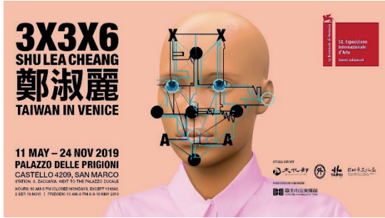
Resim 10. Shu Lea Cheang, 3x3x6 adlı enstalasyon çalışması, Palazzo delle Prigioni, 2019, (e.a: https://universes.art/es/bienal-venecia/2019/taiwan )

Jip van Leeuwenstein Surveillance Exclusion (Gözetimden Hariç Tutma) adını verdiği maskesini, Hollanda'daki Utrecht Sanat Okulu'nda öğreniyken tasarlamıştır. Lens şeklindeki bu maske, kullanıcıyı yüz tanıma algoritmaları tarafından tespit edilemez hale getirirken, insanların yüz ifadelerinin okunmasına izin vermektedir (Resim 11. 12.). Hollandalı bir tasarım öğrencisi olan Jing-cai Liu ise kullanıcının yüzünün üzerine farklı bir yüzün görüntüsünü bindiren Wearable Face Projector (Giyilebilir Yüz Tanıma Projektörü) adını verdiği bir projektör tasarlamıştır. Giyilebilir yüz projektörü olarak tarif edilebilecek olan tasarım bireylerin yüzlerine farklı bir kişinin görüntüsünü yansıtarak kişiye tamamen yeni bir görünüm kazandırmayı böylece yüz tanıma teknolojilerini yanıltmayı amaçlamaktadır (Resim 13.).