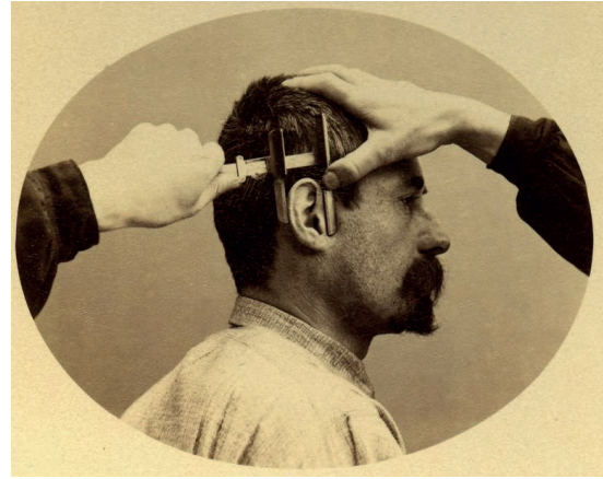
Resim2. Alphonse Bertillon'un çalışmaları kapsamında suçluların bedenleri ölçülendirilerek sınıflandırılıyor.

1960'larda ise; ABD'de, matematikçi ve bilgisayar bilimcisi Woodrow Bledsoe otomatik akıl yürütme ve yapay zekâ araştırmalarıyla Merkezi İstihbarat Teşkilatı'nın ilgisini çekmiştir. Öyle ki; Woodrow, araştırmalarını pazarlamak ve dünyayı hareket ettirecek fikirleri denemek misyonuyla kurdukları Panoramic Research Incorporated projesi kapsamında basitleştirilmiş bir yüz tanıma makinesi fikri ile bir bilgisayara on yüzü tanımayı öğretmeyi amaçlamıştır. Zamanla insan sayı-