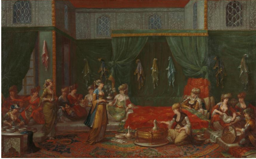
Şekil 1: Jean Baptiste Vanmour, Bir Türk Kadınına Lohusa Ziyareti, Tuval Üzerine Yağlıboya, 55,5x90 cm, 1720-1737, Rijksmuseum Koleksiyonu