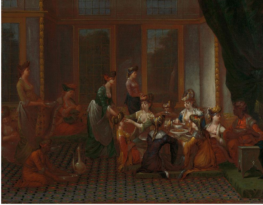
Şekil 6: Jean Baptiste Vanmour, Türk Soylu Kadınların Yemek Ziyafeti, Tuval Üzerine Yağlıboya, 45x58.5 cm. 1720-1737, Amsterdam Rijksmuseum

Tablodaki dikkat çeken bir diğer unsur, kadınlardan birinin, cumbanın köşesine oturup çocuğunu emzirmesidir. Omuzlarına attığı kürklü pelerin ile emzirme eylemini gerçekleştiren kadın, dalgın bakışları ile düşünceli görünmektedir. Tablonun sol tarafında yere oturmuş bir hizmetçi, önünde ibrik ve leğen ile beklemektedir. Yemek öncesi ve sonrası ellerin yıkanması için konulan bu malzemeleri Vanmour, “Bir Türk Kadınına Lohusa Ziyareti” isimli çalışmasında da kullanmıştır.