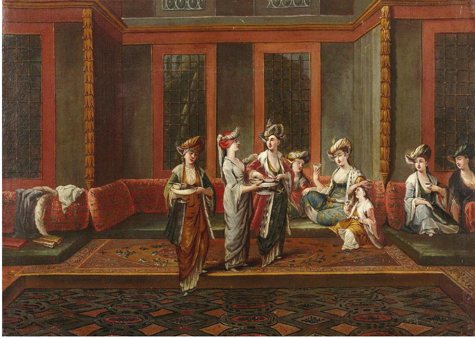
Şekil 5: Jean Baptiste Vanmour, Kahve İçen Kadınlar, Tuval Üzerine Yağlıboya, 59x37 cm. 1700-1750, Pera Museum