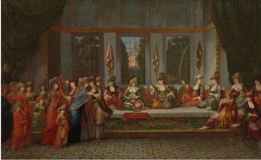
Şekil 2: Jean Baptiste Vanmour, Greek Düğünü, Tuval Üzerine Yağlıboya,

Vanmour'un Türk evlerinin iç mimarisini yansıtan bir diğer çalışması "Greek Düğünü" isimli tablosudur. Bu tabloda da benzer bir mekân kullanılmıştır. İki bölümden oluşan odanın içerisinde, oturma bölümü için ayrılmış bir seki bulunmaktadır. Mekândan yükseltilmiş sekinin bir bölümü dışa doğru çıkıntı yapmaktadır. Sekinin bir bölümünde sedir, diğer bölümünde ise dönemin zevkine uygun olarak işlenmiş bir halı bulunmaktadır. Kompozisyonunda barok motiflerin kullanıldığı halı, "Bir Türk Kadınına Lohusa Ziyareti" isimli tabloda serili olan halı ile büyük benzerlik göstermektedir. Sedirin arkası rahatça oturulması için minderlerle döşenmiştir.