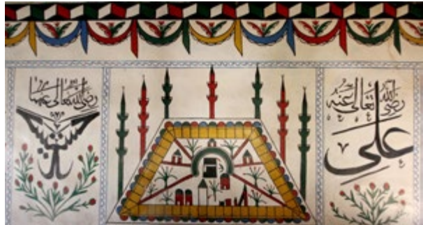
Görsel 11: Batı Duvarı Üst Seviyedeki Kâbe