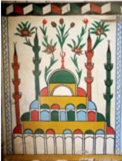
Görsel 10: Batı Duvarı Alt Seviyedeki Cami

Alt seviyede güneyden kuzeye ilk panoda cami tasviri görülmektedir (bkz. Görsel 10). Üç şerefeli dört minaresi ve kubbeli son cemaat yeri bulunan cami, yüksek merkezi bir kubbe ile örtülüdür. Kubbe ve minarelerin aralarını kırmızı gül ve laleler doldurmaktadır. Cami sarı renge, kubbeler ise kırmızı-mavi-yeşil renklere boyanmıştır. Minareler kırmızı ve yeşil renktedir. Dört minare, 12 şerefe ve merkezi kubbe, Edirne Selimiye Camii'nin tasvir edildiğini göstermektedir. İkinci, dördüncü ve yedinci panolarda mavi vazoyu dolduran sarı çiçekler, kırmızı güller ve lalelere yer verilmiştir. Üçüncü ve dördüncü panolar duvarı ikiye ayıran kuşakla diğer panolardan ayrılmıştır. Üçüncü panoda dokuz basamaklı cennet tasviri görülmektedir. Mavi-kırmızı çiçekli yeşil yapraklar, basamaklardan aşağı sarkmaktadır. Dördüncü panoda kalkan boyaların altında kırmızı ve siyaha boyanmış basamaklardan cennet tasvirinin varlığı anlaşılabilir. Beşinci panoda mizan terazisi yer almaktadır. Üstte üç çatallı düzeneğin ucu mızrak şeklinde daralmakta ve iki yandaki kefelere taşımaktadır. Mızrakla güneydeki kefe arasına bir makas yerleştirilmiştir. Boşluklar mavi çiçekler ile kırmızı gül ve lalelerle doldurulmuştur. Altıncı pano S kıvrımlı kırmızı-yeşil-mavi dal ve çiçeklerden oluşmuştur. Sekizinci panoya kırmızı ve yeşil yapraklı dalların oluşturduğu bir kompozisyon işlenmiştir.