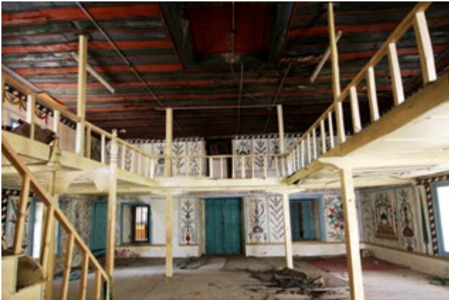
Görsel 12: Kuzey Duvarı

Alt seviyede batıdan doğuya ilk pano çerçeve içine alınmamış ve duvarı yatay olarak ikiye bölen kuşaktaki süsleme tekrar edilmiştir. İkinci panoda kompozisyon, duvarda oluşan geniş çatlağın alçıyla kapatılmış olması sebebiyle görülememektedir. Üçüncü panoda kırmızı ibrikten çıkan narçiçekleri, güller ve laleler bulunmaktadır. Kapının doğusundaki dördüncü panoda vazodan çıkan çiçek motifleri işlenmiştir. Beşinci panoda kırmızı-yeşil yapraklı mavi yapraklı dalların oluşturduğu bir süsleme görülmektedir. Pencerenin doğusundaki altıncı panoda daire içine alınmış kırmızı-mavi-yeşil renkli çarkifelek, yine aynı renklere sahip on iki kollu bir yıldızla çevrelenmiştir (bkz. Görsel 12).