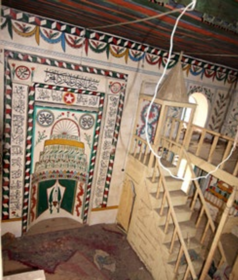
Görsel 15: Mihrap ve Minber

Üst seviyede, birinci panoda köşeleri gül demetleriyle doldurulmuş "Muhammed", üçüncü panoda "Allah" yazısı okunmaktadır. İkinci panoda pencerenin üst kısmı gül demetleriyle doldurulmuş, yanına da bir selvi ağacı yapılmıştır. Minberin köşk kısmındaki duvarda kırmızı-yeşil yaprakların oluşturduğu çelenk motifli dördüncü pano görülmektedir. Beşinci panoda S kıvrımlı dallar ve çiçeklerden oluşan süsleme bulunmaktadır. Altıncı panoda pencerenin üst kısmı gül demetleriyle doldurulmuştur. Yedinci panoda kırmızı-yeşil yapraklı düz bir dal motifi görülmektedir.