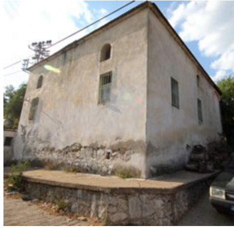
Görşel 2: Güneydoğudan Genel Görünüş

Yapının inşa tarihini veren herhangi bir kitabesi bulunmamaktadır. Caminin ek mekânının giriş kapısı üzerinde dayanağı bilinmeyen 1811 tarihli bir tabela görülmektedir. Caminin avlu duvarının kuzeydoğu köşesinde Osmanlıca yazılmış bir mezar taşı bulunmaktadır (bkz. Görşel 3).