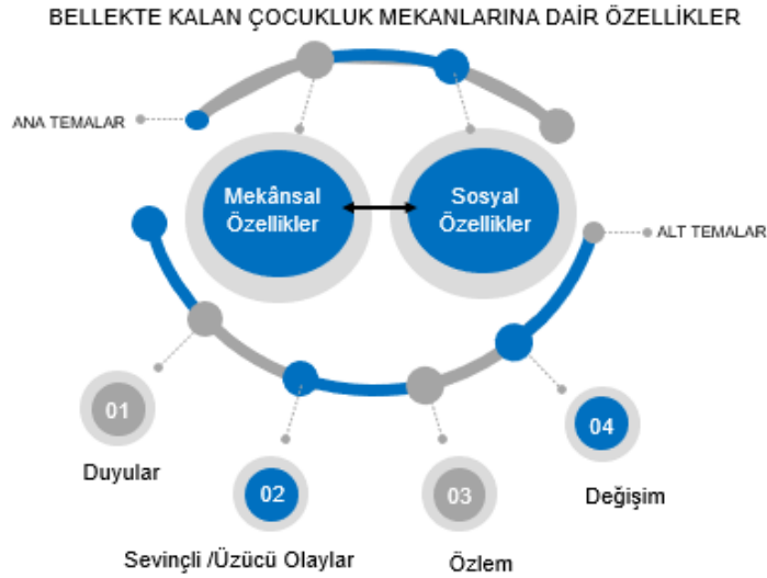
Şekil 1. Çalışmada kullanılan ana ve alt temalar (Yazar tarafından oluşturulmuştur)