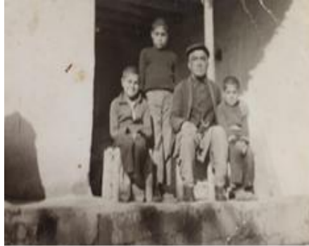
F.Ç.- 50/ Ankara