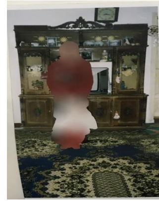
G.S.- 53/ Adana (Vitrin)