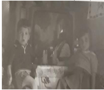
M.Ş.-56/ İzmir (T.V.)