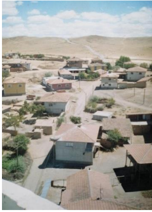
C.E.- 51 / Çankırı (1-2 katlı kiremit Evler)

Şekil 2. Bazı katılımcılara ait görseller