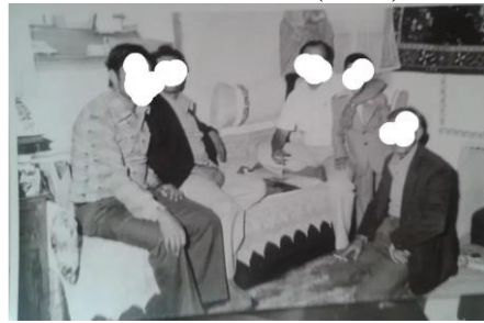
G.S.- 53/ Adana (Dantelli Somya)