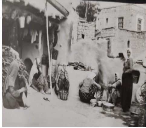
B.G.-82 / Konya (Toprak damlı, avlulu, kerpiç duvarlı evler)