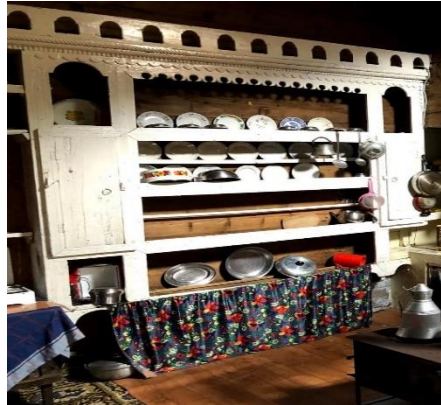
A.K.- 72/ Trabzon (Terek)