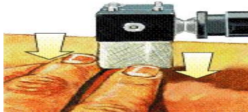
Resim 3: Çivi Dibi Bölgesine Masaj Uygulama