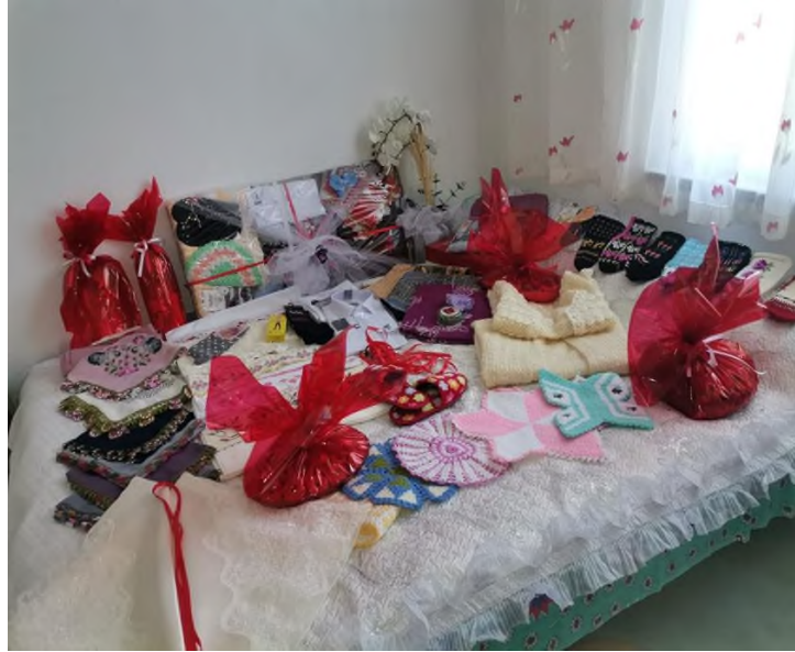
Şekil 2: Gelin bohçasının içinde yer alan çeyizlikler