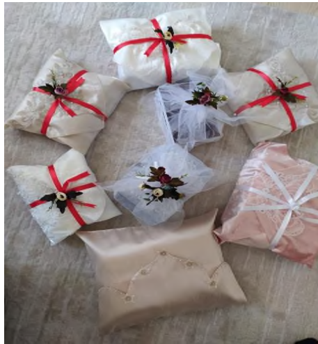
Şekil 1: Gelin Bohçası

Günümüzde küreselleşmenin getirdiği tekdüzelik ve estetik kaygısı sebebiyle somut olmayan kültürel mirasın bir parçası olan düğünlere dair gelenek ve görenekler zaman içerisinde modern yaşamın standartlarına ayak uydurmuştur. Bunlardan biri bohça verme/alma geleneğidir. Ailelerin hediyeleşme yoluyla akrabalık bağının kuvvetlenmesi amaçlanan bohça geleneği hem içerik hem de şekli yönlerden değişikliğe uğramıştır. El işleme, göz nuru bohçaların yerini valizler (bknz. Fotoğraf 3) alırken içerisindeki eşya ve hediyeler de sanayi işi hazır ürünlere dönüşmüştür.