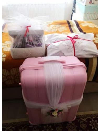
Şekil 4:Gelin bohçası (Bavul)