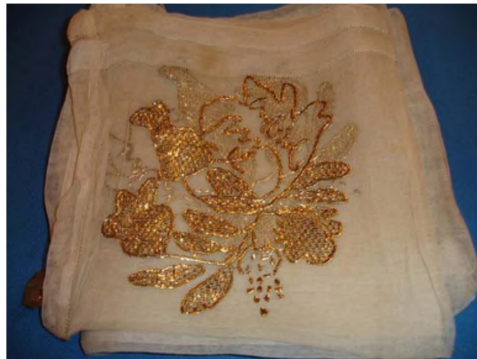
Şekil 5: Çevre Örneği

Kaynak:: Nevşehir Müzesi (Atila, 2009: 46)