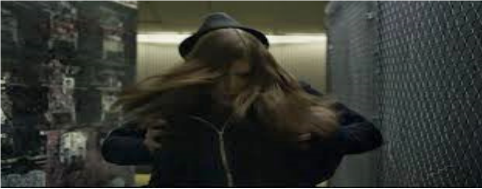
Tablo 4: Zoe Barnes’in öldürülmesi ile gösterilen