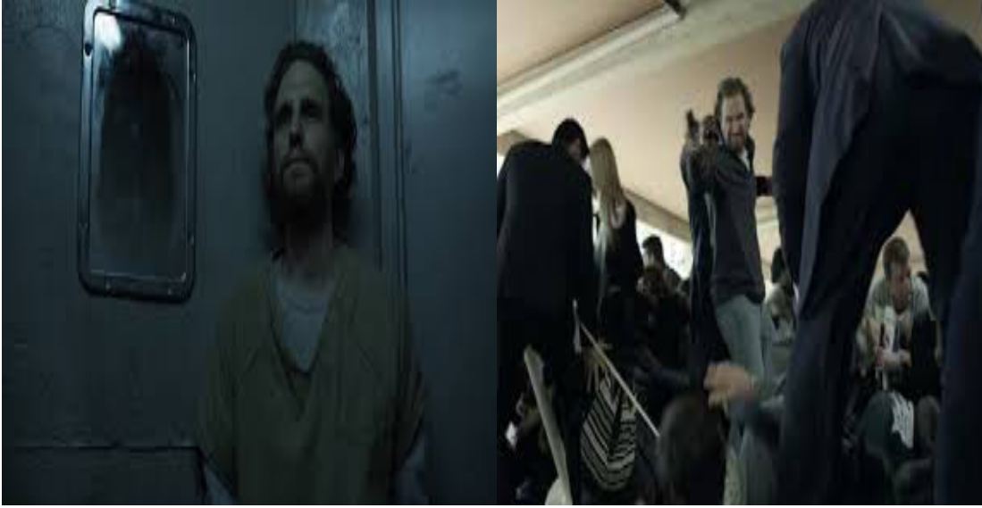
Tablo 6: Lucas Goodwin’in cezaevi ve suikast sahnelerinde göstergelenen