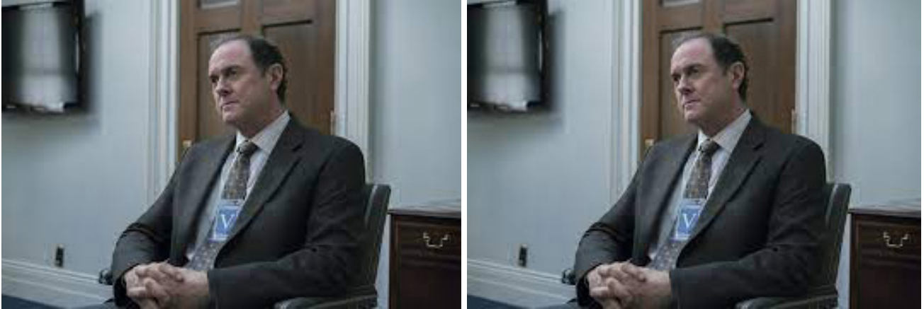
Tablo 7: Tom Hammerschmitt'in Genel Yayın Yönetmenliği ve Beyaz Saray'da medyanın denetleme ve dengeleme temsili sahnelerinde gösterilen

Fotoğraf 7: Geleneksel Medya Temsilinde Tom Hammerschmitt ve Beyaz Saray'da Frank Underwood Makamında Diyalog Sahnesi