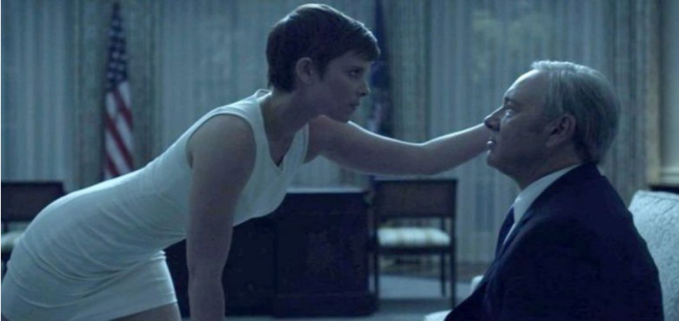
Tablo 3: Zoe Barnes'in Frank Underwood'a Oval Ofis'te yaklaşımı ile göstergelenen