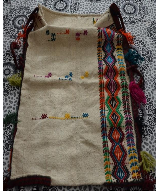
Resim 21-22. S. Ataş Evinde Bulunan Yüklük Zabire Çuvalı (C. Polat)

23-24 No.lu örnek görsel dokuma çuval sık motifli ve seyrek motif tekniğinde dokunmuş, tek parçadan birleştirilmiştir. Süsleme bakımından iki bölüme ayrılan çuvalın bir bölümü çuval ağız ve taban arasında bant şeklinde motiflerle bezenilirken diğer bölümü sade, düzensiz aralıklarla çarpı, bukağı, çengel motifleriyle süslenmiştir. Motif renklerinde mavi, kırmızı yeşil, turuncu, mor pembe tercih edilen çuvalda; atkı ve çözgüde pamuk, motiflerde yün kullanılmıştır. 65x115 cm şeklinde ölçülendirilen çuvalın; bant bölümünde akrep motifleri bileşik halde üst üste yerleştirilerek, kurt izi motifleriyle bordür oluşturulmuştur.