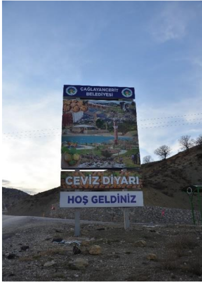
Resim 1. Çağlayancerit İlçesi Şehir Tabelası

Çağlayancerit'in ilk kuruluş yeri günümüzde "pamuk" olarak adlandırılan yerdir. İlçenin adını Orta Asya kökenli Cerid Aşiretinden almıştır. İlçenin isminin içerisinde geçen çağlayan kelimesinin yöredeki su yoğunluğundan geldiği düşünülmektedir. Elde edilen mozaik buluntular nedeniyle yerleşimin M.S. 3-4. yüzyıla dayandığı bilinmektedir. Çağlayancerit, konumu itibarıyla bölgede ticaret yol bağlantılarını hâkim bir yerdedir (www.kahramanmaraş.gov.tr). Çağlayancerit engebeli ve dağlık bir alanda kurulu bir ilçe olması ve tarıma elverişli arazilerin bulunmaması nedeniyle halkın büyük bir kısmı (%73.6) hayvancılıkla uğraşmaktadır. Dolayısıyla ilçede dokuma yöre halkı için geçmiş dönemlerde geçimin önemli bir bölümünü oluşturmuştur (Yılmaz, 1992, s. 4).