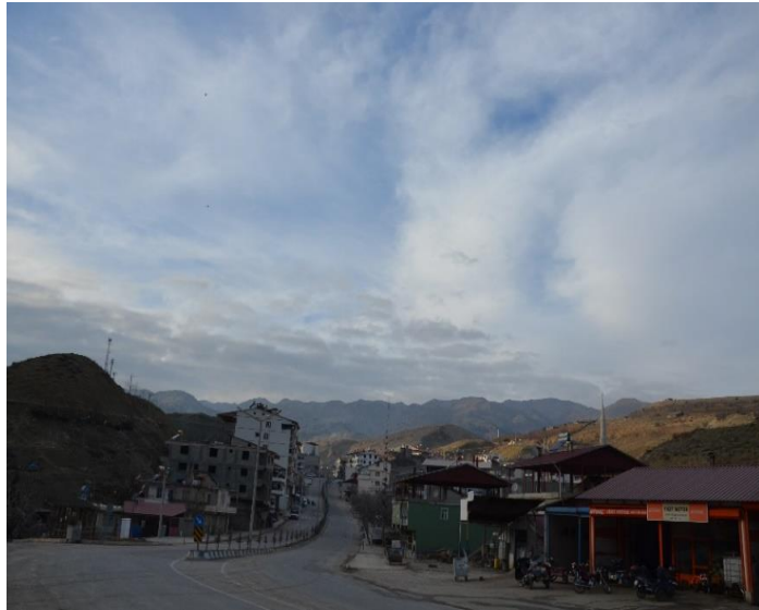
Resim 2. Çağlayancerit İlçesi Genel Görünüm (C.Polat)

Kahramanmaraş iline bağlı Çağlayancerit ilçesi; önemli dokumacılık merkezlerinden biridir. Geçmişte yaylacılık kültüründen dolayı dokumacılık ön plandadır. Ancak yörenin çeyiz geleneğinde kız ve erkek tarafının fazla sayıda yün döşek ve yorganı çeyizlik olarak vermelerinden dolayı yünler daha çok yatak yapımında kullanılmış, bu nedenle dokumalarda pamuk tercih edilmiştir. Günümüzde ilçe genelinde dokumacılık kaybolma tehlikesiyle karşı karşıyadır. İlçe genelinde Halk eğitim merkezine bağlı sadece 2 adet halı dokuma atölyesi bulunmaktadır (Resim 3).