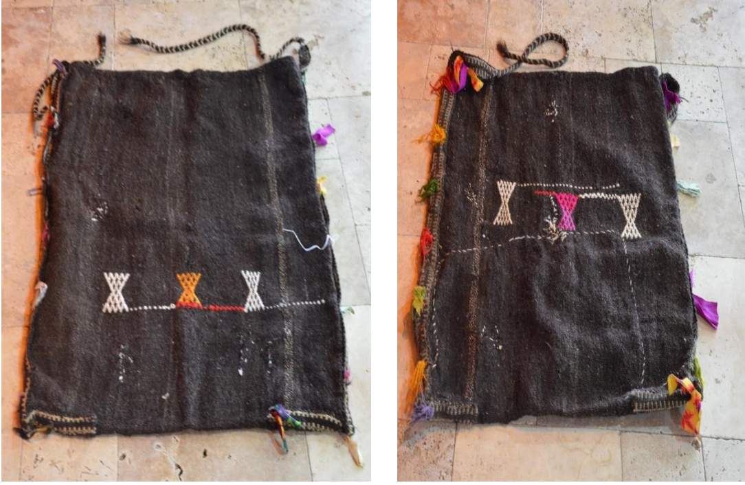
Resim 27-28. R. Üstün Evinde Bulunan Yarım Zabire Çuvalı

Görsel 29-30 No.lu görsel örnekte bulunan seyrek motif tekniğinde dokunan çuvalın ön ve arka kısmı iki renkten oluşmaktadır. 60x90 cm'lik bir ölçüye sahip olan çuvalın çözgüsü pamuk, atkısı keçi kılı, motif ise pamuk ipe dokunmuştur. Dokuma iki parça şeklinde yapılmış, dokunulan parçalar sonradan dikilmiştir. Kenar dikişlerini kapatma ve mukavemetini artırmak için şerit şeklindeki dokuma ile birleştirilmiştir. Şeritin uç kısımları el örgü tekniğiyle örülmüştür. Süsleme amaçlı şeritin üzerine kesilmiş renkli kumaşlarla püskül yapılmış, çuvalın ortasına gelecek şekilde iki adet beyaz renkli göz motifi yerleştirilmiştir.