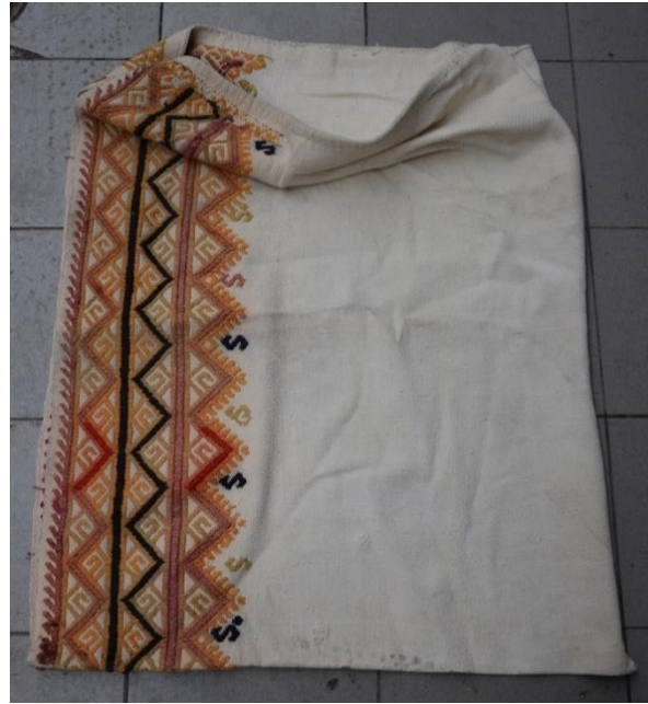
Resim 17-18. N. Erçetin Evinde Bulunan Yüklük Zabire Çuvalı (C. Polat)

19-20 No.lu örnek görsel çuval cicim tekniğinde dokunulmuş, tek parça halindeki çuval ikiye katlanarak birleştirilmiş, çuvalın çözgüsü; pamuk, atkı; pamuk ve keçi kılı karışımı, motiflerde ise yün ip kullanılmıştır. Çuval zemini beyaz ve siyah, motif renklerinde ise mavimsi, kırmızı, pembe, siyah, turuncu, sarı ve mor kullanılmıştır. 60x110 cm ile ölçülendirilen çuvalın bir bölümüne göz ve çengel motifleri serpiştirilmiş, diğer bölümünde ise kurt izi motif bordür olarak kullanılarak, orta motif özgün çalışıma ile süslenmiştir.