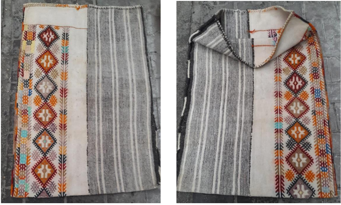
Resim 11-12. D. Çelik Evinde Bulunan Yüklük Zabire Çuvalı (C.Polat)

13-14. No.lu görselin bulunduğu zili tekniğinde dokunan çuval iki parça (şak ) halinde dokunulmuş, parçalar iğne yardımıyla dikilerek birleştirilmiş, atkı ve çözgüde pamuk, motifte ise yün kullanılmıştır. 60x110 cm. ölçüye sahip çuvalın, bir tarafı düz bir dokuma olup tek renk olarak beyaz, diğer tarafta ise, siyah, kırmızı turuncu, mavi, pembe, yeşil motif rengi olarak tercih edilmiştir. Kullanılan motifler üst üste yerleştirilmiş, çuval ağızıyla tabanı arasına boydan şerit şeklinde pıtrak motifi sıralanmıştır. Pıtrak motifinin her iki tarafına bordür şeklinde hayat ağacı motifi konmuş, hayat ağacı motifinin içerisine zik zak şeklinde suyolu motifi yerleştirilmiştir. Çuvalın ağız kısmı ise dokuma motiflerinde kullanılan renklerle dikiş teknikleri uygulanarak dikilmiştir.