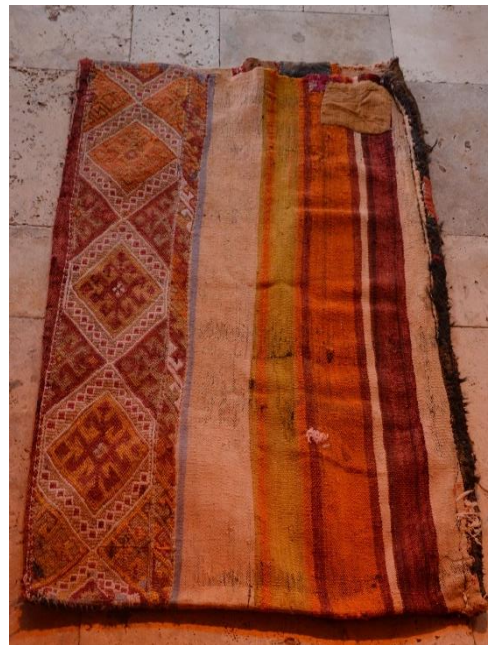
Resim 25-26. Çağlayancerit Beld. Kültür Merkezinde Bulunan Yüklük Büyük Zabire Çuvalı

27-28 No.lu görsel örnek dokuma çuval sık motifli cicim tekniğinde dokunmuş, çözgüde; pamuk, atkıda keçi kılı ve pamuk kullanılmış, motifler pamuk ipe dokunmuştur. Motif renkleri beyaz pembe ve turuncudur. 60x90 cm şeklinde ebatlandırılan çuval yan birleştirme dikişlerini, ağız bağı olarak kullanılmak üzere kolan ile kapatılmıştır. Kolanlar üzerine süslemek amaçlı kesilmiş atık kumaşları değerlendirilerek püskül yapılmıştır. Dokuma çuvalın üzerine özgün çalışılmış üç adet beyaz, mor ve turuncu renklerinden oluşan göz motifi bulunmaktadır.