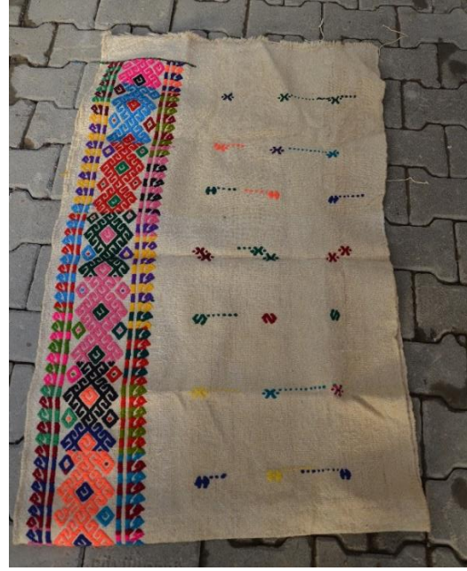
Resim 23-24. R. Üstün Evinde Bulunan Büyük Boy Yüklük Zabire Çuvalı (C.Polat)

25-26 No.lu görsel dokuma çuval örneği cicim tekniğinde dokunmuş, zemin renginde siyah, turuncu, sarı, mavi ve beyaz, motif renginde ise kırmızı, turuncu ve kahverengileri tercih edilmiştir. 60x110 cm şeklinde ölçülendirilen çuvalın çözgüsü; pamuk, atkısı yün ve pamuk şeklinde dokunmuştur. Çuvalın bir bölümü boylamasına şerit çizgilerle doldurulurken, diğer bölümü ise motiflerle bezenmiştir. Süsleme olarak; dörtgen ve çapraz çizgiler içerisine akrep motifleri yerleştirilerek dokuma yapılmış, iki parçadan oluşan çuval, iki parça birleştirilerek dikilmiştir. Akrep ve yılan gibi sürüngenler Anadolu'da yer ve toprakla birlikte düşünülmüş, kötülüğün sembolü olarak ele alınmıştır. Akrep motifi; kötülüklerle karşı korunma düşüncesiyle kullanılmaktadır (Arıkan vd., 2017, s. 96).