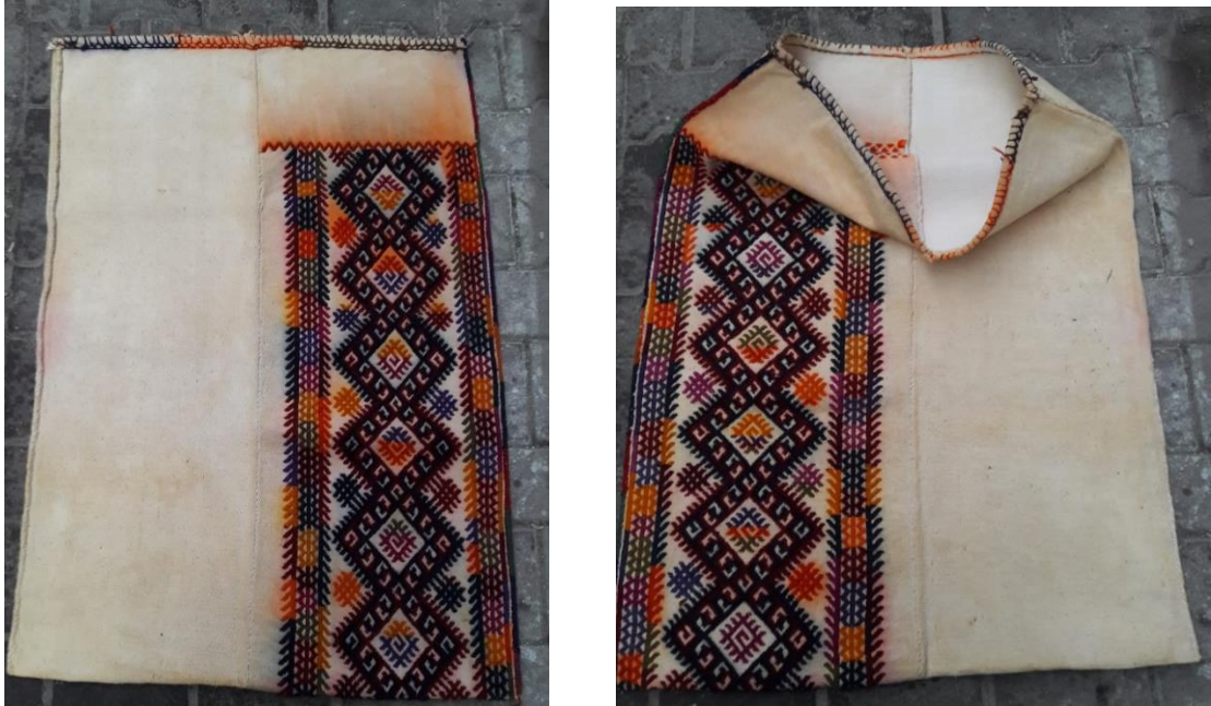
Resim 13-14. H. Gümbürdek Evinde Bulunan Yüklük Zabire Çuvalı (C. Polat)

13-14. No.lu görselin bulunduğu zili tekniğinde dokunan çuval iki parça (şak ) halinde dokunulmuş, parçalar iğne yardımıyla dikilerek birleştirilmiş, atkı ve çözgüde pamuk, motifte ise yün kullanılmıştır. 60x110 cm. ölçüye sahip çuvalın, bir tarafı düz bir dokuma olup tek renk olarak beyaz, diğer tarafta ise, siyah, kırmızı turuncu, mavi, pembe, yeşil motif rengi olarak tercih edilmiştir. Kullanılan motifler üst üste yerleştirilmiş, çuval ağızıyla tabanı arasına boydan şerit şeklinde pıtrak motifi sıralanmıştır. Pıtrak motifinin her iki tarafına bordür şeklinde hayat ağacı motifi konmuş, hayat ağacı motifinin içerisine zik zak şeklinde suyolu motifi yerleştirilmiştir. Çuvalın ağız kısmı ise dokuma motiflerinde kullanılan renklerle dikiş teknikleri uygulanarak dikilmiştir.