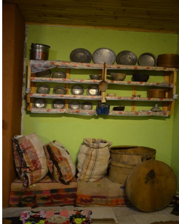
Resim 4. Çağlayancerit Beld. Kültür Mer. Zahirelik Odası (C.Polat)

Kahramanmaraş'ın küçük bir ilçesi olan Çağlayancerit nüfus yoğunluğunun büyük bölümünün kırsal kesimde yaşadığı bir ilçedir. Geçmiş yıllarda engebeli arazi şartları ve iklim özellikleri nedeniyle insanlar yük taşıma işlerini hayvanlar vasıtasıyla yapmışlar, taşımanın temel aracı da çuvallar olmuştur. Çağlayancerit zahire çuvalları; geçici süreliğine tahıl taşımak için dokunanlar ve uzun süreli tahıl deposu amacıyla dokunanlar olmak üzere ikiye ayrılmaktadır. Bir yerden başka yere tahıl ürünlerinin hayvanlar vasıtasıyla taşınması ve bir ambara boşaltılması sürecinde genellikle pamuk dokuma çuvallar kullanılmaktadır. Bunun nedeni yemek yapımında kullanılan tahılların içerisinde çuvallardan kopan keçi kılı ya da koyun yününün kalmasının önüne geçilmesidir (KK 1). Zahire çuvalları; ayrıca yaz döneminde kışa hazırlık amacıyla evlerin mutfak bölümlerinde bulgur, buğday, nohut, fasulye gibi gıda ürünlerinin zararlı haşerelere karşı korunması amacıyla da kullanılmaktadır (Resim 4).