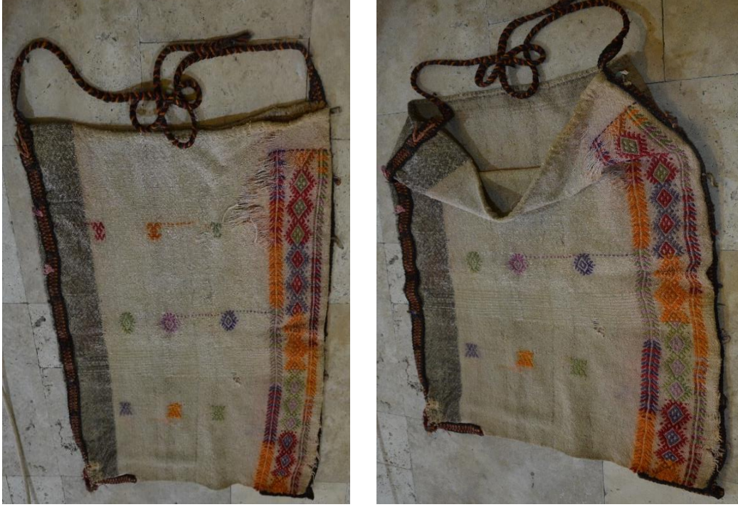
Resim 9-10. Çağlayancerit Beld. Kültür Merkezinde Bulunan Yüklük Zabire Çuvalı (C. Polat)

Örnek 9-10 No.lu çuval görselinin sağ bölümünde yer alan şeritte sık motifli cicim, sol alanda ise seyrek motifli cicim tekniği uygulanmıştır. Çuvalın kaç yıllık olduğu tespit edilememiş; ancak edinilen bilgiler dâhilinde çuvalın en az 30 yıllık olduğu üzerinde durulmuştur. Dokunulan çuvalın kolan üzerine konulmuş motif özgün olarak çalışılmış sıralı “x” şeklindedir. Çuval görselinde; pıtrak motiflerinin içerisine göz motifleri yerleştirilmiş, pıtrak motiflerinin her iki etrafına hayat ağacı formunda şekil verilmiştir. Ayrıca çuvalın boşta kalan diğer kısımlarına göz, pıtrak ve özgün çalışılmış koç motifi serpiştirilerek yerleştirilmiştir.