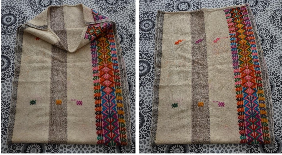
Resim 19-20. S. Ataş Evinde Bulunan Yüklük Zabire Çuvalı (C.Polat)

21-22 No.lu görsel çuval, sık motifli ve seyrek motifli cicim tekniğinde tek parça halinde dokunulmuş, çözgü ve atkıda pamuk, motiflerde ise yün kullanılmıştır. Çuval 60x110 cm'lik bir ölçüye sahiptir. Dokuma kenarlarına şerit ve püsküller kullanılarak süslemeler yapılmış, kenar kısımlarına yapılan şeritler her iki tarafta uzun bırakılarak çuvalın ağız kısmının kapatılması düşünülmüştür. Çuvalın zemini beyaz renkle dokunmuş, bant dışında kalan alana mavi, sarı mor, turuncu renklerinde pıtrak ve çengel motifleri yerleştirilmiştir. Dokumanın diğer tarafına ise üst üste gelecek şekilde birleşik pıtrak motifi tercih edilmiş, pıtrak motifinin her iki tarafına boydan hayat ağacı motifi yerleştirilerek bordür oluşturulmuştur.