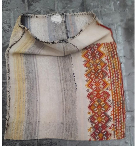
Resim 15-16. H. Gümbürdek Evinde Bulunan Yüklük Zabire Çuvalı

17-18 No.lu örnek görsel çuval üzerinde ana renk beyaz, motif renkleri olarak beyaz, kırmızı, siyah, turuncu kullanılmış, cicim tekniğinde dokunan çuval tek parça halinde dokunulmuştur. Atkı ve çözgü pamuk, motif ise yün iptir. 60x110 cm'lik bir ölçüye sahip çuval; çuvaldız iğnesi ile dikilerek birleştirilmiş, dokumada hayat ağacı motif, pıtrak motif ve kurt izi motif bir arada kullanılarak özgün bir çalışma yapılmıştır. Pıtrak motifinin kenar kısmına çengel motifleri ile bezenmiş, çuvalın ağız kısmı katlanmış ve dikiş teknikleri uygulanmıştır.