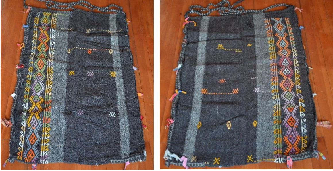
Resim 31-32. D. Deliktaş Evinde Bulunan Kıl Dokuma Zabire Çuvalı (C. Polat)

kısmı dokumanın başlama ve bitiş noktası olduğundan sökülmemesi için bükülerek dikiş yapılmıştır. Dokumanın zemini açık ve koyu gri, motif renkleri ise; mavi, kırmızı, yeşil, turuncu, beyazdır. Motifli bant alanı dışında kalan bölüme birleşim, çarpı ve göz motifi serpiştirilmiştir. Çuvalın bir bölümü ön ve arka olmak üzere boydan boya pıtrak motifleri yerleştirilmiştir. Pıtrak motiflerinin her iki tarafına kurt izi motiflerle bordür yerleştirilerek kompozisyon oluşturulmuştur.