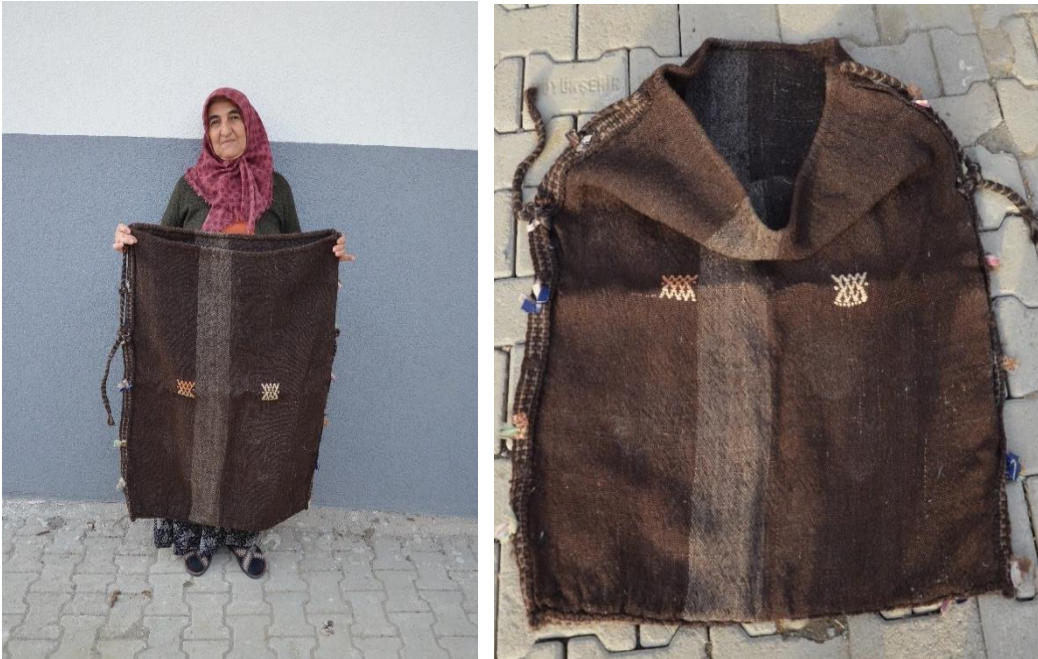
Resim 29-30. R. Üstün Evinde Bulunan Orta Boy Zabire Çuvalı (C. Polat)

Görsel 29-30 No.lu görsel örnekte bulunan seyrek motif tekniğinde dokunan çuvalın ön ve arka kısmı iki renkten oluşmaktadır. 60x90 cm'lik bir ölçüye sahip olan çuvalın çözgüsü pamuk, atkısı keçi kılı, motif ise pamuk ipe dokunmuştur. Dokuma iki parça şeklinde yapılmış, dokunulan parçalar sonradan dikilmiştir. Kenar dikişlerini kapatma ve mukavemetini artırmak için şerit şeklindeki dokuma ile birleştirilmiştir. Şeritin uç kısımları el örgü tekniğiyle örülmüştür. Süsleme amaçlı şeritin üzerine kesilmiş renkli kumaşlarla püskül yapılmış, çuvalın ortasına gelecek şekilde iki adet beyaz renkli göz motifi yerleştirilmiştir.