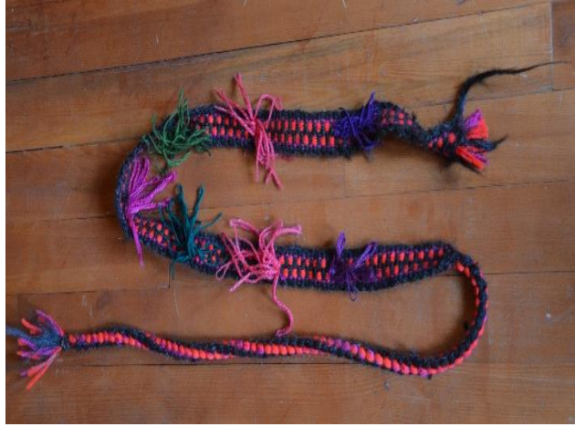
Resim 8. Zabire Çuvallarında Kullanılan Kolan Askılık-Bağcık (C. Polat)

Çuvalların çözgü ve atkı iplerinde pamuk, yün, keçi kılı, motif oluşturulan ip ise yünle yapılmıştır. Çuvallarda sık motifli cicim ve seyrek motifli cicim dokuma teknikleri uygulanmıştır. Dokuma çuvallar yolluk şeklinde dokunulmuş sonrasında boydan ikiye katlanarak kenar bölümleri iplerle dikilmiştir. Kenar dikişleri kapatmak amacı ile ayrıca renkli iplerle kolanlar kullanılmış ve dikişlerin üzerini kapatacak şekilde birleştirilmiştir. Çuvalların ağzının büzülerek kapatılması için kolanların her iki ucuna aynı renkte iplerle örgü örülerek bağcıklar yapılmıştır (Resim 8).