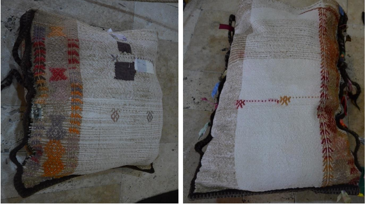
Resim 6-7. Çağlayancerit Beld. Kült Merkezinde Bulunan Yarım Zabire Çuvalları

Çuvalların çözgü ve atkı iplerinde pamuk, yün, keçi kılı, motif oluşturulan ip ise yünle yapılmıştır. Çuvallarda sık motifli cicim ve seyrek motifli cicim dokuma teknikleri uygulanmıştır. Dokuma çuvallar yolluk şeklinde dokunulmuş sonrasında boydan ikiye katlanarak kenar bölümleri iplerle dikilmiştir. Kenar dikişleri kapatmak amacı ile ayrıca renkli iplerle kolanlar kullanılmış ve dikişlerin üzerini kapatacak şekilde birleştirilmiştir. Çuvalların ağzının büzülerek kapatılması için kolanların her iki ucuna aynı renkte iplerle örgü örülerek bağcıklar yapılmıştır (Resim 8).