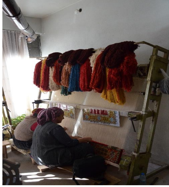
Resim 3. Çağlayancerit Halı Dokuma Kursu (C.Polat)

Kahramanmaraş'ın küçük bir ilçesi olan Çağlayancerit nüfus yoğunluğunun büyük bölümünün kırsal kesimde yaşadığı bir ilçedir. Geçmiş yıllarda engebeli arazi şartları ve iklim özellikleri nedeniyle insanlar yük taşıma işlerini hayvanlar vasıtasıyla yapmışlar, taşımanın temel aracı da çuvallar olmuştur. Çağlayancerit zahire çuvalları; geçici süreliğine tahıl taşımak için dokunanlar ve uzun süreli tahıl deposu amacıyla dokunanlar olmak üzere ikiye ayrılmaktadır. Bir yerden başka yere tahıl ürünlerinin hayvanlar vasıtasıyla taşınması ve bir ambara boşaltılması sürecinde genellikle pamuk dokuma çuvallar kullanılmaktadır. Bunun nedeni yemek yapımında kullanılan tahılların içerisinde çuvallardan kopan keçi kılı ya da koyun yününün kalmasının önüne geçilmesidir (KK 1). Zahire çuvalları; ayrıca yaz döneminde kışa hazırlık amacıyla evlerin mutfak bölümlerinde bulgur, buğday, nohut, fasulye gibi gıda ürünlerinin zararlı haşerelere karşı korunması amacıyla da kullanılmaktadır (Resim 4).