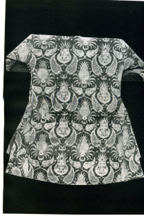
Şekil 2 Kısa kollu kaftan (Öz 1946)

Kemha tezgâhlarının erken tarihlerde Bursa ve Amasya’da olduğu bilinmektedir. Daha sonraları İstanbul’da saray tezgâhlarında da dokunmuştur. Saraya ait bir dokuma atölyesi planında kadife ve kemha bölümleri bulunmaktadır. Osmanlı kemhaları çok ünlü olduğundan dünya müzelerinde ve kilise hazinelerinde çok sayıda örnekleri bulunmaktadır.