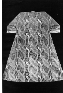
Şekil 3 Kısa kollu içi kürklü kaftan (Öz 1946)

Kısa kollu bu kaftan II. Bayezid’e aittir (Şekil 2). On beşinci asra ait bu kaftanlar; bize, Kanunname-i Bursa’nın yirmi beş yıl önce bahsedilen kumaşlardan ancak birer örnektir (Öz, 1946).