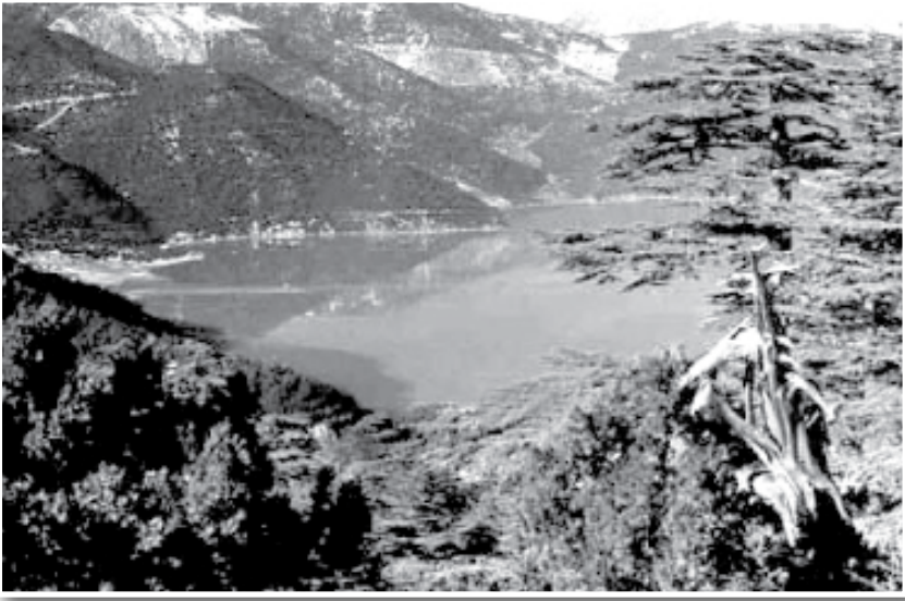
Fotoğraf 20 Avlan Gölü'nün taşkınlardan arta kalan kısmı... Olaylardan 35 yıl sonra yeniden...