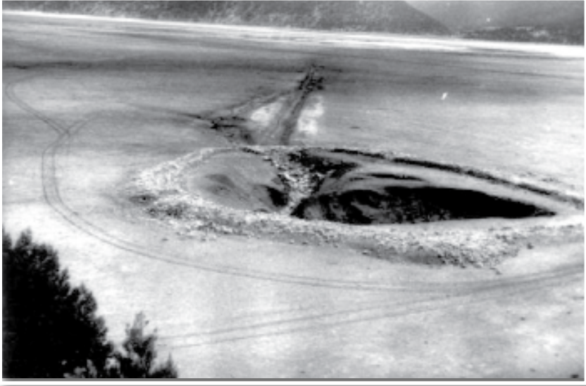
Fotoğraf 8 Kurutulan Avlan Gölü'nün suların tahliye eden yarılarından biri