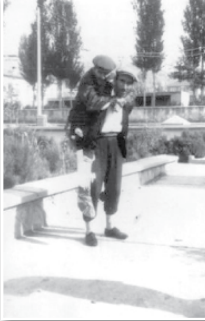
Fotoğraf 9 Elmalı'da babasının sırtında hastaneye getiren bir köylü