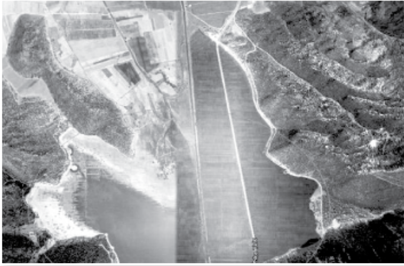
Fotoğraf 19 Avlan Gölü'nün kurutulmasından sonra tam ortasından geçirilen otoyol bugün Elmalı'yı Finike'ye bağlayan karayolu olarak da biliniyor