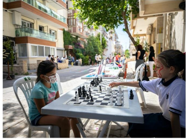
Nihat Dağdelen Sokak Oyun Etkinliği

Şekil 6. Karşıyaka Belediyesi tarafından düzenlenen oyun sokakları (play streets) örnekleri (Kaynak: Karşıyaka Belediyesi Kentsel Tasarım Şube Müdürlüğü).