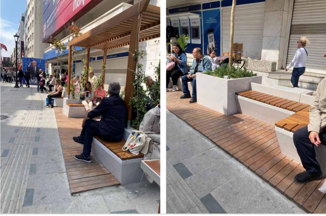
Şekil 2. Karşıyaka Belediyesi tarafından yapılan Karşıyaka Çarşı'daki parklet.

Karşıyaka Çarşı'daki parklet için yapılan gözlemler sonucunda, parkletin çarşının girişine konumlandırılmış olduğunu, hem çarşı boyunca ilerleyen sokaktan hem de bu sokağın kesişimindeki ana caddeden rahatlıkla görünür bir konumda olduğu saptanmıştır. Öte yandan parklet, Karşıyaka Vapur İskelesi'nin tam karşısında olduğu için iskeleden çıkış yapanlar tarafından da rahatlıkla görülebilecek konumdadır. Parkletin etrafında durağan aktivitelerin yapılmasını destekleyecek yiyecek-içecek satan işletmeler oldukça fazla sayıda bulunmaktadır. Dört farklı günde öğleden sonra 17:00 ve 18:00 saatleri arasında parklete yapılan ziyaretlerde, parkletin çok büyük oranda dolu olduğu saptanmıştır.