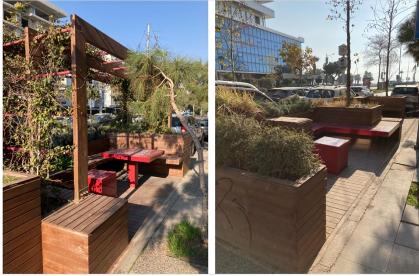
Şekil 5. Karşıyaka ilçesi Girne Bulvarı üzerinde İzmir Büyükşehir Belediyesi tarafından yapılmış, karşı karşıya konumlanmış iki parklet.

Karşıyaka Belediyesi Sürdürülebilirlik Durum Analiz Raporu'nda (2022) da belediyenin Birleşmiş Milletler Sürdürülebilir Kalkınma amaçları doğrultusunda dış paydaşlarla ortaklıklar kurmasının önemi vurgulanmaktadır. Bu tutum dolaylı olarak taktiksel şehirciliğin uygulanabilmesi için önemli bir adım olabilir. Her ne kadar bu belediyenin doğrudan taktiksel şehircilik maksatlı kuracağı ortaklıkları işaret etmese de yeni oluşturulacak projelerde dışarıdan ortaklıklara açık olduğunu gösterdiği için kayda değerdir. Parklet ve yaya plazaları gibi taktiksel şehircilik uygulamalarına bakıldığında pek çoğunda belediyeler diğer kamu, özel, ya da toplumsal gruplarla işbirliği içine girmektedir.