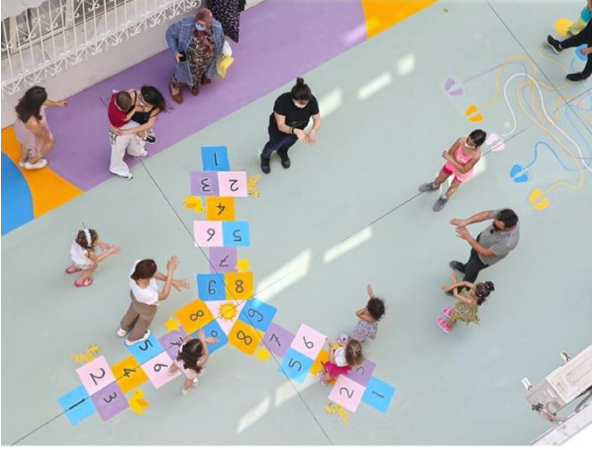
Alaybey Oyun Sokağı