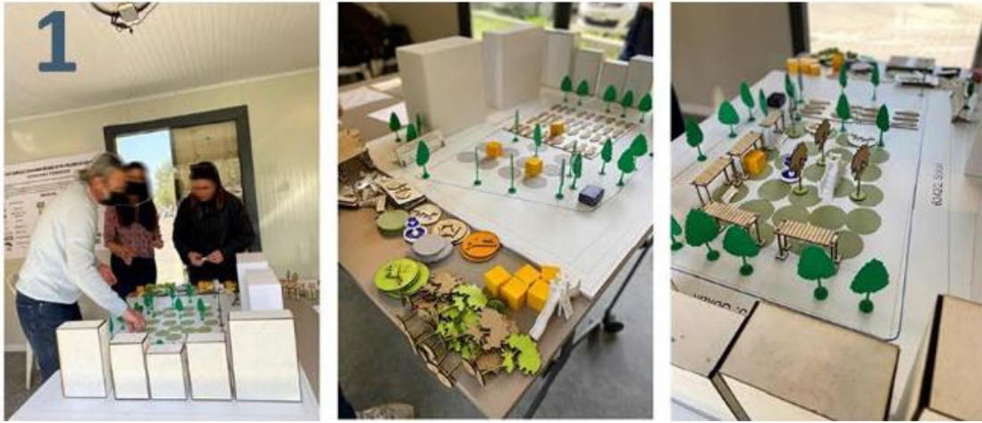
Şekil 3. Atakent parklet ve yaya plazasını içeren alan için Vatandaş Tasarım Bilimi (VTB) yöntemi ile yapılan halkın tasarıma katılımını sağlayan Konteyner içindeki atölye (Kaynak: Özden ve Velibeyoğlu, 2023).

Atakent'teki parkletler biraz farklı, (Karşıyaka Çarşı'daki parkletin katılım süreci ile karşılaştırıldığında) burada tamamen vatandaş katılımıyla ilerlemiş bir tasarım süreci var. İlk önce proje alanında bir konteyner kuruldu. Konteynerde maket olarak alanın ölçeklendirilmiş bir maketini yaptık. İki hafta boyunca o konteyner orada kaldı ve atölye olarak kullanıldı. Kaldığı sürece bölgede yaşayan insanlar orayı nasıl tasarlamak istiyorlarsa maket üstünde o şekilde tasarladılar. Yaklaşık 200'e yakın katılım oldu. Hepsinin maket üzerindeki katkısı fotoğraflandı ve GIS veri tabanında üst üste çakıştırılarak analiz edildi, günün sonunda hangi objeler en çok mekânsal olarak nerelerde talep edildiyse, iki adet alternatif proje çıkardı. Sonuç olarak çıkan iki proje, proje alanında oy sandığı kurularak oylamaya çıktı. O sandık da alanda bir süre kaldı ve seçilen proje de asıldı. İnsanlara da istedikleri şeylerin projede olduğunu göstermek amaçlı bir organizasyon yaptık. Oylamadan da çıkan proje bizim uygulama projemiz haline geldi. Yani başından sonuna en yüksek katılımın sağlandığı örnek bir proje oldu diyebilirim. Yani biraz oyunlaştırma dediğimiz bir durum oldu katılım sürecinde. Bunun dijital örnekleri de varmış ama ne yazık ki bizim imkânımız yoktu o yüzden maket kullandık.