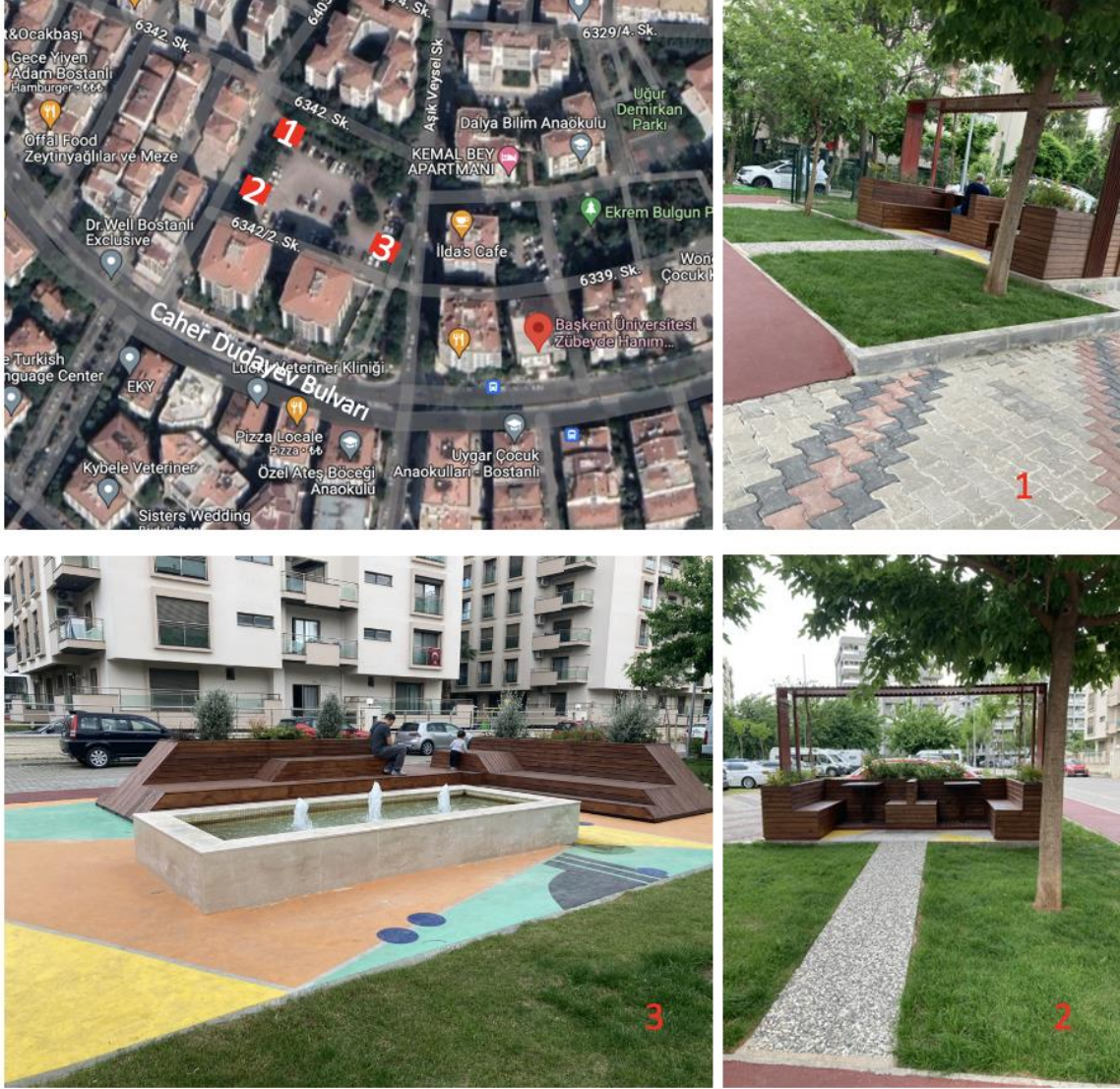
Şekil 4. Karşıyaka Atakent'te bulunan iki adet parklet ve yaya plazasının konumları ve tasarımları (1. Parklet, 2. Parklet, 3. Yaya Plazası)

olmaya elverişli bir yer olmadığı kanaatine varılmıştır. Nitekim alandaki parkletlerin ve plazanın alan ziyaretleri esnasında çok az sayıda insan tarafından kullanıldığı gözlemlenmiştir.