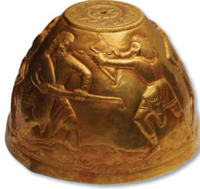
Fotoğraf 7: Stavropol'deki kurgandan elde edilen altın kap (www.nationalgeographic.com, 2016)

biridir. Ok, yay, sadak ve mızrak gibi İskit savaşçıların en çok kullandıkları savaş araç ve gereçleri bu kap üzerinde de görülmektedir. Herodotos'da da dile getirilen İskitlerin kenevir çekme geleneği (Herodotos, IV:75) ile ilgili bu kap üzerinde bazı izler tespit edilmiştir. Yapılan araştırmalar sonucunda kabın iç kısmında bazı kenevir kalıntılara rastlanmıştır, bu kabın da kenevir için kullanıldığı düşünülmektedir (nationalgeographic.com, 2016).