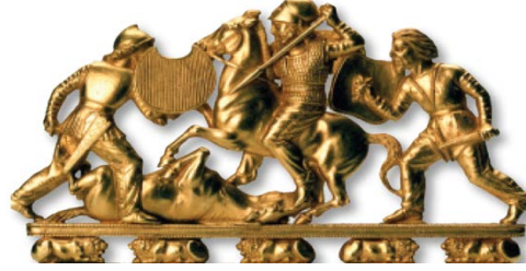
Fotoğraf 1: Solokha'ya ait İskit tarağının detayı

İskit savaş sahnesini canlandıran materyallerden bir iSolokho Kurganı'nda bulunan altın taraktır (Fotoğraf 1). Tarak üzerine savaşçılar ve atların olağanüstü bir kuyumculukla işlenmesi söz konusudur. Savaşçılarla atlarındaki beş tane yatar durumdaki aslanlar, kabartma biçiminde yapılmış olduklarından heykel izlenimi vermektedirler. Atlılardan biri atından düşmüş, rakibi ölümle tehdit etmektedir. 10 santimetre genişliğindeki bu tarağı yapan Grek kuyumcu, yapıtına Yunan özellikleri de katmıştır. Miğferler ve zırhın bunlar arasında olduğu söylenebilir (Piotrovsky, 1976: 8). Bunun gibi bazı sanat ürünlerinde Grek sanatına dair bazı esintiler göze çarpmakta ancak bunlar her durumda İskit sanatında var olan temel esasları ortadan kaldırmamaktadır (Grakov, 2008: 200).