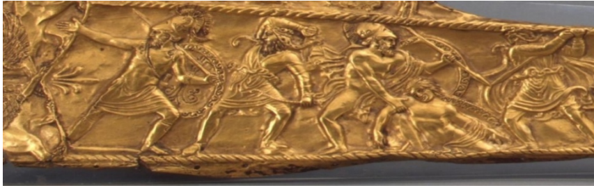
Fotoğraf 5: Chertomlyk'te bulunan İskit kılıç kını detayı