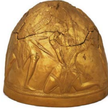
Fotoğraf 4: Perederijeve Mogila'daki altın İskit başlığı (Baumer, 2012: 227)

Önemli İskit kurganlarından biri olan Chertomlyk'ten elde edilen altın İskit kılıç kını; oldukça önemli olduğu sanılan bir Grek savaşını canlandırmaktadır (Fotoğraf 5). M.Ö. IV. yüzyıla tarihlenen ve 54,4 santimetre uzunluğunda olan (hermitagemuseum.org, 2016) kılıç kını üzerinde yer alan savaşçıların bazılarının İskit kıyafetlerine benzer şekilde giyinmiş oldukları göze çarpar. Grek savaşçıları ise kendi geleneksel kıyafetleri ve bazıları Corinthian başlığı giymiş vaziyette bulunur. Grek savaşçının hemen solunda yer alan kişi ise doğulu kıyafetleri giymiş bir savaşçı olup Greklerle mücadele ettiği görülmektedir (Meyer, 2013: 224-226).