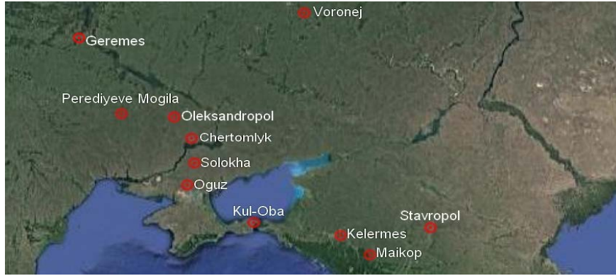
Harita 1: Karadeniz'in kuzeyindeki İskit kurganları (maps.google.com,2016)

Karadeniz'in kuzeyi çok eski tarihlerden beri konar-göçer toplumların yaşamayı tercih ettikleri bir bölge olmuştur (Çoruhlu, 2016: 297). Bu bölge üzerinde bozkır kültürlü toplulukların zamanında oldukça önemli bir otorite olduğu bilinir (Pliny, IV: 41-44). İskit krallarının mezarlarına Doğu Avrupa ve İç Asya bölgelerinde rastlanmıştır. Bu kurganların en ünlü örnekleri ve arkeolojik buluntu açısından en değerli parçaları Karadeniz'in kuzey tarafında yer alanlardır (Harita 1) İskit sanatı ve yaşayışı hakkında en detaylı bilgileri; günümüzde Ukrayna sınırları içerisinde yer alan ve buradaki büyük kurganlar başta olmak üzere Chertomlyk, Solokha, Kul-Oba, Kelermes gibi Karadeniz'in kuzeyindeki kurganlar sayesinde öğrenebilmekteyiz. Bu kurganlardan elde edilen bulgular yazısız kaynaklardır.