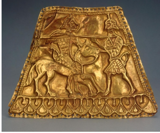
Fotoğraf 8: Geremes Kurganı'ndan bulunan altın plaka

Bahsedilen arkeolojik buluntuların yanında İskitlerin hem Karadeniz'in kuzeyinde, hem de Sibirya'daki kurganlarında yer alan eşyalar üzerinde oldukça fazla sayıda savaş unsuru ile karşılaşmak mümkündür. Ancak bu gündelik eşya üzerine savaşçılıkla ilgili betimlemelerin yerleştirilmesi geleneği Karadeniz'in kuzeyinden elde edilen kurgan buluntularında çok daha yaygın olan bir durumdur.