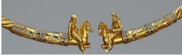
Fotoğraf 3: Kul-Oba altın gerdanlığından detay (www.hermitagemuseum.org, 2016)

Kul-Oba Kurganı içerisinde bulunan altın gerdanlık ise İskit kuyumculuğunun detaylı işçiliğini gözler önüne sermektedir. M.Ö. IV. yüzyıla tarihlenen (hermitage.org, 2016) bu eser; kurgan içerisinde yatan bir erkeğe ait olup onun boynunda bulunmuştur. Uzunluğu 25,5 santimetre ve ağırlığı ise 450 gram olan bu gerdanlığın bitiş noktalarına oldukça ince ayrıntılar içeren İskit atlıları yerleştirilmiştir (Jacobson, 1995: 120). Atlılar gerdanlığın iki ucundan dışarı taşmaktadır (Fotoğraf 3). Gerdanlık, içi mineyle kaplı bir kılıfın içinde ustaca birbirine dolanmış altı altın telden oluşmaktadır. Bu eserde de yine Yunan üslubundan bazı esintiler yer almakla birlikte özünde İskit sanatının değerleri var olmaktadır (Piotrovsky, 1976: 6).