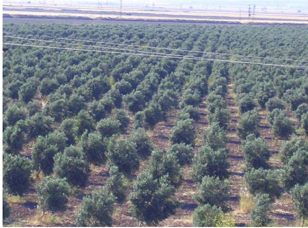
Şekil 3. Modern Zeytin Bahçeleri (Akhisar)

Nitekim 2000 yılında 97 770 000 adet toplam ağacın, 89 200 000 âdeti meyve veren yaşta, 8 570 000 adeti meyve vermeyen yaşta iken 2008 yılında toplam ağaç sayısının 151 630 000 adete, meyve veren yaşta ağaç 106 139 000 adete, meyve vermeyen yaşta ağaç ise 45 491 000 adete ulaşmıştır. Bu artış sadece miktar olarak değil “Geleneksel Zeytin” bahçelerinden “Modern Zeytin” bahçeleri tesisine dönüş olarak gerçekleşmiştir. Çünkü 2004 yılından bu yana verilen fidan desteği en az 10 dekar kapama bahçe şartı ile verilmektedir (Şekil 3). (Şekil4).