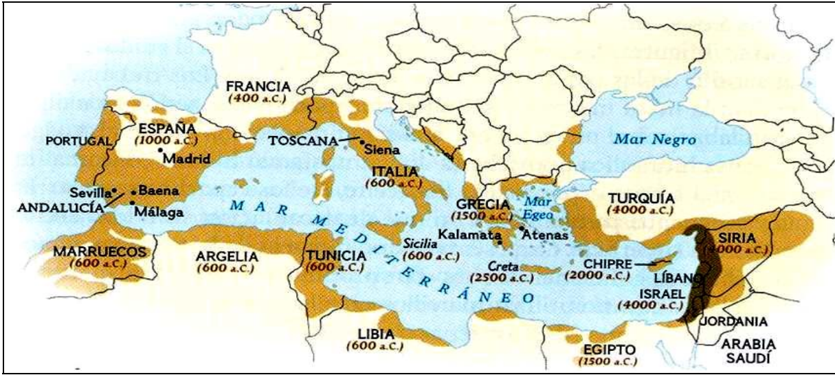
Şekil 1. Dünyada Zeytinciliğin Tarihçesi ve Yayılışı (Rallo ve ark., 1999.)

Zeytincilik, antik çağdaki önemini 13. yüzyılda Anadolu topraklarında kurulan Osmanlı İmparatorluğu’nda bazı hayırseverlerin çok sayıda ve geniş zeytin bahçeleri tesis ederek bunları vakıflara bağışlamalarıyla yine bu bölgede devam ettirmiştir. Tarih incelemeleri, Osmanlı padişahlarından III. Selim’in annesi Mihrişah Sultan ve diğer birçok ünlü kişi tarafından Muğla, Aydın, İzmir, Çanakkale ve Balıkesir illerindeki 29 bin dönüm alana yayılmış 304 bin zeytin ağacının ‘fakirlerin yararlanması’ amacıyla vakıflara hibe edildiği bildirilmektedir (www.tumgazeteler.com). Ayrıca seferlerde