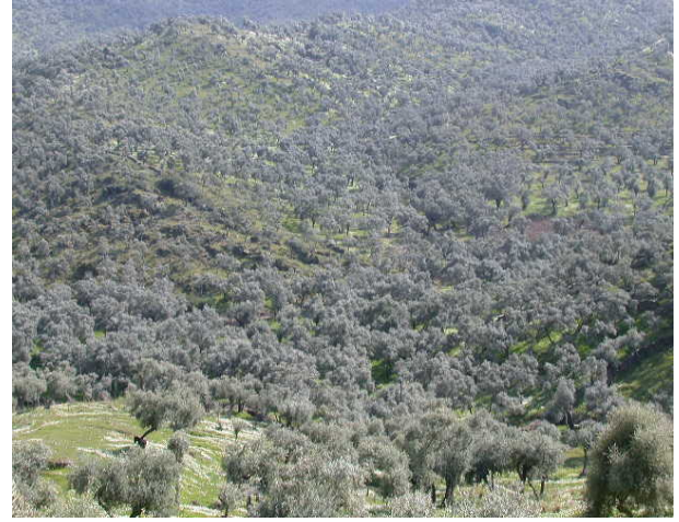
Şekil 4. Geleneksel Zeytinlikler (Aydın)

ise gıda sicili alan işletme sayısı 388’den 823 âdete ulaşmıştır. Bu işletmeler sadece zeytin üretiminin yapıldığı illerde değil, diğer illerde de mevcuttur. Gıda sicili ve üretim izni alan işletmelerin varlığı Türk Gıda Kodeksi kapsamında, gıda güvenliği anlamında ve uluslararası taahhütlere dayalı ilk adımdır (TBMM, 2006).