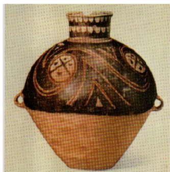
Рис.2 Кувшин эпохи Яньшао (III тыс. лет до н.э.)

Символ, изображенный на кувшине эпохи Яньшао (рис.2), и на трипольских скульптурах (рис.3) имеют вполне определенное трехуровневое членение, в то же время являясь тетрадными моделями. Здесь мы можем говорить о принципах миропонимания наших древних предков. Верхний мир, нижний мир и парный (мужской и женский) средний мир здесь сконцентрированы в одном знаке – знаке плода. Для образования плода необходимо взаимодействие всех этих сил, в отличие от вегетативного пути, где достаточно взаимодействие верхнего и нижнего миров.