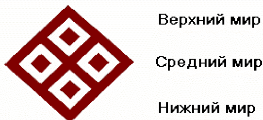
Рисунок 1. Знак плода, изображающий три уровня мироздания.

На уровне мифологического сознания, создавшего этот орнамент три уровня символизируют верхний мир, нижний мир и средний, парный мир или три космические потенции по теории ицзин, китайской классической книге перемен: небо, земля, человек. На уровне среднего мира человек разделен на парное родительское, мужское и женское начала.