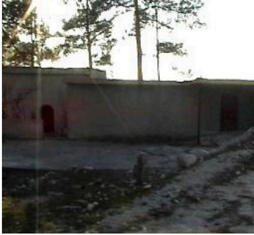
Şekil 3: Ali Baba Türbesi (Öz, 2008, s. 527)

Nasrullah köyünün yakınında olup bugün de ziyaret edilip dua edilen ve namaz kılınan en yakın türbe/ziyaret alanı, Ali Baba Türbesi'dir 16 . Bu durumda, bizce Kara Henk Sultan Tekkesi, günümüzün adlandırmasıyla Ali Baba Türbesi ile aynı yerdir. Türbenin bulunduğu alan tescilli ve I. derece arkeolojik sit alanıdır. Türbe, köyün 4 km güneydoğusunda, 36026'49,79" K, 33042'48,57" D koordinatlarındaki 765 m rakımlı tepe üzerindedir (Şekil 3). Tepenin 2,5 km güneyinde Ortaören, 3 km güneydoğusunda Keben köyleri bulunmaktadır.