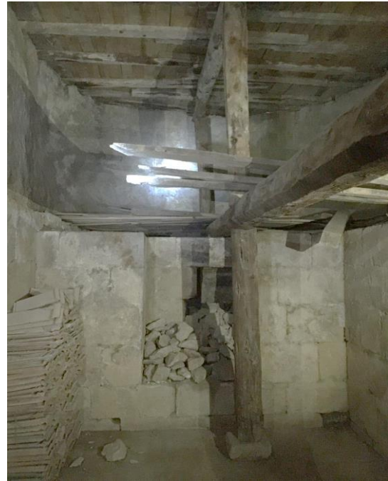
Şekil 12. Kıbrıslar Köyü Cami alt kot iç mekân