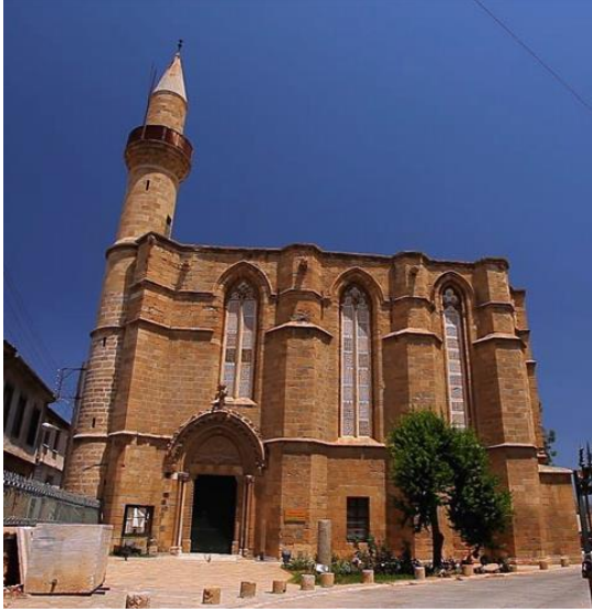
Şekil 4. St. Catherine Kilisesi/Haydarpaşa Camii-Lefkoşa

tarafından restore edilmeye başlandıktan sonra, 1950'li yıllarda yapı evlilik ve kayıt ofisi olarak kullanılmıştır. 1986 ve 1991 yılları arasında tekrar restore edilmiş ve Haydar Paşa Cami olarak yeniden adlandırılmıştır. Günümüzde sanat galerisi ve müze olarak kullanılmaktadır.