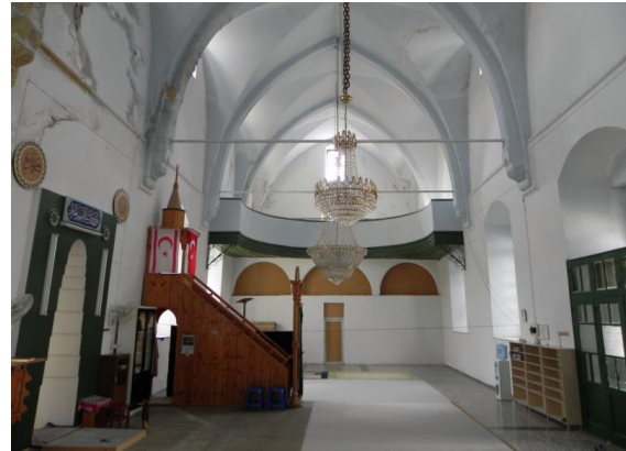
Şekil 5. Panayia Chardakiotissa Kilisesi/Başpınar Camii iç mekân-Değirmenlik

yapmıştır. Günümüzde ise ağırlıklı olarak çoğu Trabzon'dan getirilmiş Türk göçmenler ve adanın güneyinde yer alan Larnaka bölgesinden göç etmek zorunda kalmış Kıbrıs Türkleri yaşamaktadır. 1902 yılında inşa edilmiş köydeki en büyük kilise olan yapı 1975 yılında camiye dönüştürülen ilk kilisedir. Gunnis'e göre [38], kilisenin galerisinde 17. yüzyıla tarihlenebilecek simgeler bulunmaktaydı, ancak günümüzde yapının iç mekânında orijinal tasvirlerden, duvar resimlerinden veya süslemelerinden hiçbir iz rastlanmamaktadır. İç mekânda duvarlar beyaz badana yapılmış, taş zemin halı ile kaplanmış, güney duvara mihrap eklenmiştir. Ahşap minber ise daha sonra yapılan bir eklemedir (Şekil 5). Kilisenin dışında ise çan kulesinin üzerine eklenen küçük ölçekli minare haricinde pek bir değişiklik yapılmamıştır.