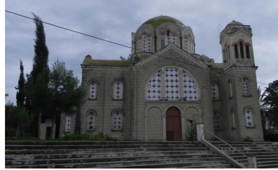
Şekil 7. Agios Sergios Kilisesi/Pamuklu Köyü Eski Cami

Bir diğer örnek ise Karpaz/Karpas yarımadasında bulunan Pamuklu/Tavrou'daki Agios Sergios kilisesidir (Şekil 7). Bu köyde de 1974 yılı öncesinde sadece Rumlar yaşamaktaydı. 1974 yılı sonrasında ise Pamuklu Köyü Giresun, Ordu ve Yozgat'tan göç eden Türklere ev sahipliği yapmıştır. Köyde bulunan Agios Sergios Kilisesi silindirik bir kasnak üzerine yerleştirilmiş kubbe ile örtülü geniş kütleliyle 19. yüzyılın tipik bir örneğidir. Ayrıca kilisenin batı cephesinin her iki yanında çan kuleleri vardır. 1974 sonrasında camiye dönüştürülmüş, ancak 2010 yılında hemen yanına yeni cami yapıldığı için terkedilmiştir.