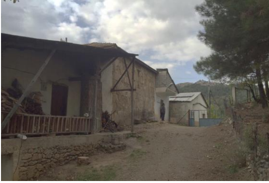
Şekil 10. Kıbrıslar Köyü Cami doğu yönde giriş cephesi

Adana il sınırları içinde Kozan İlçesi Kıbrıslar Köyü'nde kiliseden camiye dönüştürülmüş bir yapı bulunmaktadır. Kıbrıslar Köyü Cami hakkında yazılı bilgiye ulaşılmamıştır. Mimari niteliklerine dayanarak kilisenin Bizans dönemine ait olduğunu ve zaman içinde değişikliklere uğradığını söylemek mümkündür. Bugünkü haliyle özgün kilise yapısının kuzey duvarına bitişik tek katlı betonarme ek yapılmak suretiyle kullanım alanı genişletilmiş, güney duvarın bir kısmına bitişik olarak da imam için konut inşa edilmiştir (Şekil 10).