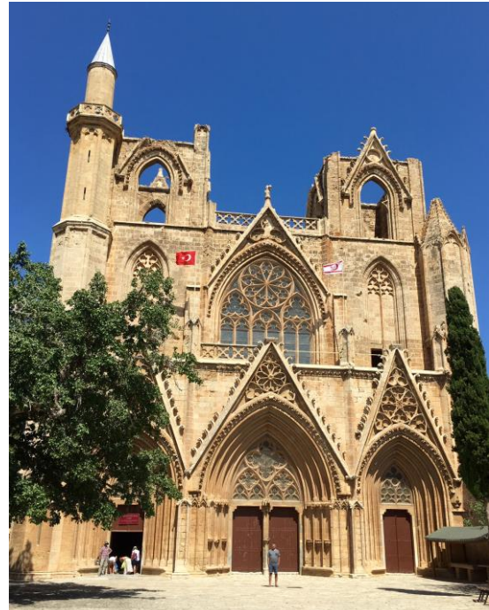
Şekil 1. Saint Nicholas Katedrali/Lala Mustafa Paşa Cami-Gazimağusa

Notre Dame Katedrali'nden esinlenerek inşa edilen katedral [37] ve Kudüs Kralı'na taç giyme töreninin yapılması nedeniyle Hristiyanlar için önem taşımaktadır [38]. St. Nicholas'ın oldukça iyi işlenmiş Gotik mimari etkili batı yöndeki giriş cephesinin iki yanındaki çan kulelerinden kuzeydekinin yerine yapı camiye dönüştürüldükten sonra zarif bir minare yapılmıştır (Şekil 1).