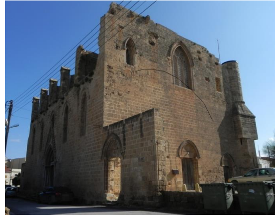
Şekil 3. St. Peter ve St. Paul Kilisesi/Sinan Paşa Cami-Gazimağusa

(Şekil 3). Mağusa surlar içinde yer alan yapı Latin kilisesi olarak kullanılırken 14. yüzyıl ortalarında Osmanlılar tarafından camiye dönüştürülmüştür. Yapısal sorunları nedeniyle sonraları ahır, tahıl deposu ve kütüphane olarak hizmet vermiştir. Bir süre boş kalan cami, 2009 yılında USAID'in finansal desteğiyle restore edilerek kültürel amaçlı kullanılmak üzere Gazimağusa Belediyesi'ne devredilmiştir. Yapıldığı dönemin Gotik kiliselerine göre ham ve ağır görümlü yapının biri batıda diğeri kuzeyde iki girişi vardır. Kuzey girişinin 1940 yılında pencereden kapıya dönüştürüldüğü bilinmektedir [39]. Cami olarak kullanıldığı için iç mekanda fresk ve süsleme bulunmamaktadır. Ancak son restorasyon çalışmaları sırasında Osmanlı döneminde eklenen mihrabın arkasında kalmış fresk izleri bulunmuş ve 2011 yılında restore edilmiştir.