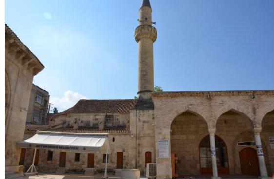
Şekil 8. Yağ Cami/St. Jacques Kilisesi

Adana tarihi kent merkezinde camiye dönüştürülmüş tek kilise bugün Yağ Cami olarak bilinen St. Jacques Kilisesi'dir (Şekil 8). Evliya Çelebi, Seyahatnamesinde yapıdan Eski Cami adıyla söz etmektedir. Ramazanoğlu Halil Bey tarafından 1501 yılında kiliseden camiye çevrildiği, daha sonra yapının avlusu etrafında yer alan son cemaat yeri, taç kapısı ve medresesinin oğlu Piri Paşa tarafından yaptırıldığı bilinmektedir [50]. Caminin kuzeybatı köşesinde yer alan minaresi 1525 yılında yaptırılmış ve 1941 yılında yenilenmiştir [50].