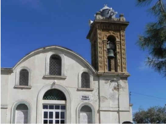
Şekil 13. Tuzla Cami

Kuzey Kıbrıs'ta 1991 den beri, özellikle de kiliselerin camiye dönüştürüldüğü köylerde, yeni camilerin yapımında artış olmuş ve cami olarak kullanılan 20 kilise binası terkedilmiştir. Rum toplumu tarafından ne kadar eleştirilse de, yapılan çalışma kiliselerin atıl bırakılmak yerine zarar vermeyecek kullanımlara uygun biçimde dönüştürülmelerinin korunmalarında önemli rol oynadığını göstermektedir.