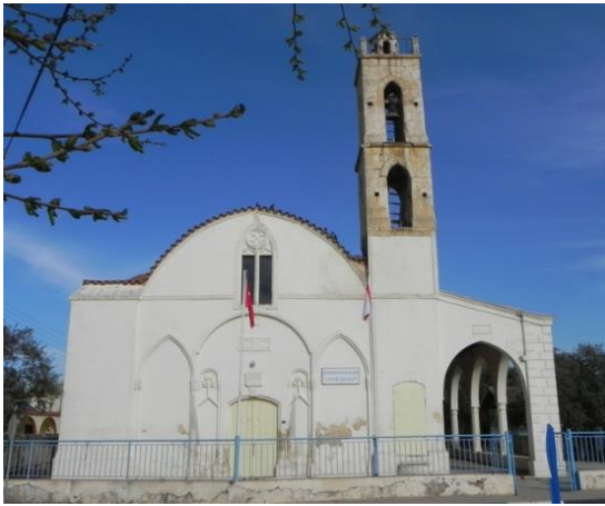
Şekil 6. Agios Nikolaos Kilisesi/Mormenekşe Köyü Cami

1974 yılından sonra camiye dönüştürülen 70 kiliseden 20 tanesi 1991 den bu yana yapılmakta olan yeni camiler nedeniyle cemaatini kaybetmiş ve terkedilmiştir. Bu çalışmada sunulan ilk örnek yapı Mormenekşe'de bulunan Agios Nikolaos Kilisesi'dir (Şekil 6). 1831 nüfus sayımına göre köyde yaşayanların tümü Rumlardan oluşmaktaydı. İngiliz Hükümeti döneminde nüfus durumu değişmemesine rağmen, 1974'de köyde yaşayanların yerine Larnaka bölgesinden göç eden Kıbrıs Türkleri yerleştirilmişlerdir. Daha sonraları, 1976 ve 1977 yıllarında, çoğunlukla Adana'dan gelen Türk nüfus da köye yerleşmiştir. Mormenekşe Köyü kilisesinin geçmişi, kuzey cephede yer alan giriş kapısı üzerindeki kitabesine göre 1863 yılına dayanır. Kiliseyi özel kılan bir karakteristiği doğu duvarındaki İsa kabartmalarıdır. Bu kabartmalar camiye dönüşüm sürecinde yok edilmemiştir. Kilise Kıbrıs Türklerinin gelmesiyle 1975 yılında camiye dönüştürülmüş ve 2010 yılına kadar kullanılmıştır. Günümüzde ise köye yapılan yeni cami Müslüman Türk toplumunun ibadet ihtiyacını karşılamaktadır.