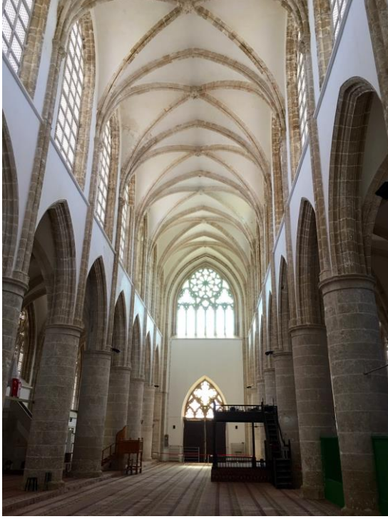
Şekil 2. Lala Mustafa Paşa Cami iç mekan

minareli olup iç mekanında tuğra tasvirleri bulunmaktadır.