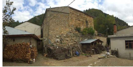
Şekil 11. Kıbrıslar Köyü Cami batı cephe

Yapı dış kütlesi bakımından kilise tipolojisine uygun izlenim vermemekle birlikte bu durumun zaman içinde yapılan değişikliklerden kaynaklandığı söylenebilir (Şekil 11). Yapı eğimli bir arazi üzerinde konumlanmakta ve bugün üst kottan giriş almaktadır. Ancak, alt kotta yapının önceki dönemlerine ait izler barındıran güney yönde bir giriş daha mevcuttur. Tonozlu bir mekânla geçilen alt kotta yapının önceki dönemde de cami olarak kullanıldığını gösteren güney duvarda mihrap nişi bulunmaktadır. Bu niş yukarıda bugün kullanılan mekânda yer alan mihrap nişi ile aynı aks üzerindedir. Yapı bugün tespit edemediğimiz ancak detaylı araştırma ve belgeleme çalışmaları sonucu anlaşılabilirken nedenlerle kısmen yıkılmış ve ahşap döşeme dikmelerle üst kotta taşınmıştır (Şekil 12).