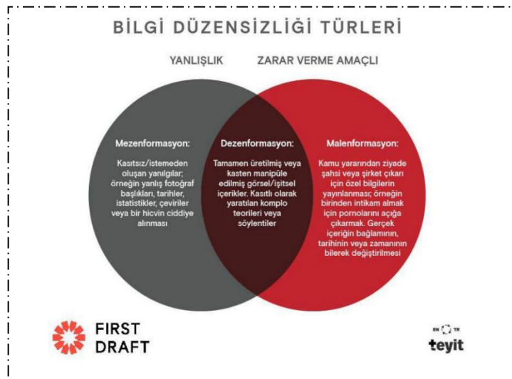
Şekil 1: Üç Tip Enformasyon Sorunu

Basında üç tip enformasyon sorunu (Şekil 1) olduğuna dikkat çeken Derakhsan ve Wardle, bunları şöyle tanımlamaktadır (Derakhsan & Wardle, 2017, s. 19-20): Dezenformasyon: Bireye, sosyal gruba, kuruluşa ve ülkeye zarar verme amacı güden kasıtlı biçimde oluşturulan yanlış bilgiler. Mezenformasyon: Yanlış olan ancak zarar verme niyetiyle oluşturulmamış bilgiler. Malenformasyon: Kişiye, kuruma ve ülkeye zarar vermek amacı güden, gerçekliğe dayalı bilgiler. Malenformasyon kavramı, kasıtlı olarak ve gerçeğe yaslanarak enformasyonun odağa aldığı kişi, kurum, toplumsal grup ya da siyasal partiye zarar verme amacını taşımaktadır. Genellikle, toplumun ilgisini çekebilecek temalar seçilmekte ve haber çerçevelemesinde öne çıkarılmaktadır (Wardle, 2020, s. 71-72).