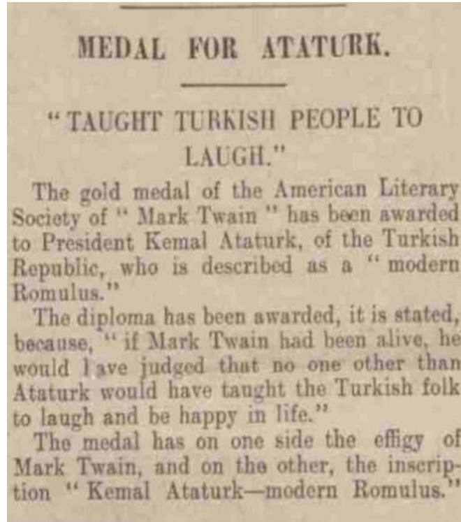
The Nottingham Evening Post, 8 Aralık 1937, 4.