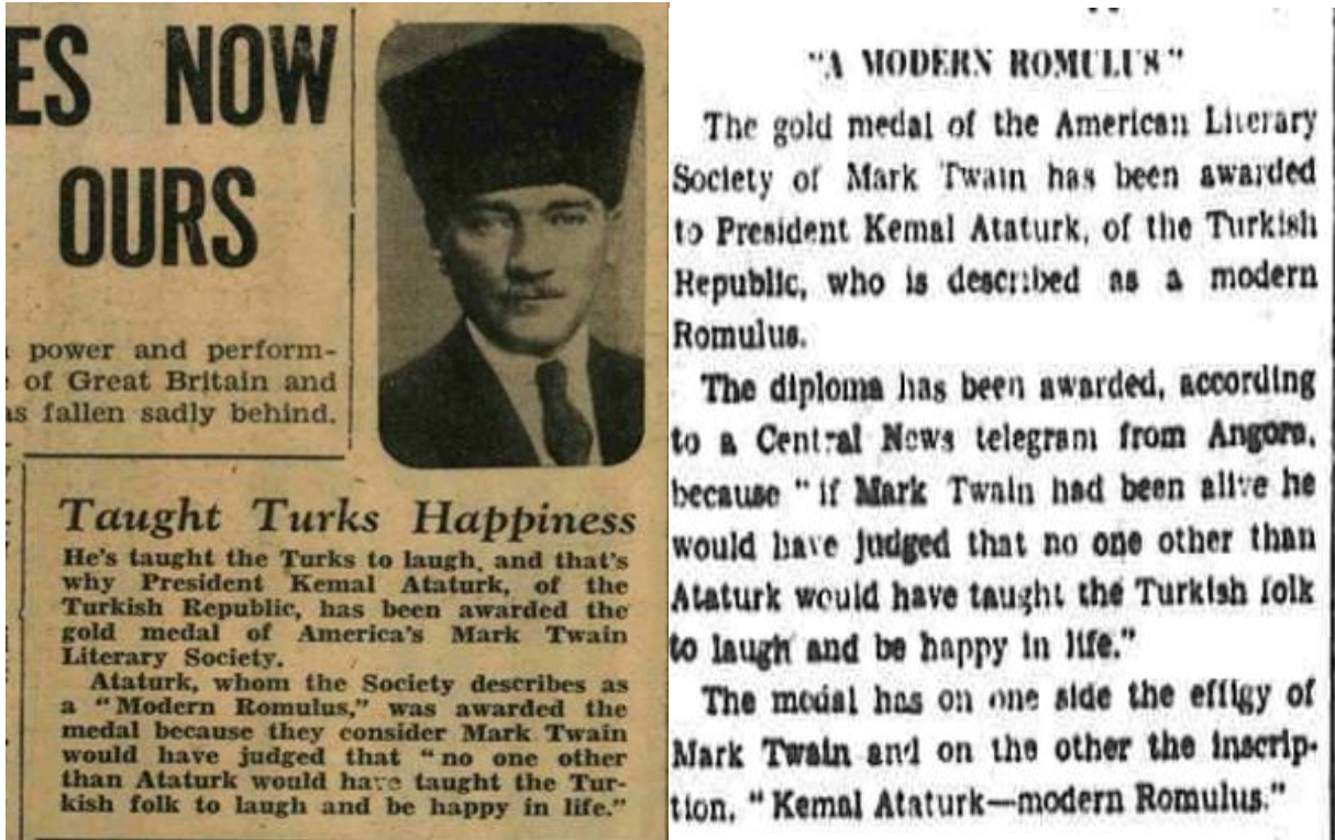
Daily Mirror, 09 Aralık 1937, 20.