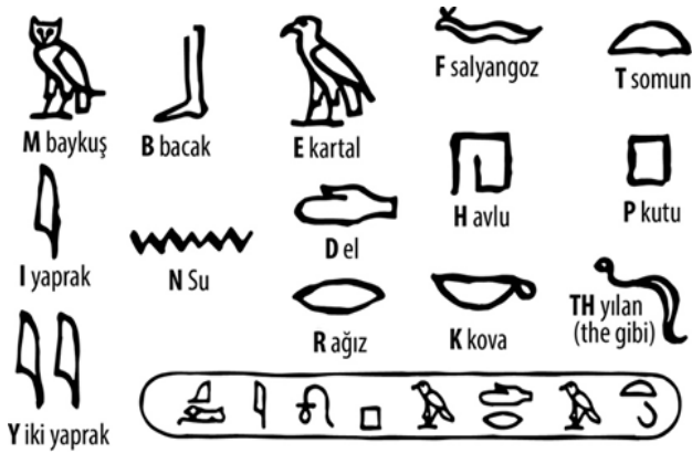
Görsel 2. Sözcük yerine resim ve sembollerin kullanıldığı resimyazılar (hiyeroglifler)

İnsanoğlu, yazılı bir dil oluşturmadan önce, piktogramlardan yani resimyazılardan yararlanmıştı. Resimyazı, sözcüklerin sessiz iletişim biçimi olarak kullanılmasının ilk denemeleridir (Görsel 2).