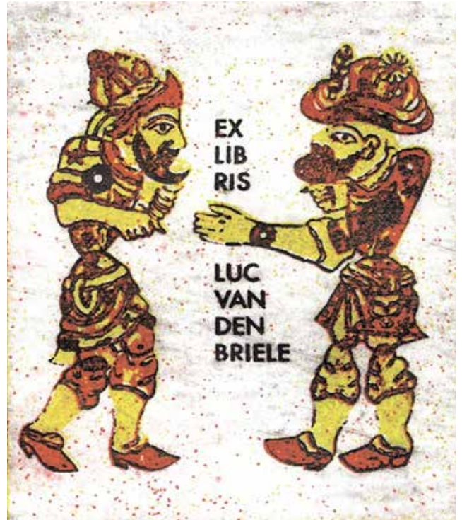
Görsel 6. Hasip Pektaş, C3 (10x7,8 cm), 1995

Geri bildirim iletişimin sonuç göstergesidir. Geri bildirim iletişim türüne göre farklılık gösterir. Örneğin yüz yüze verilen dersteki iletişim ile online yapılan dersteki iletişim arasında geri bildirim farklıdır. Yüz yüze iletişimde gözlerle bile olsa alıcıdan iyi bir geri bildirim alabiliriz ve bu süreklilik gösterir. Ekslibris tasarımcısının iletişimi ise ekslibris siparişi veren kişiden aldığı tepkilerle, geri bildirimlerle gerçekleşir. Elbette öncesinde sipariş veren kişinin kodladığı mesaj, özellik, tasarımcı tarafından görsel dile dönüştürülür. Tasarımcı bu oluşumda kendi kodlarını, yorumlarını mutlaka ekler. Aslında tasarımcı, çalışmasıyla onu izleyen her bireye bir iletide bulunur. Bu iletinin aktarımı ise izleyenin ekslibris ile olan etkileşim yoğunluğuna bağlıdır.