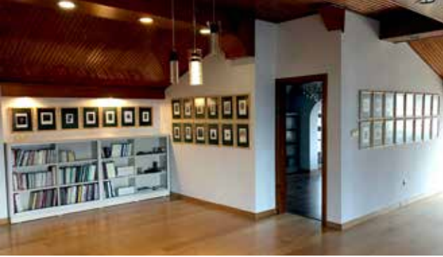
Görsel 5. İstanbul Ekslibris Müzesi'nden bir görüntü.