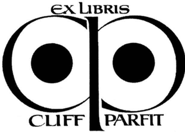
Görsel 4. Hannu Paalasmaa, Finlandiya, T, (4 x 6 cm), 1985

kişiyi özgü bir kimlik yaratma kaygısı öne çıkmaktadır. Bunun da olmazsa olmaz koşulu ekslibrisin özgün bir düzenleme olmasıdır. İster bilgisayarın olanaklarından yararlanarak, ister kaligrafinin çizgi zenginliğini kullanarak yapılsın her ekslibris, harflerin görsel bir biçime dönüşmesiyle diğerlerinden ayrılacaktır. Harfleri oluşturan siyah alanlarla boşlukların dengesi, birbiriyle uyumu, hem algılamayı kolaylaştıracak hem de görseelliği artıracaktır.