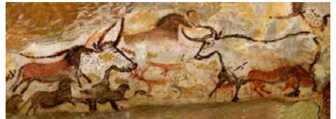
Görsel 1. Fransa'daki Lascaux Mağarası hayvan resimleri

İlkel insanlar, M.Ö. 15.000'de Altamira mağarasında, M.Ö. 25.000'de Lascaux mağarasında yaptıkları hayvan resimleri ile sessiz bir iletişim gerçekleştirmişlerdir. Bu resimlerin dilin gelişimine katkısı olduğu da söylenebilir. O dönemin insanları, gün içinde yaşadıkları olayları birbirlerine bu şekilde aktarmışlardır. Vahşi doğada gördükleri hayvanları, onlara karşı verdikleri savaşı anlatmayı istemişlerdir. Bunlar gerçek hayvanların insanların gücüne boyun eğebileceklerine inanmanın göstergeleri de olabilir. Mağara resimleri, kolay avlanmanın ayini olarak da algılanabilir (Görsel 1).