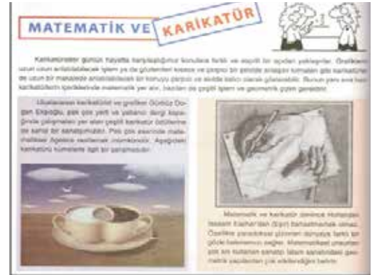
Görsel 5, Gürbüz Doğan Ekşioğlu, 10. Sınıf matematik kitabı, sayfa 116

Sanatçı Gürbüz Doğan Ekşioğlu'na ait bir illüstrasyon (Resim 5) izinsiz ve telifsiz olarak, Millî Eğitim Bakanlığı'nın okullara ders kitabı olarak dağıttığı 10. Sınıf matematik kitabının 116. sayfasında yayınlanmıştır (Orijinali Resim 5'te, yayınlanan kitap Resim 6'da). Ekşioğlu konuyla ilgili olarak, 18 Aralık 2017 tarihinde Facebook sayfasında "Ders kitabında işimin olması güzel ama izin alınsaydı daha iyi olurdu!" demiştir. Görüldüğü gibi Ekşioğlu eserinin yayınlanmasını olumlu bulmakla birlikte, izinsiz kullanılmasına tepki göstermektedir. Kaldı ki hiç teliften bahsetmemektedir.