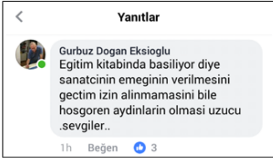
Görsel 7, Screenshot, Gürbüz Doğan Ekşioğlu, Facebook, Erişim: 26 – 12 – 2017

Yazar Buket Uzuner, “Aynı habersiz kullanım birçok edebiyatçının işi için de geçerli. Bana da öğrenciler haber veriyor” ifadesiyle kendisinin eserlerinin de izinsiz ve telifsiz kullanıldığını söylemiştir (Resim 8.)