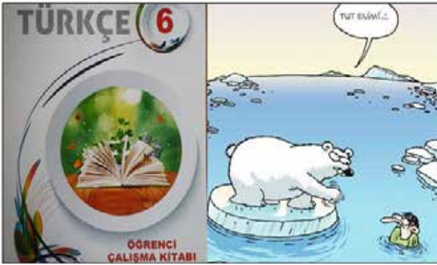
Görsel 2: Türkçe 6. Sınıf çalışma kitabı ve yayınlanan karikatür

Eğitim kitaplarında yaşanan sık hatalar, inceleme komisyonun yetersiz olduğu izlenimi vermektedir.