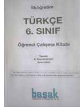
Görsel 1: Türkçe 6. Sınıf kitabı

Millî Eğitim Bakanlığı tarafından yayımlanan 6. sınıf Türkçe kitabında (Resim 1), karikatürist Selçuk Erdem'e ait olan çevreyle ilgili karikatür basılmış, ancak eserde yer alan "ayının yaptığı el hareketinden" dolayı (Resim 3) bu karikatür önce sosyal medyada, sonra basında tartışılmıştır. 6. sınıfta okutulan Türkçe çalışma kitabının künyesinde yer alan bilgiye göre, kitabın yazarlar B. Ümit Bozkurt ve Suna Canlı tarafından kaleme alındığı görülmektedir. Ayrıca, "Millî Eğitim Bakanlığı Talim Terbiye Kurulu'nun 10.02.2017 tarih ve 7 sayılı kurul kararıyla 2017-2018 öğretim yılından itibaren 5 yıl süreyle ders kitabı olarak kabul edilmiştir" ifadeleri kitap görselinde yer almaktadır.