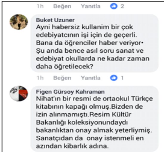
Görsel 8: Screenshot, Gürbüz Doğan Ekşioğlu, Facebook, Erişim: 26 – 12 – 2017.

Yazar Buket Uzuner, “Aynı habersiz kullanım birçok edebiyatçının işi için de geçerli. Bana da öğrenciler haber veriyor” ifadesiyle kendisinin eserlerinin de izinsiz ve telifsiz kullanıldığını söylemiştir (Resim 8.)