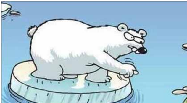
Görsel 3: Selçuk Erdem'in orijinal çalışması

Karikatürü çizen Selçuk Erdem ise Twitter hesabından “Karikatürleri izin almadan kullanırsanız başınıza bunlar gelir. Bana sorsaydınız okul kitabı için uygun olmadığını söyledim” ifadesini kullanmıştır. Bu açıklamayla karikatür için sanatçıdan izin alınmadığını öğrenmiş oluyoruz. Selçuk, pedagojiye uygun bir yayın olmadığını