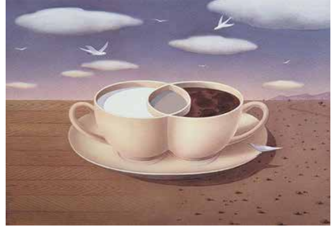
Görsel 6: Gürbüz Doğan Ekşioğlu, CAFE CITY Yayınları, İstanbul, 2003

Paylaşılan resmin altında yapılan yorumlara, Ekşioğlu'nun verdiği cevapların bazıları şöyledir: "Önceden de lise edebiyat kitap kapağında ve başka kitaplarda da yayınlandı. Eğitimi düzenleyenler izin almasını bilseler iyi olur. Öğrencilerin kitaplarında, sanatçı olarak işimin basılmasından mutluluk duyarım.", "Teliften vazgeçtim. Bir teşekkür edilebilir. İzin alınabilir.", "Eğitim kitabında basılıyor diye sanatçının emeğinin verilmemesini geçtim, izin alınmamasını bile hoş gören aydınların olması üzücü." (Resim 7)