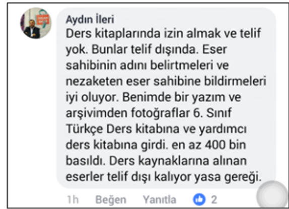
Görsel 10: Screenshot, Gürbüz Doğan Ekşioğlu, Facebook, Erişim: 26 – 12 – 2017

Aydın İleri ise “Ders kitaplarında izin almak ve telif yok. Bunlar telif dışında. Eser sahibinin adını belirtmeleri ve nezaketen eser sahibine bildirmeleri iyi oluyor. Benim de bir yazım ve arşivimden fotoğraflar 6. Sınıf Türkçe ders kitabına girdi. En az 400 bin basıldı. Ders kaynaklarına alınan eserler telif dışı oluyor” (Resim 10) ifadesini kullanmıştır.